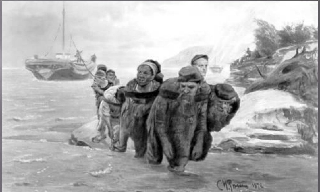
И. Е. Репин. «Бурлаки, идущие в брод». 1872. Третьяковская галерея. Москва.

А. А. Пластов. «Ужин трактористов». 1951. Иркутский художественный музей.