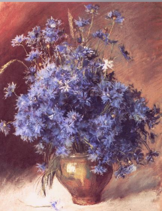
Васильки И. Левитан