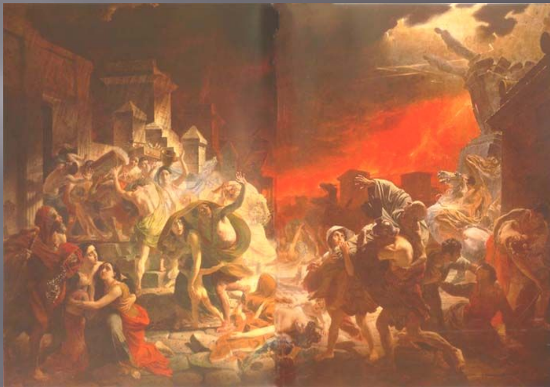
Последний день Помпеи. 1830-1833. Брюлов К.П