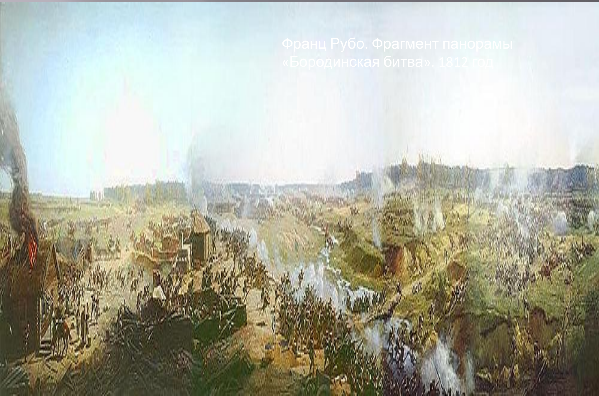
Франц Рубо. Фрагмент панорамы «Бородинская битва». 1812 год