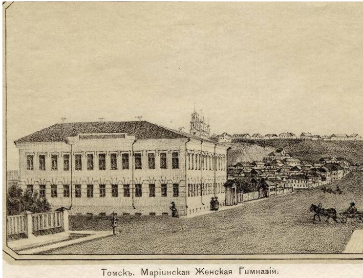
Томскъ. Мариинская Женская Гимназія.