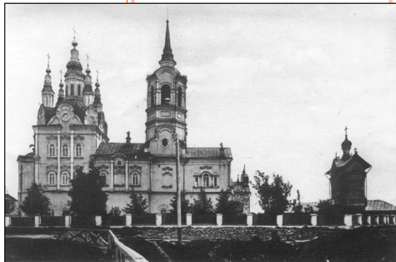
Томский Воскресенский храм, фотография нач. XX века

На открытии здания Церковно-приходской школы для мальчиков и девочек в 1896 году епископ Макарий поставил главную задачу перед педагогами, чтобы развивать в своих воспитанниках «народное мировоззрение — жизни по вере или благочестии». Эта школа, здание для которой построили купцы братья Кухтерины, находилась при Томском Воскресенском храме (сейчас это - Воскресенская церковь , находится на Октябрьском взвозе, бывшем Воскресенском, д. 10 ).