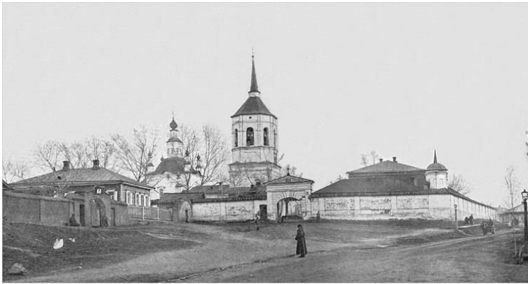
Томский Богородице-Алексеевский монастырь. Фотография кон. XIX - нач. XX вв.