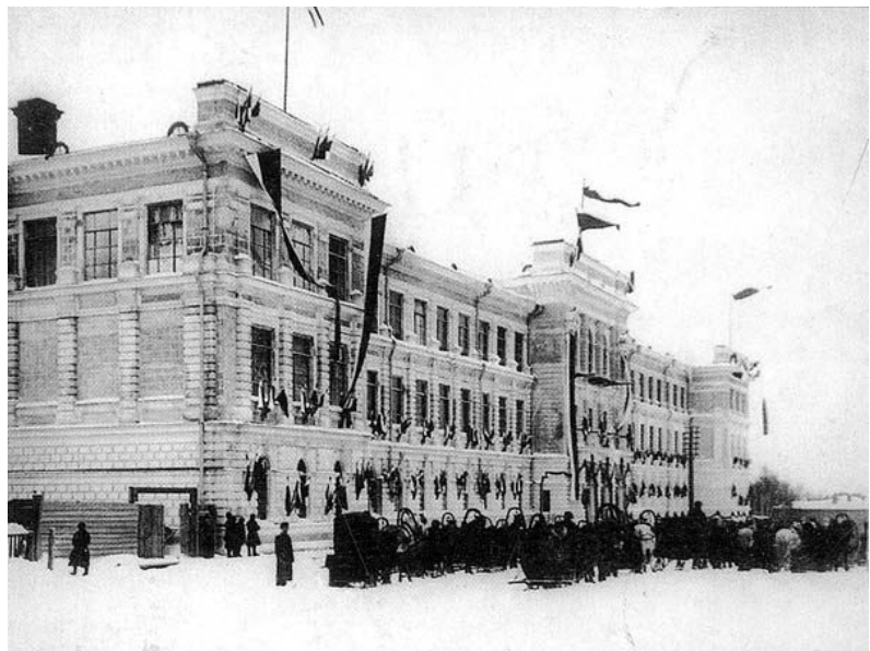
Открытие Томского технологического института. Главный корпус. 1900 г.

В день тезоименитства императора Николая II (6 (18) декабря 1900 г.) на торжественном молебне, ему посвященном, епископ Макарий произнес приветственное слово по поводу открытия в Томске Практического технологического института (сейчас - Национальный исследовательский Томский политехнический университет (ТПУ), учрежденного Императором Николаем II в 1896 г.