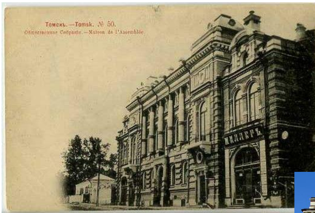
Фотография нач. XX века

До 2011 года - Дом офицеров (пр. Ленина, д. 50).