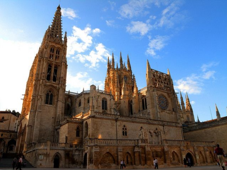
Бургосский собор. Бургос, Испания