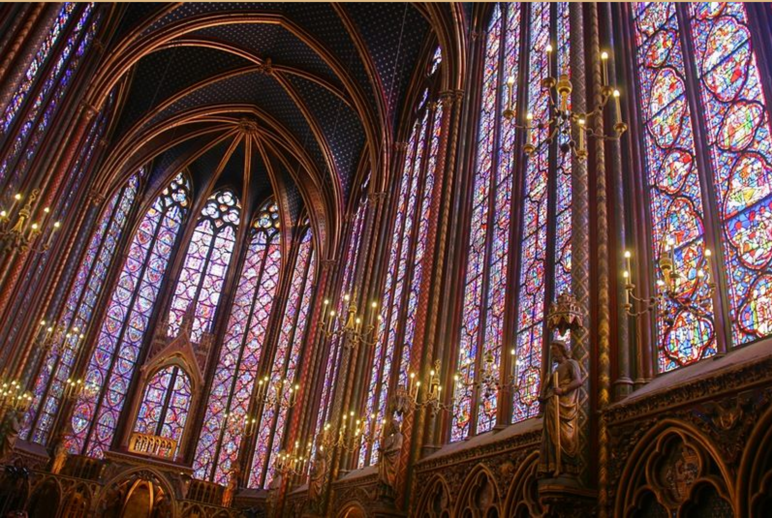
— Своды Святой Капеллы Париж.

Готика зародилась в Северной Франции в середине XII века, где этот архитектурный стиль назвался «оживаль», т. е. стиль стрельчатых арок.