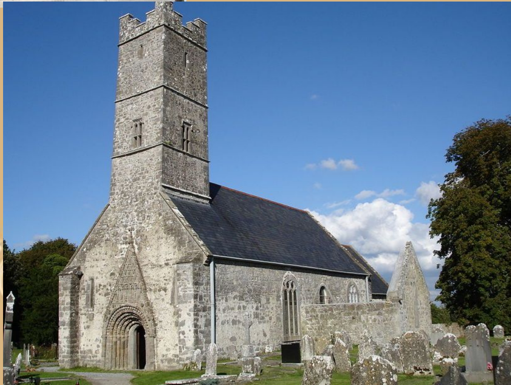
Собор в Клонферте, Ирландия. 12 век