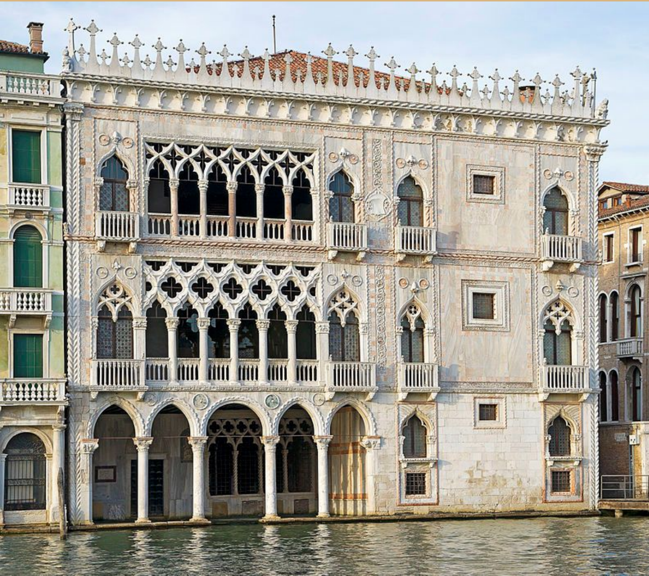
— Ка-д'Оро, Венеция.

Термин «готика» чаще всего применяется к известному стилю архитектурных сооружений, который можно кратко охарактеризовать как «ужасно величественный».