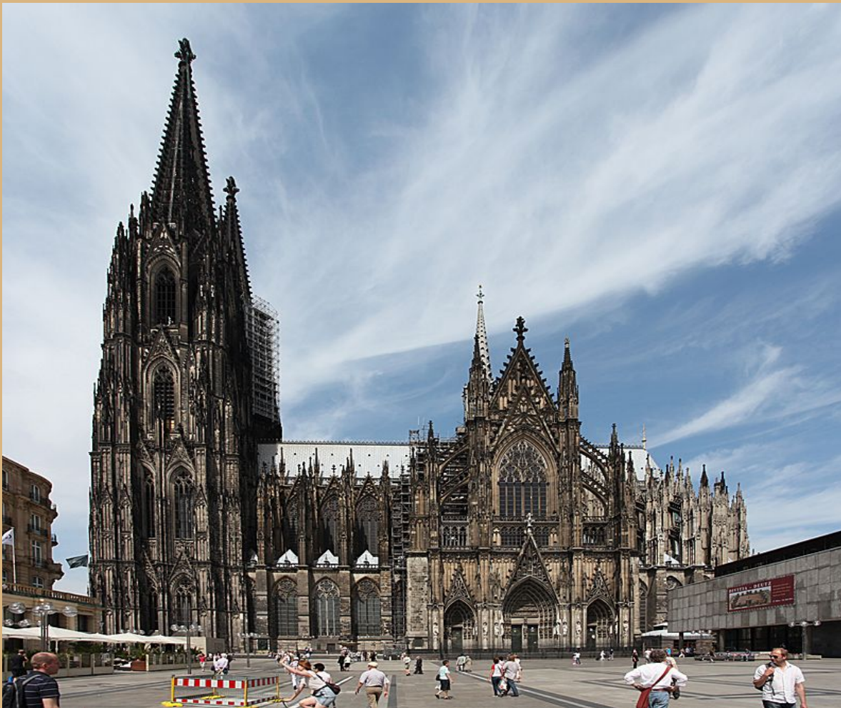
— Кёльнский собор, Германия.