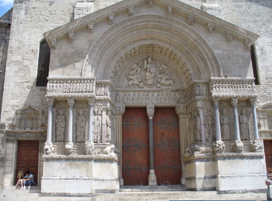
Собор Святого Трофима, Арль, Франция. 15 век