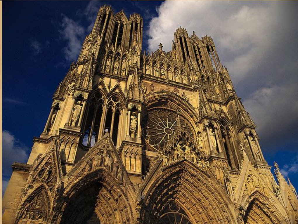
Реймский собор. Реймс, Франция