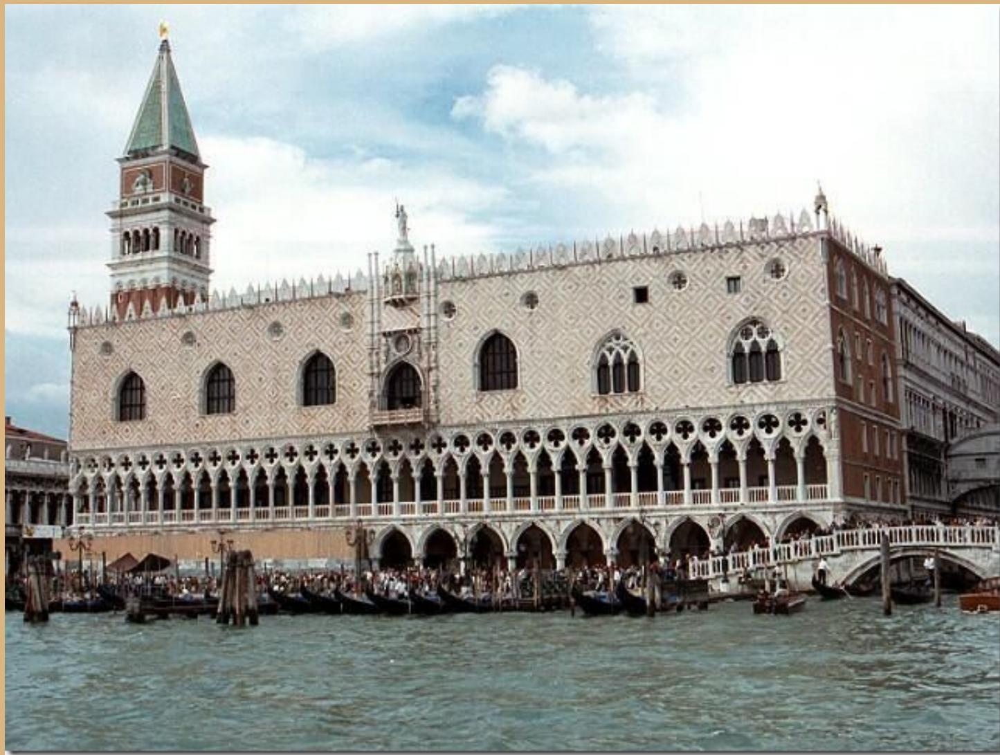
Палаццо дожей — Венеция.