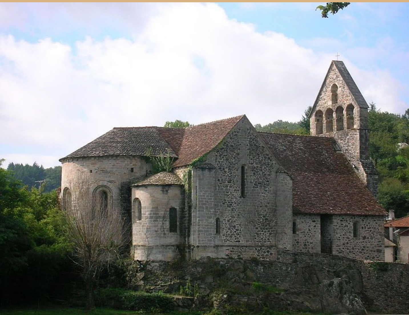
— Капелла кающихся грешников. Больё-сюр-Дордонь

Романский стиль — этап развития средневекового европейского искусства, художественный стиль, господствовавший в Западной Европе, а также затронувший страны Восточной Европы, в 10-12 веках, в ряде мест до 13 века