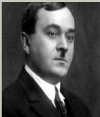
А.В.Александров «Священная Война» (1941)