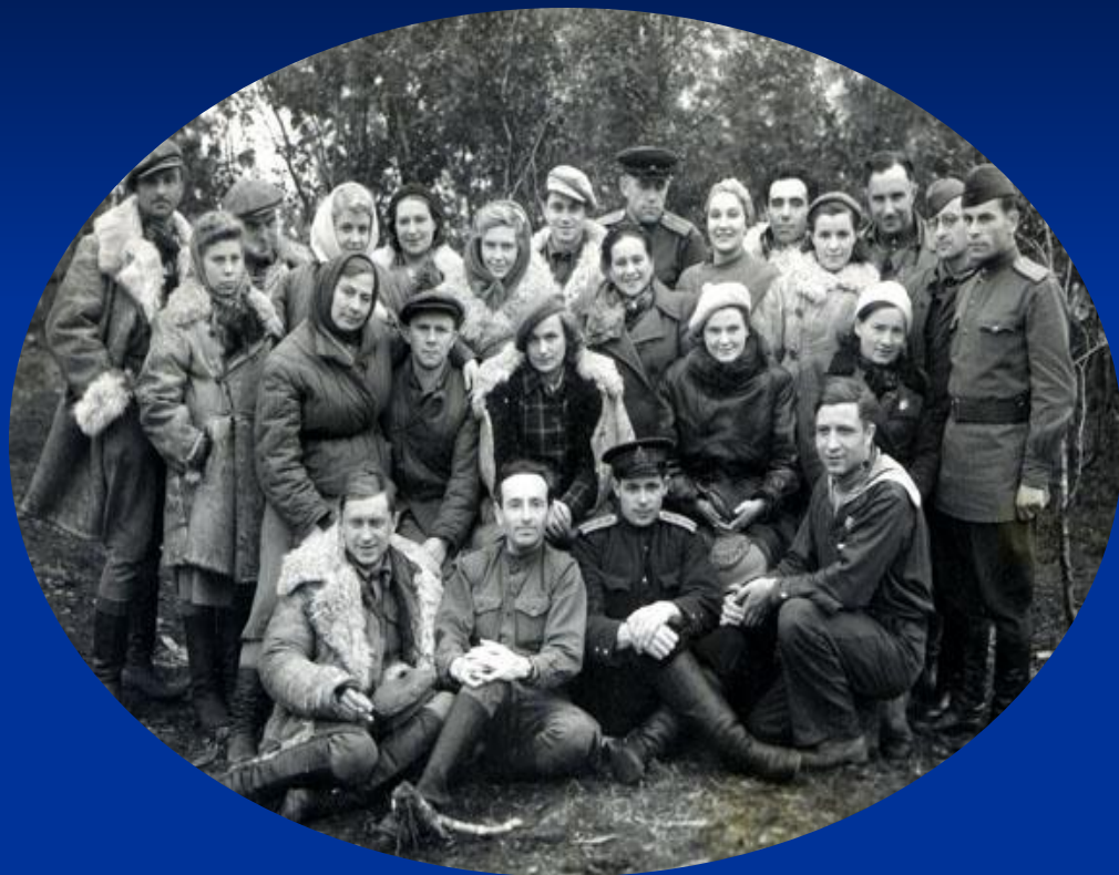
Фронтвой филиал Малого театра, сентябрь 1943 года

За время войны было создано около 3800 театрально-концертных бригад, которые давали концерты на передовых позициях, кораблях, аэродромах, в госпиталях - на всех бесконечных дорогах войны. Всего на фронт выезжало более 42000 артистов. Особой любовью у бойцов пользовались такие коллективы, как фронтовые филиалы театра имени Евг. Вахтангова, Малого театра, фронтовые театры ВТО, театры "Искра", "Веселый десант", "Огонек" и другие.