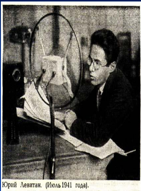
Юрий Левитан. (Июль 1941 года).