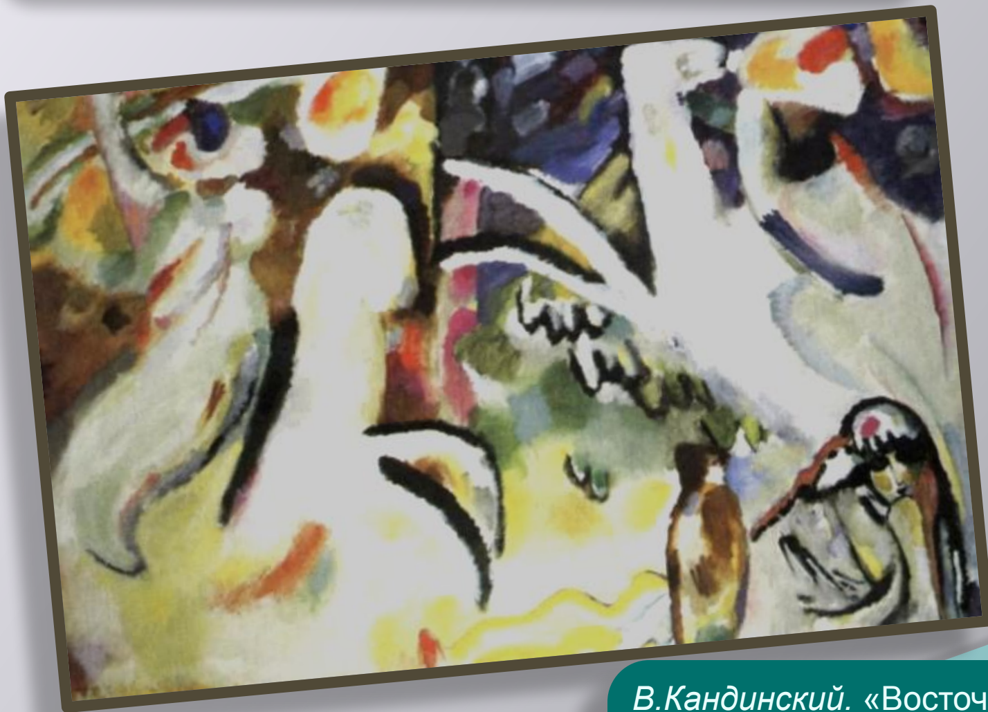
В.Кандинский. «Восточная сюита»

Абстрактные, или беспредметные композиции В.Кандинского - это музыка в красках.