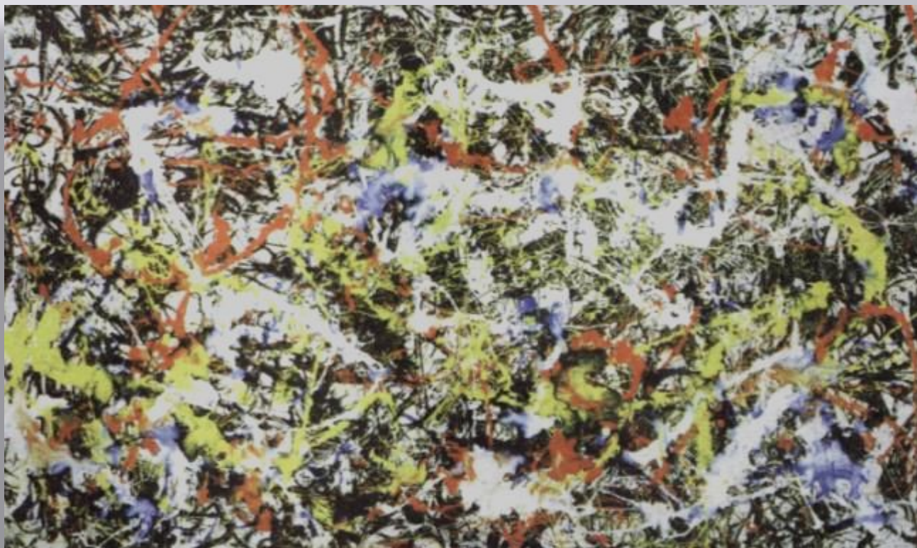
Дж. Поллок «№7» США

Но искусство живет и развивается. Потому что стремление к творчеству, желание взглянуть на мир по-своему - одно из главных качеств человеческой личности.