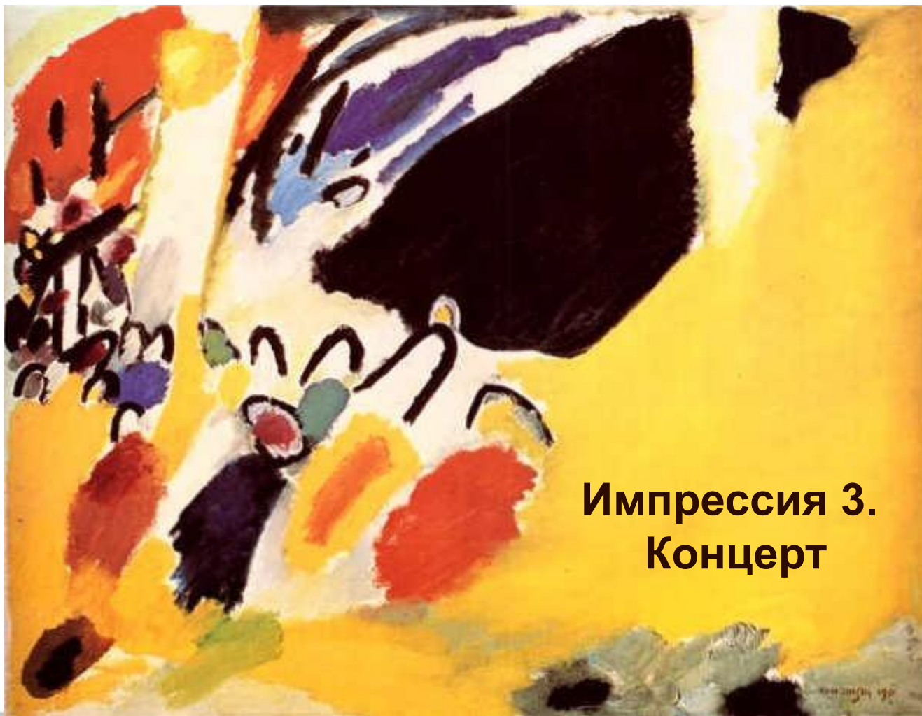
Импрессия 3. Концерт