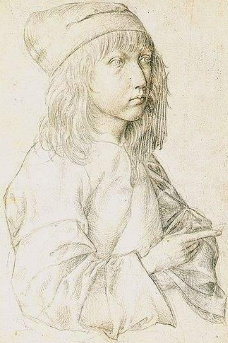
Автопортрет. Рисунок серебряным карандашом

Das hat der meiste ein pappell nach wie solches künstlich ist 1487 in der 18. nach ein künstler in künstler