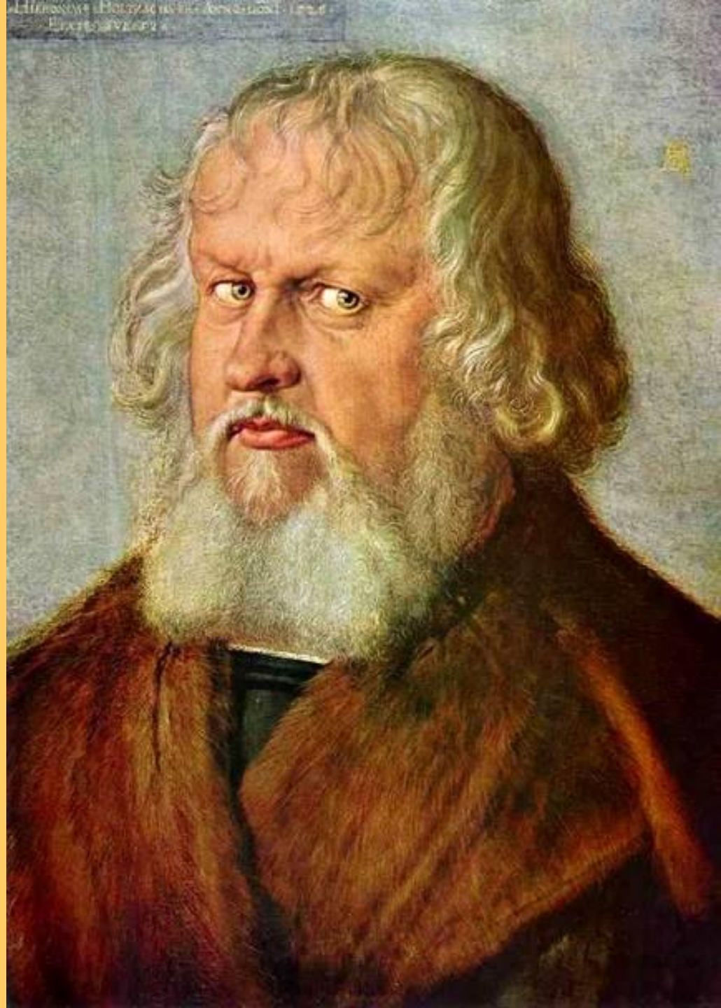
Портрет Иеронима Хольцшюэра