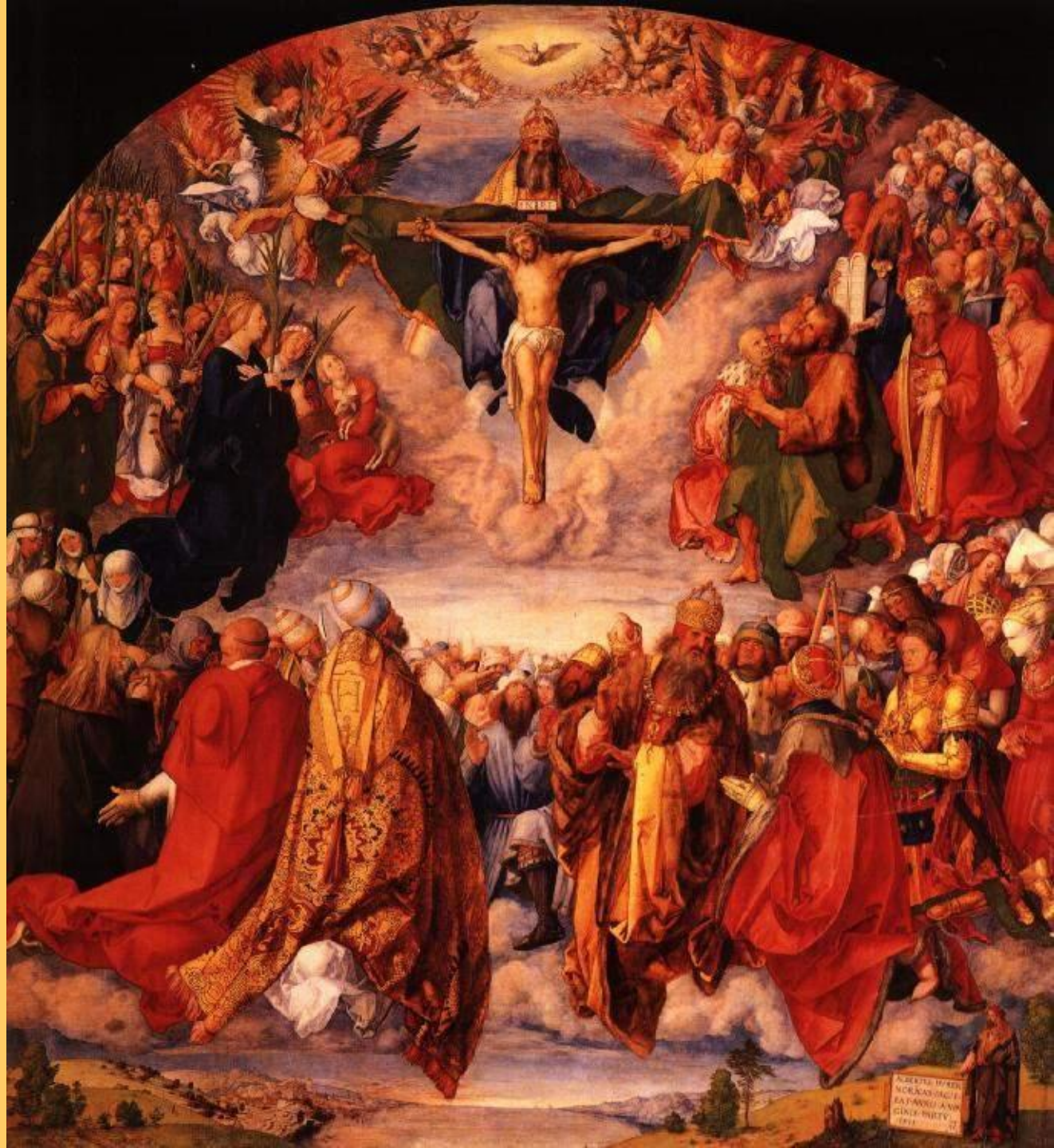
Алтарь всех святых