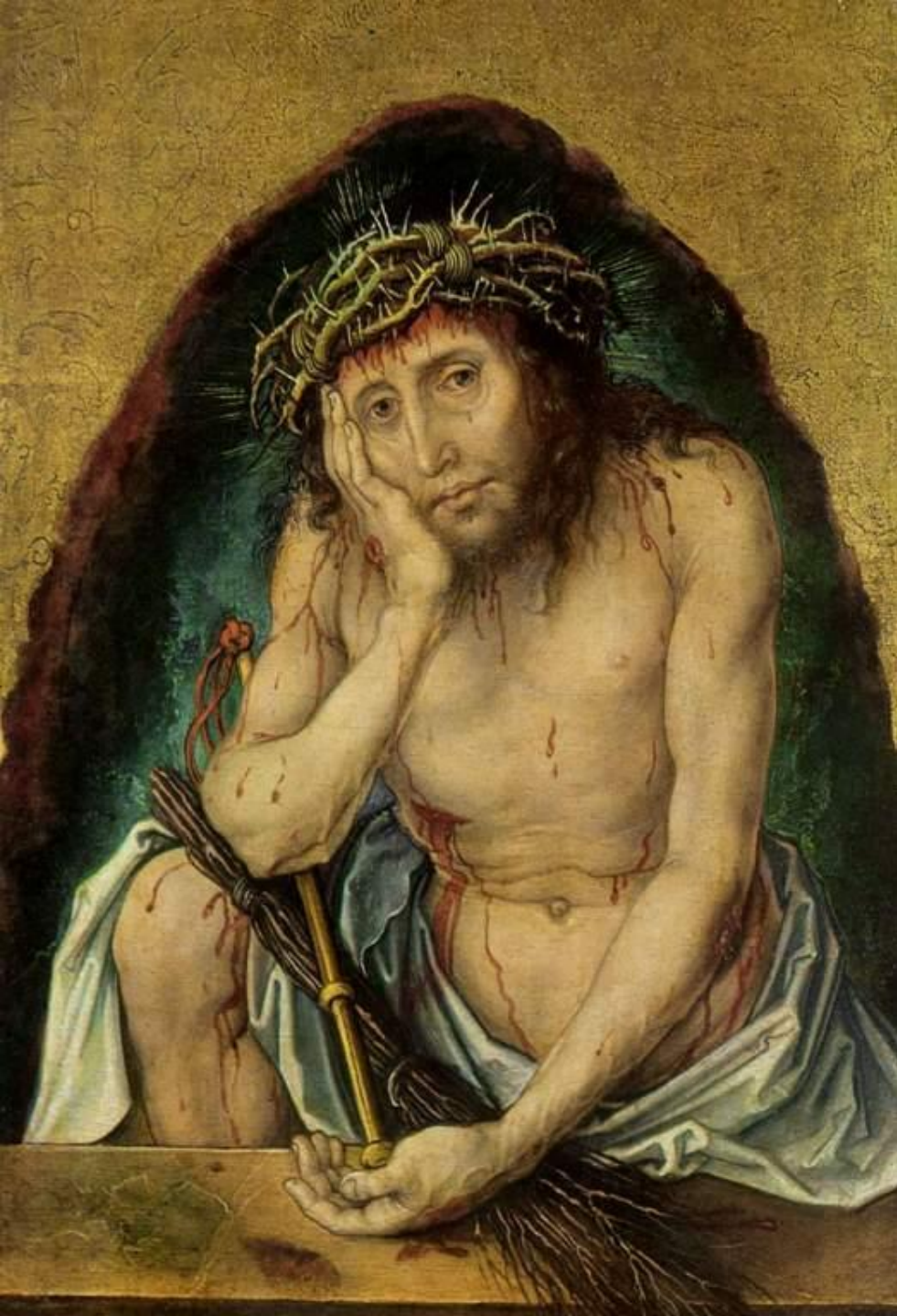
Ессе Ното(Сын человеческий) Около 1495, Кунстхалле, Карлсруэ