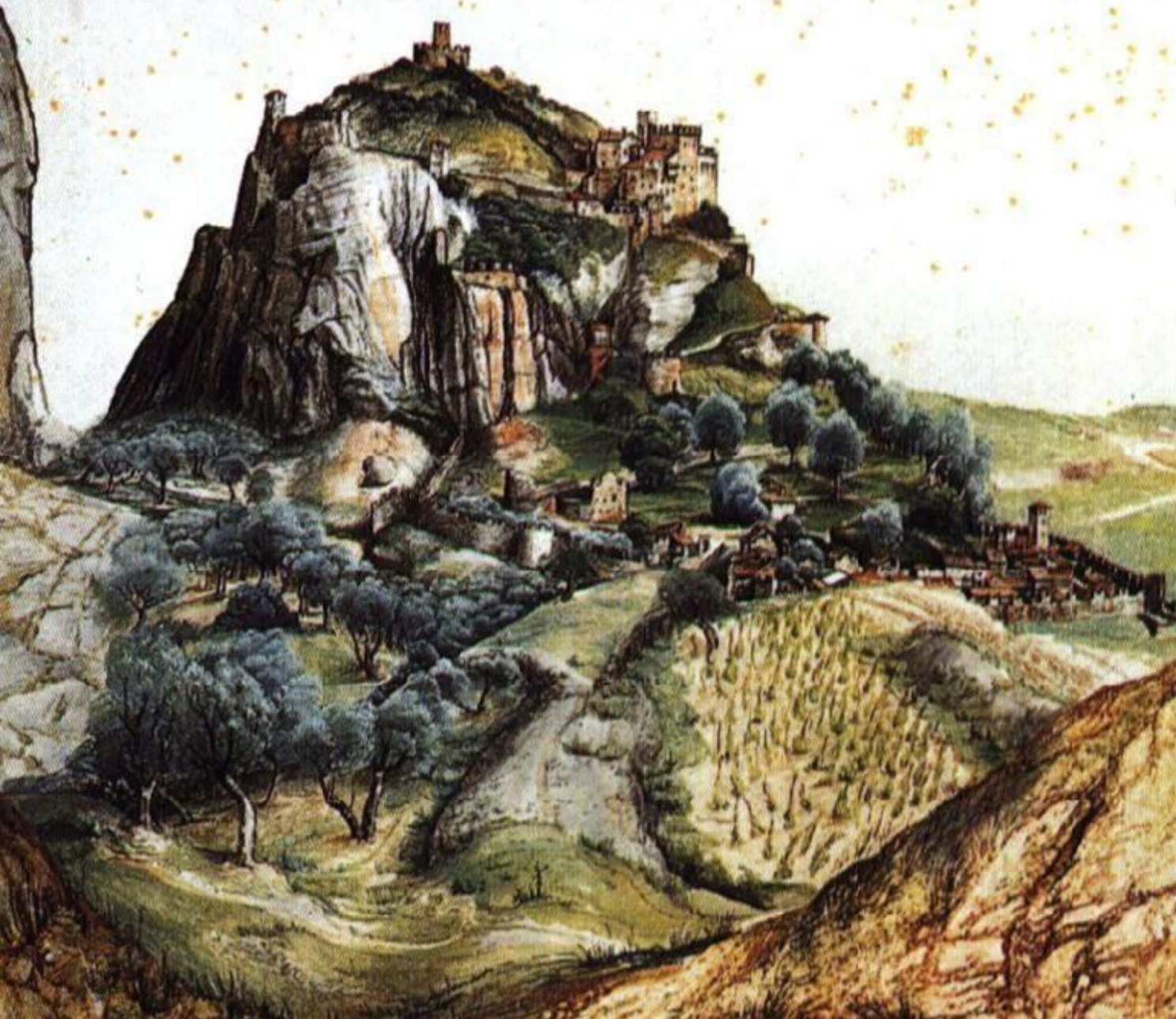
Вид горы Арко, фрагмент (1500-1510)