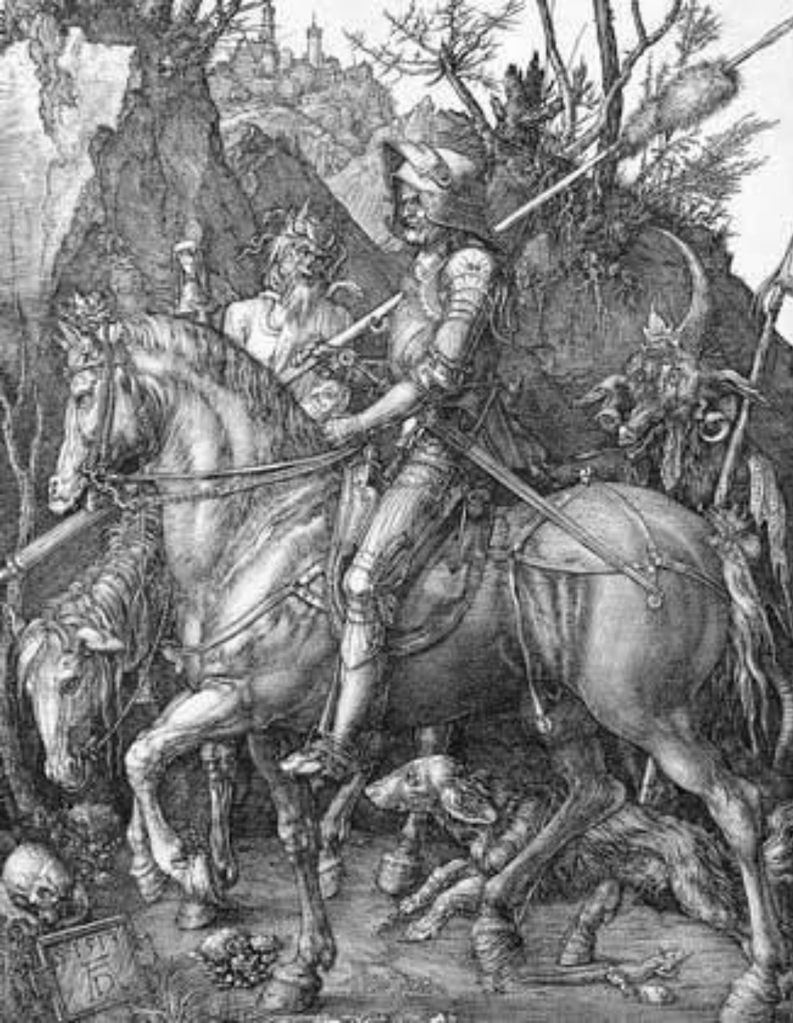
Рыцарь, смерть и дьявол