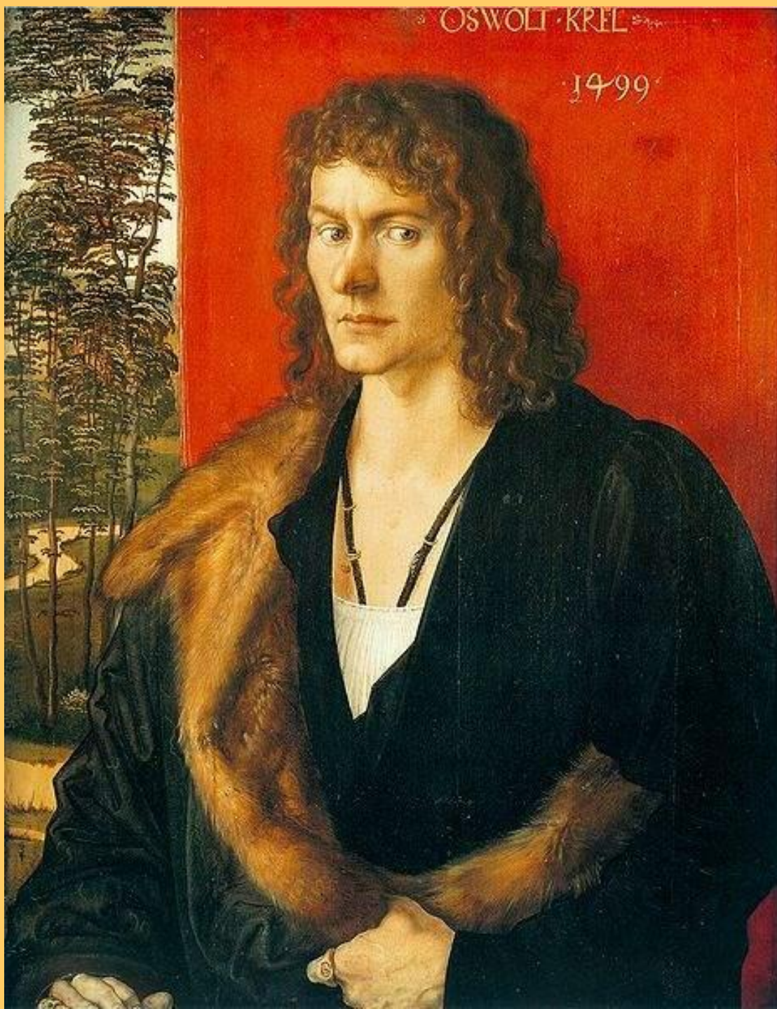
Портрет Освольта Креля. 1499.