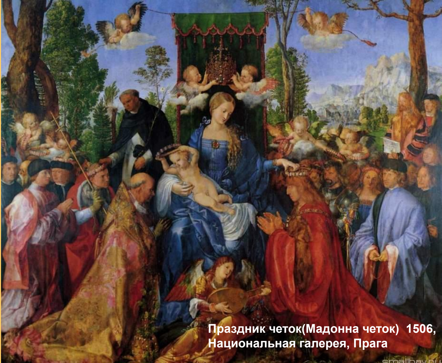
Праздник четок(Мадонна четок) 1506, Национальная галерея, Прага