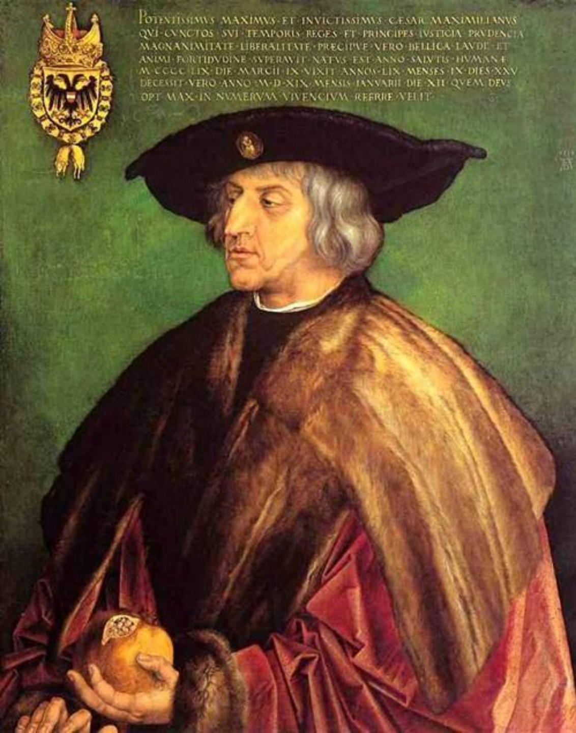
Портрет императора Максимилиана I