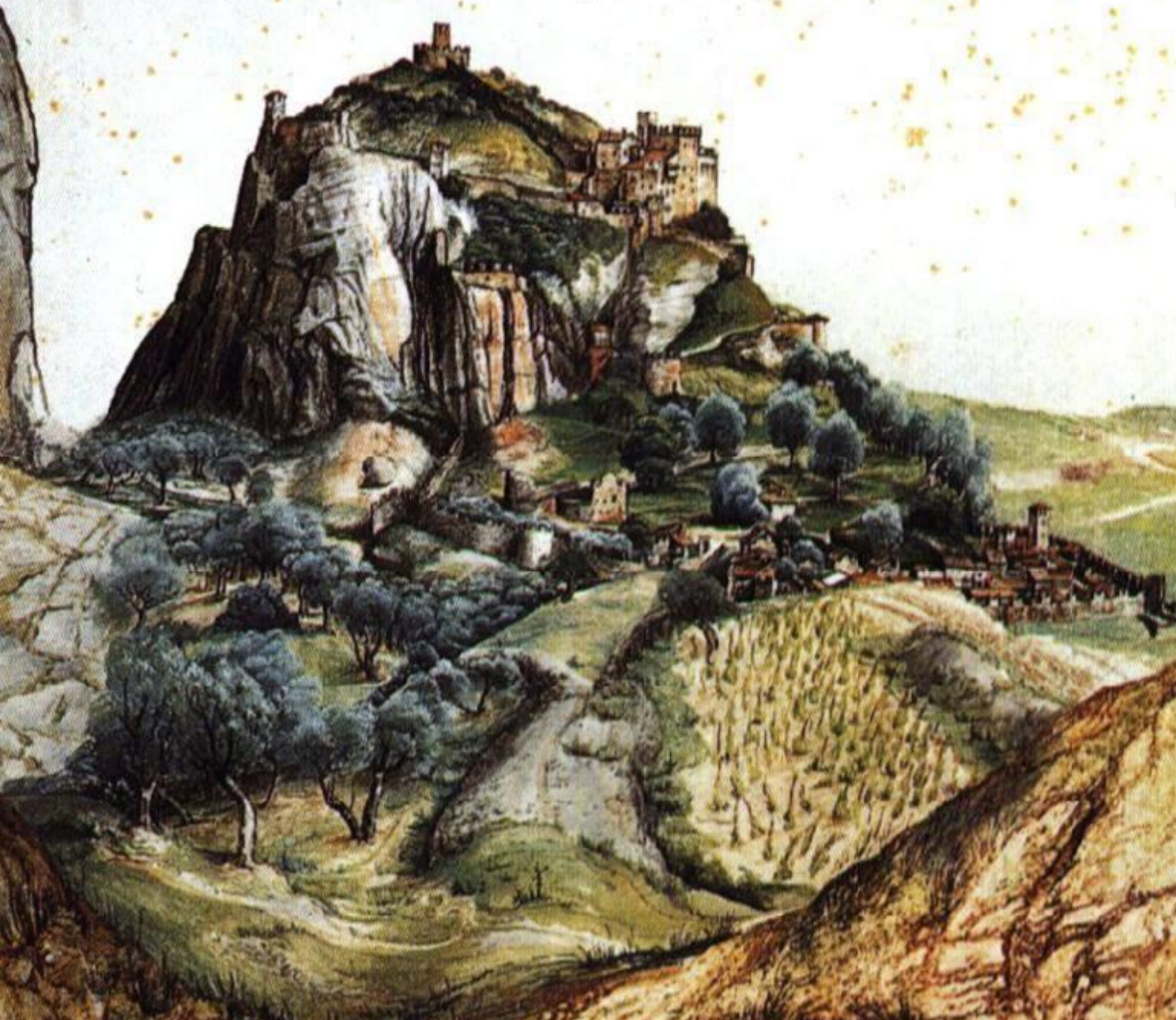
Вид горы Арко, фрагмент (1500-1510)