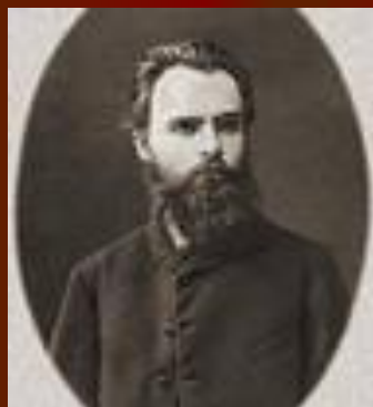
М.А.Балакирев – основатель кружка