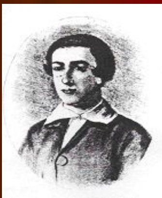
В 14-летнем возрасте