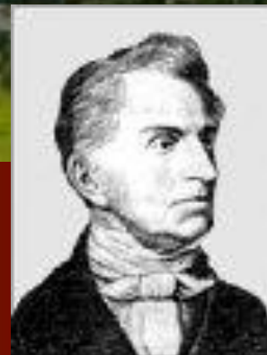
Отец – князь Гедианов