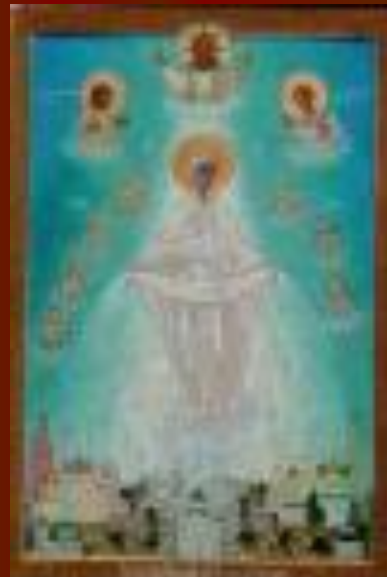
Святой Пророк Исаия "Возрождение Руси" 17 декабря