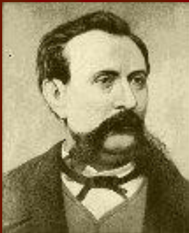
Н.Н.Зинин, русский химик-органик, академик Петербургской АН

«...господин Бородин, поменьше занимайтесь романсами. На Вас я возлагаю все свои надежды, чтобы приготовить заместителя своего, а Вы все думаете о музыке и о двух «зайцах»»