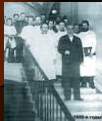
Преподаватели ЖВК – 1872 г.

Как общественный деятель, Бородин прежде всего выдвигается в так называемом "женском вопросе". Более горячего и деятельного поборника женского образования трудно было найти. Для него это было "sancta sanctorum", ради защиты которого он готов был жертвовать всем. В истории развития высшего женского образования в России имя Бородина должно бесспорно занимать одно из первых мест. Недаром же на могилу его был возложен серебряный венок с надписью: "Основателю, охранителю, поборнику женских врачебных курсов, опоре и другу учащихся - от женщин врачей десяти курсов 1872 - 1887".