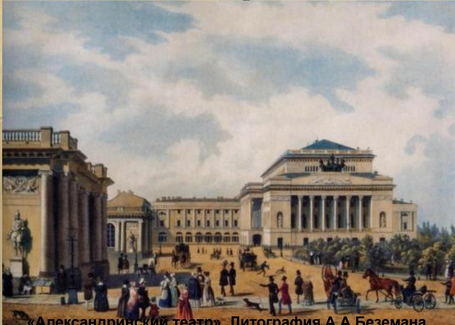
«Александринский театр». Литография А.А.Беземана