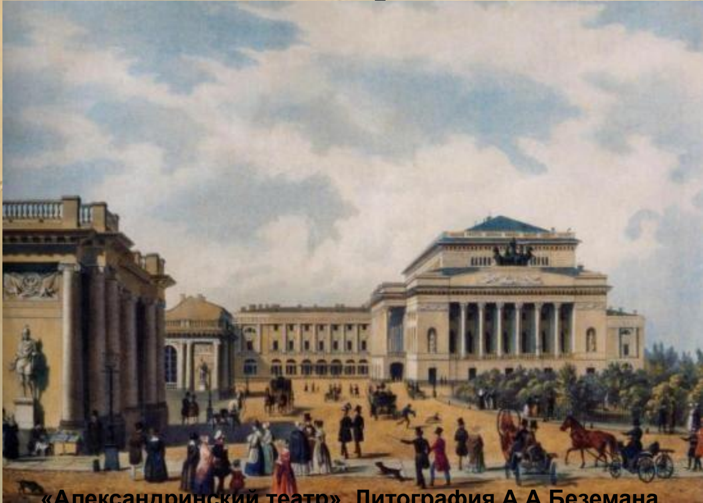
«Александринский театр». Литография А.А.Беземана