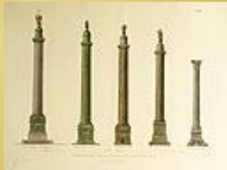
Сравнение Александровской колонны, колонны Траяна, колонны Наполеона, колонны Марка Аврелия, и так называемой "колонны Помпея"