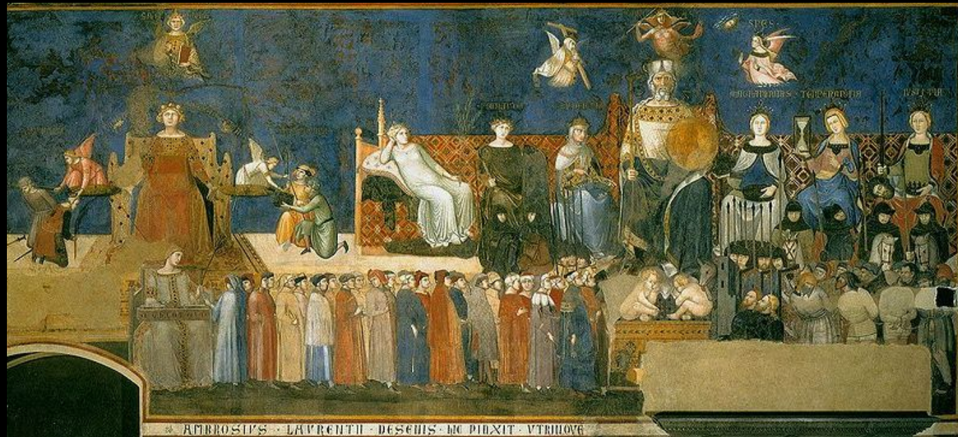
Амброджо Лоренцетти. «Аллегория доброго правления» фреска, деталь. 1337-39гг. Сиена, Палаццо Пубблико.