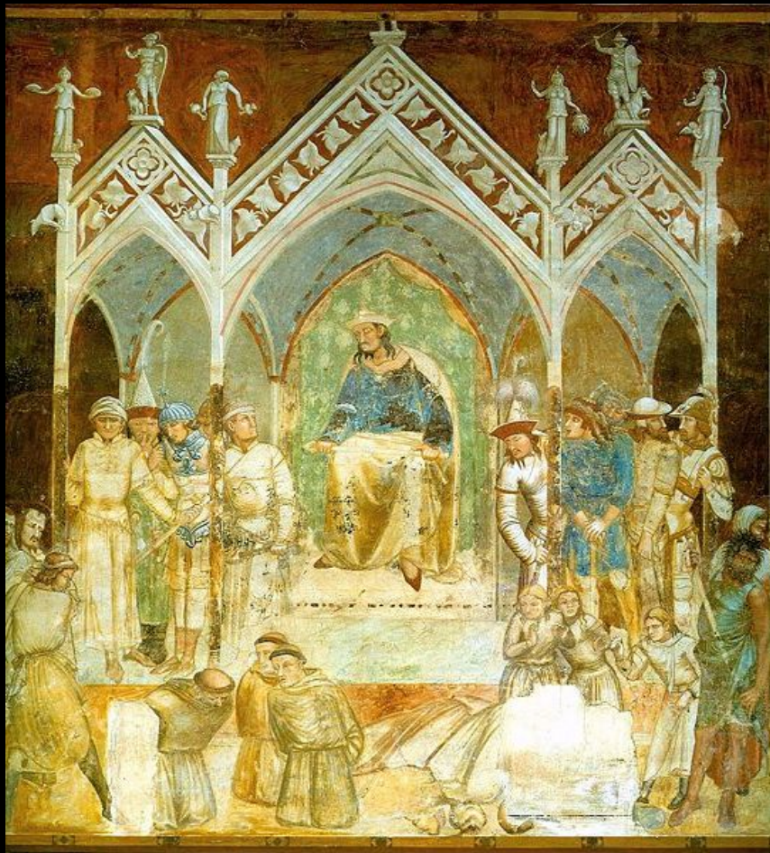
Амброджо Лоренцетти. «Мученичество францисканцев», фреска. 1324-27г. Сиена, ц. Сан Франческо.