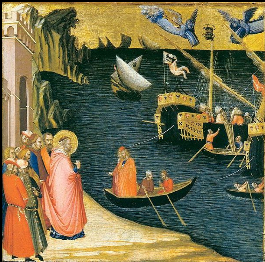
Амброджо Лоренцетти. «Сцены из жизни св. Николая», деталь: Св. Николай, чудом наполняющий трюмы кораблей зерном. 1330е гг. Флоренция, Галерея Уффици.