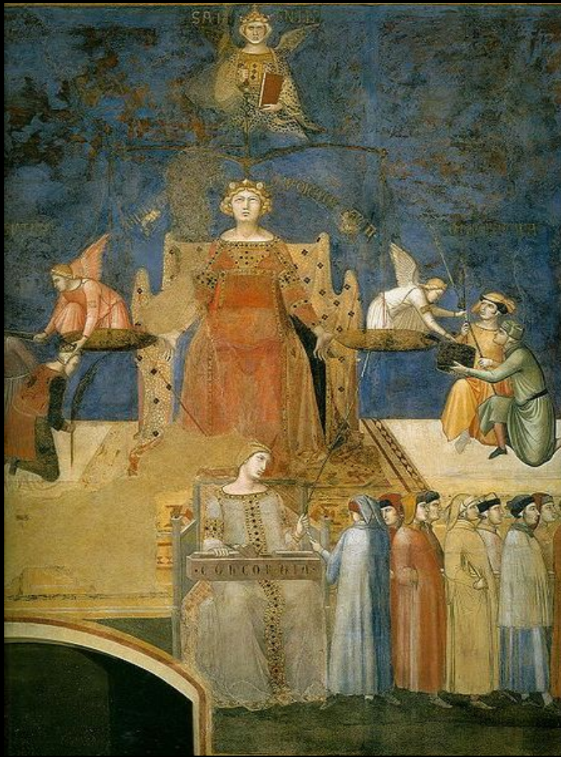
Амброджо Лоренцетти. «Аллегория доброго правления» фреска. деталь: фигура Правосудия. 1337-39.