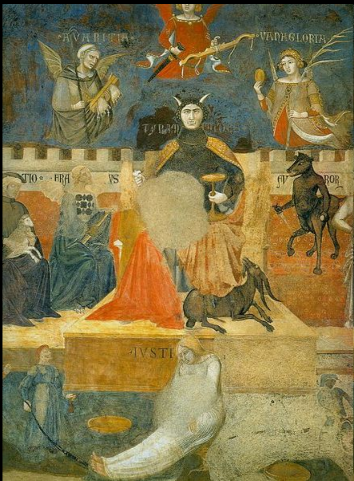
Амброджо Лоренцетти. «Плоды дурного правления» фреска, деталь. 1337-39гг. Сиена, Палаццо Пубблико.