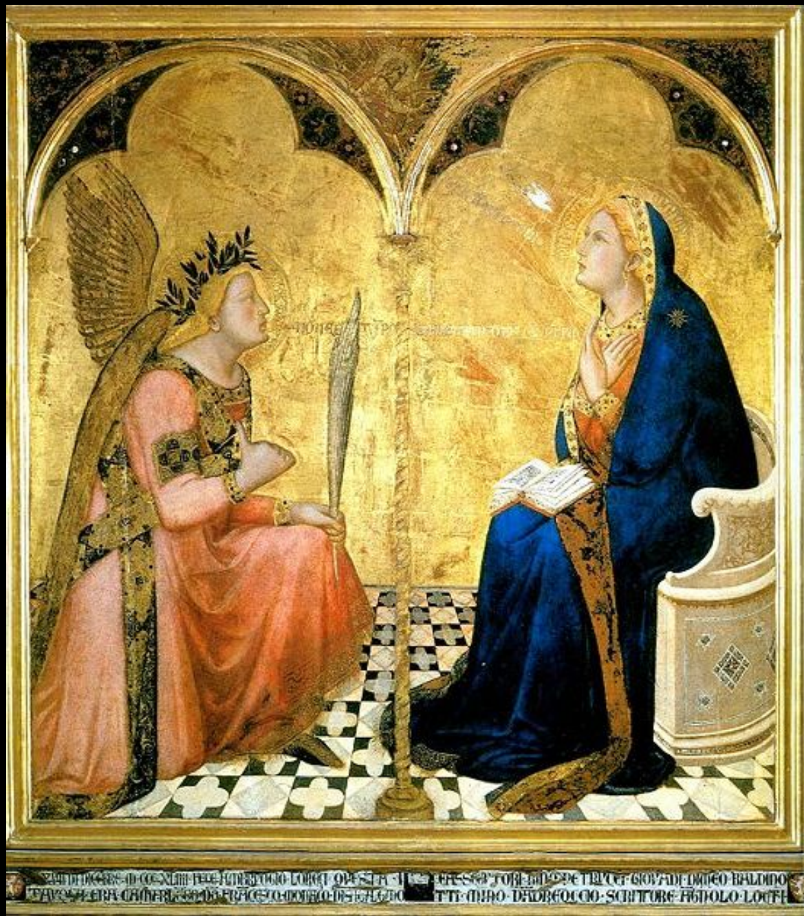
Амброджо Лоренцетти. «Благовещенье» 1344 г. Сиена, Пинакотека.