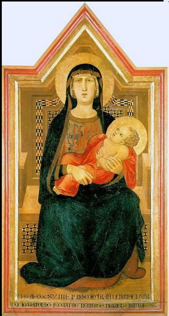
Амброджо Лоренцетти. «Мадонна с младенцем» 1319 г. Сан Кашано Валь ди Пеза, Музей религиозного искусства.