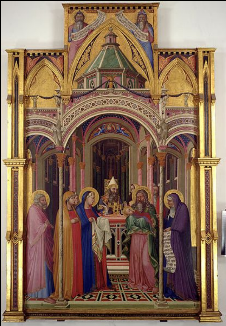
Амброджо Лоренцетти. «Принесение во храм» 1342 г. Флоренция, Галерея Уффици.