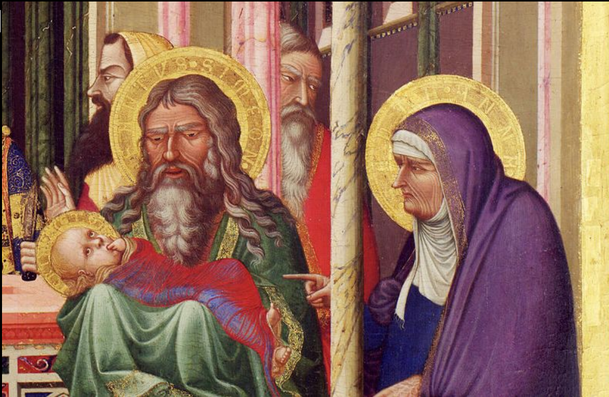
Амброджо Лоренцетти. «Принесение во храм» 1442 г. деталь. Флоренция, Галерея Уффици.