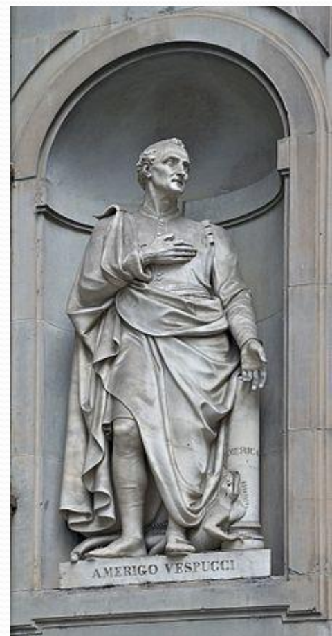
Америго Веспуччи, Флоренция