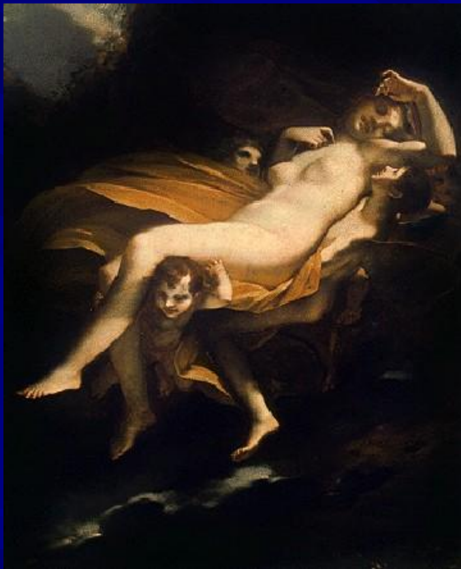
П.-П.Прюдон “Психея, похищаемая зефирами” 1808 г.