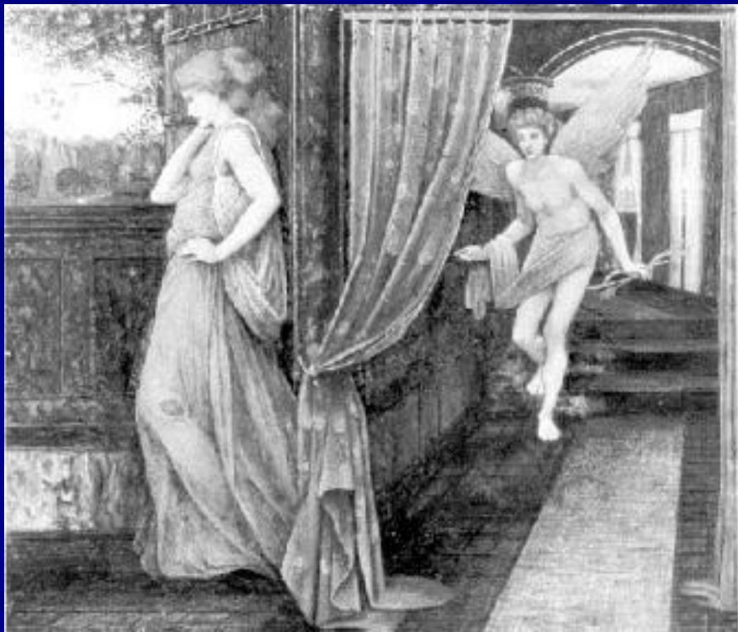
Амур и Психея (гравюра)