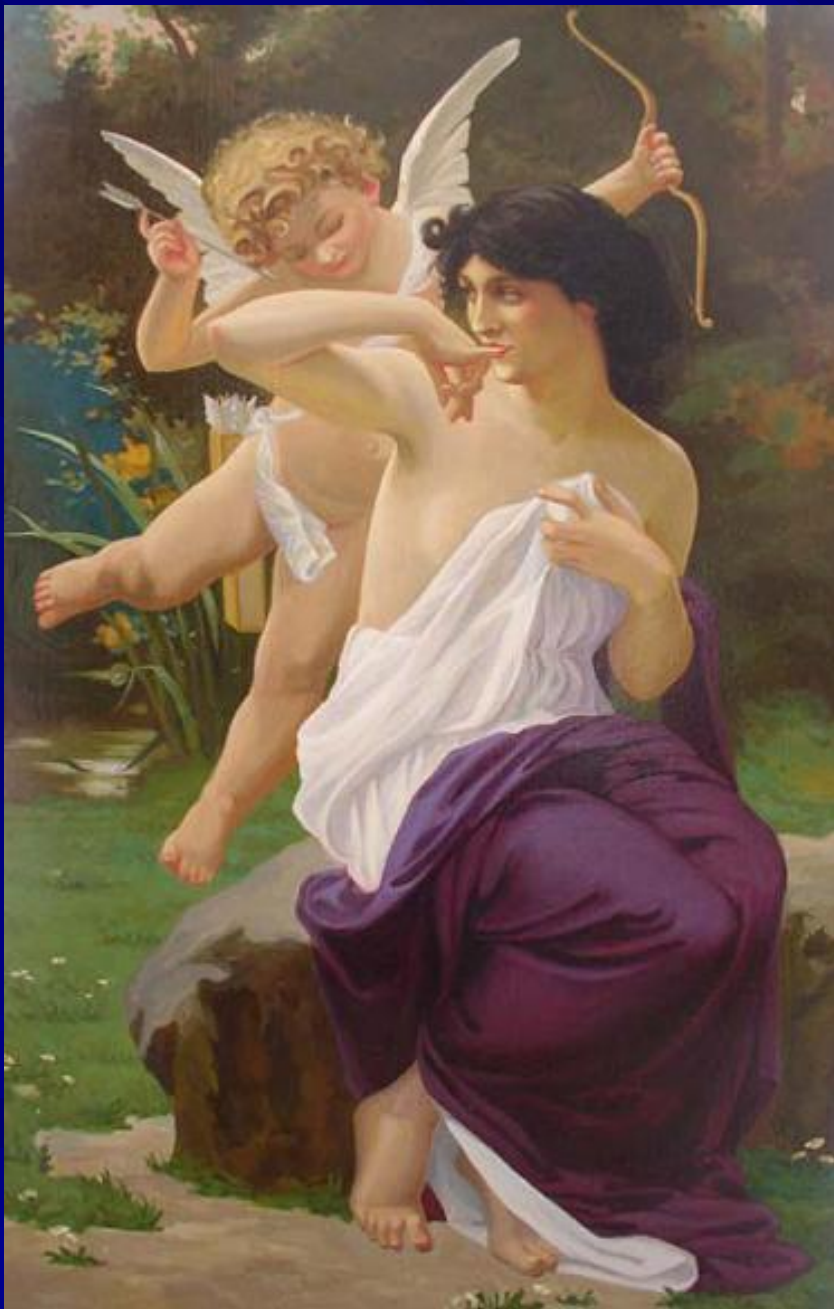
Р.Хайров “Амур и Психея”