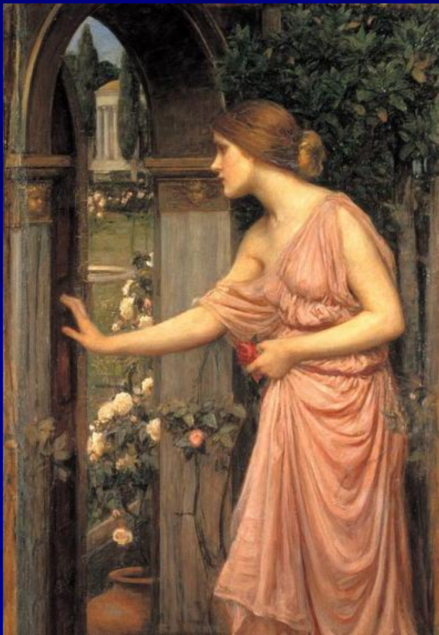
Джон Уильям Уотерхауз “Психея, вступающая в сад Амура” 1905 г.