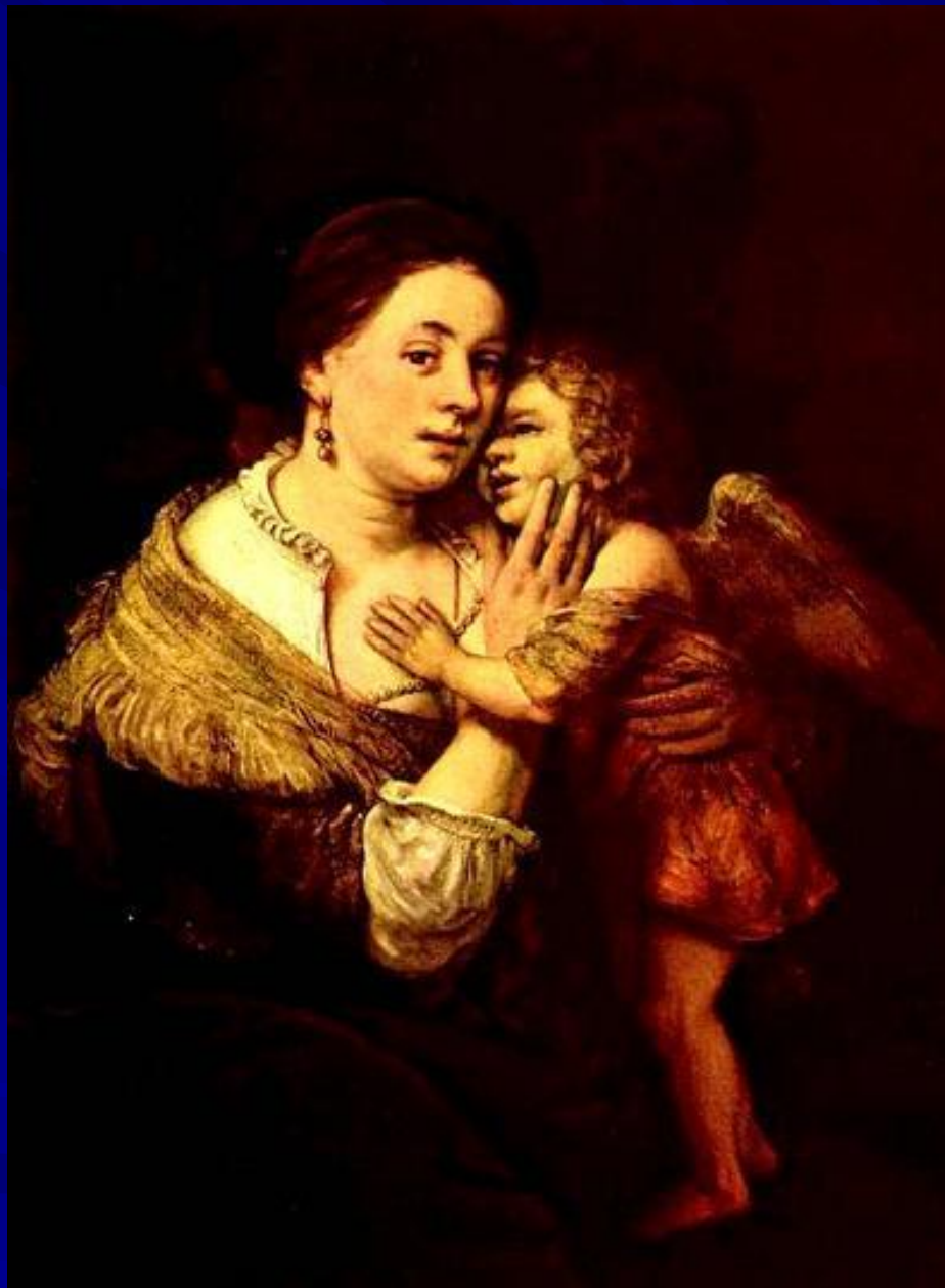
Рембрандт “Венера и Амур” 1642 г.