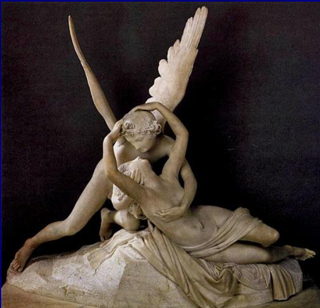
Антонио Канова «Амур и Психея» (Лувр)