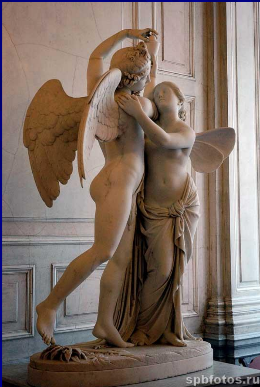
"Амур и Психея" (Эрмитаж)