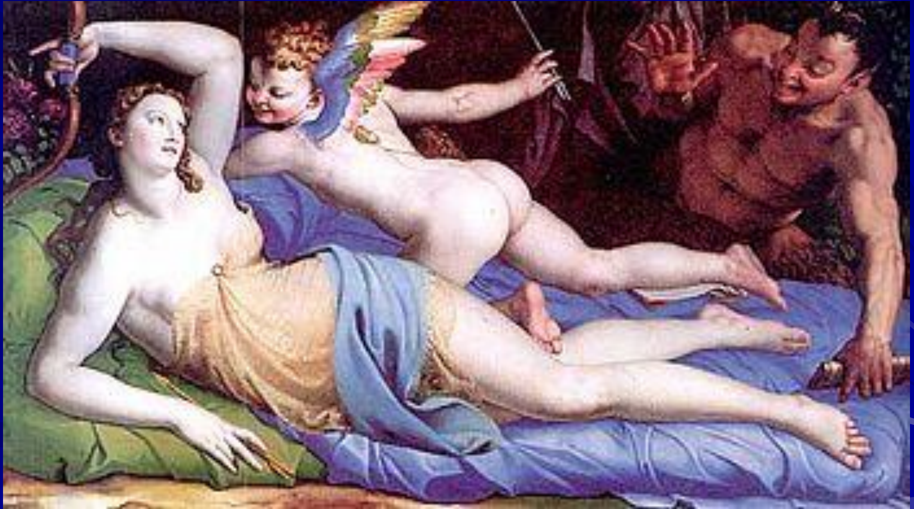
А. Бронзино “Венера, Купидон и сатир”. Рим, Палаццо Колонна

Богиня любви Венера и ее сын Амур — пожалуй, самые частые мифологические персонажи в европейской живописи. Они предстают перед зрителем в самых разных обликах, но символизируют, как правило, одно — чувственную любовь, ее наслаждения и муки, цветы и тернии.