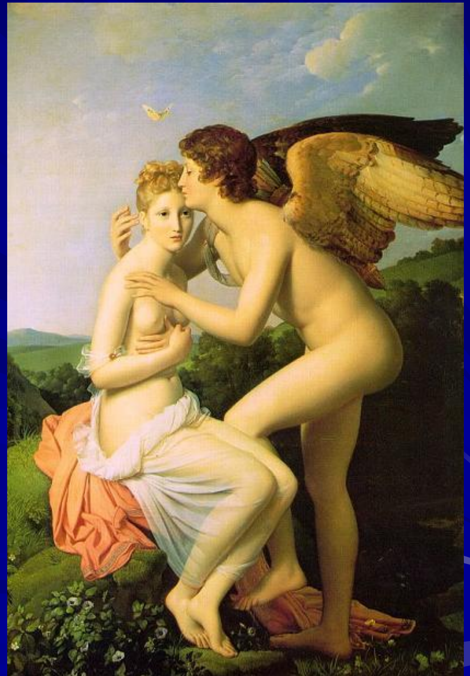
Ф.Жерар “Амур и Психея”