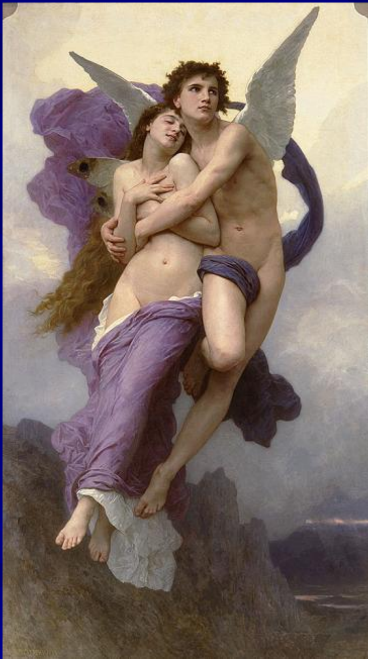
Адольф Уильям Бугро “Похищение Психеи”