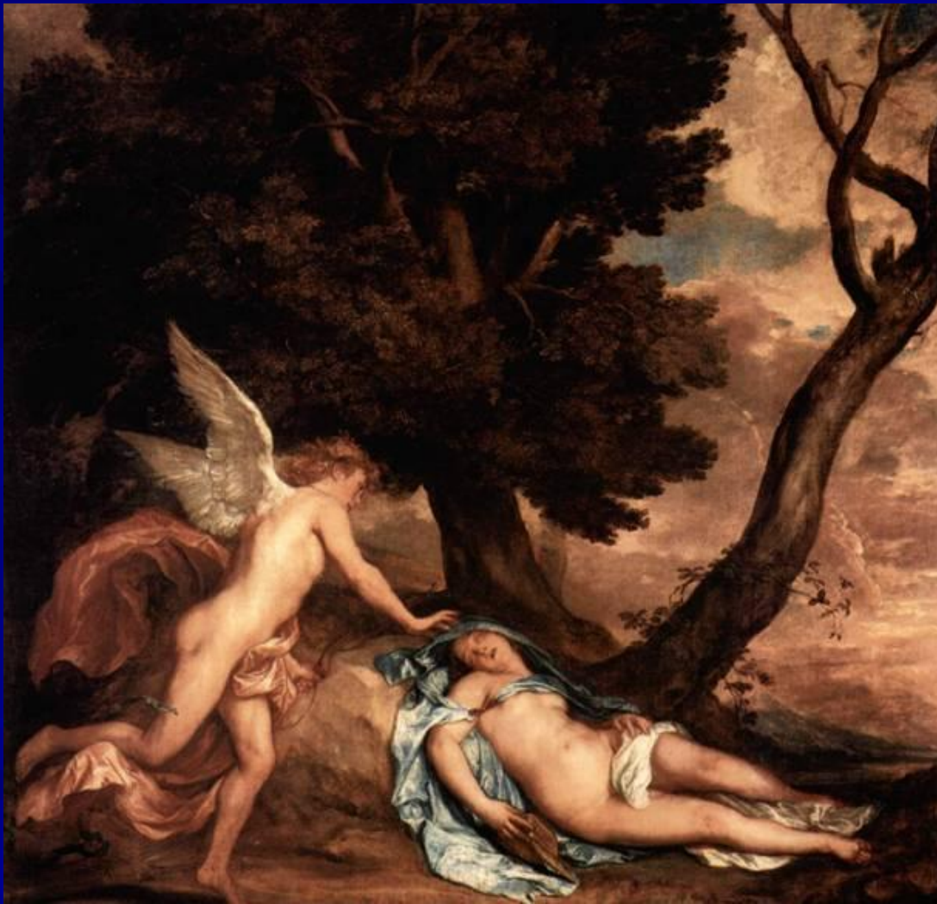
Антонис ван Дейк “Амур и Психея” 1638 г.