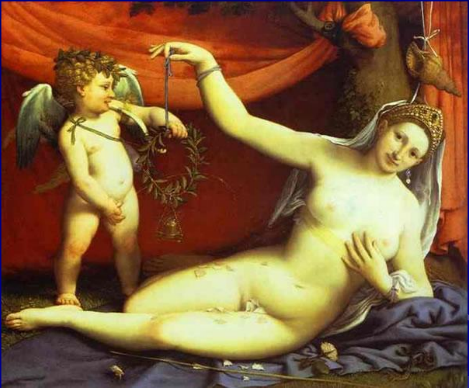
Лотто “Венера и Купидон”