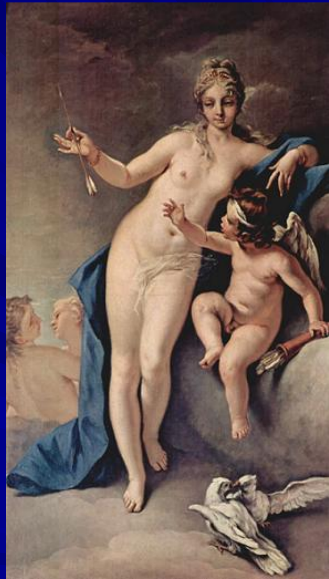
Себастьяно Ричи “Венера и Амур” 1713 г.