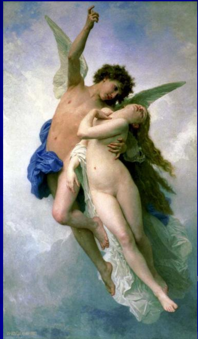
Адольф Уильям Бугро “Амур и Психея”