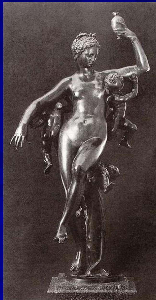
Неизвестный автор “Психея, возносимая зефирами” 1593 г.