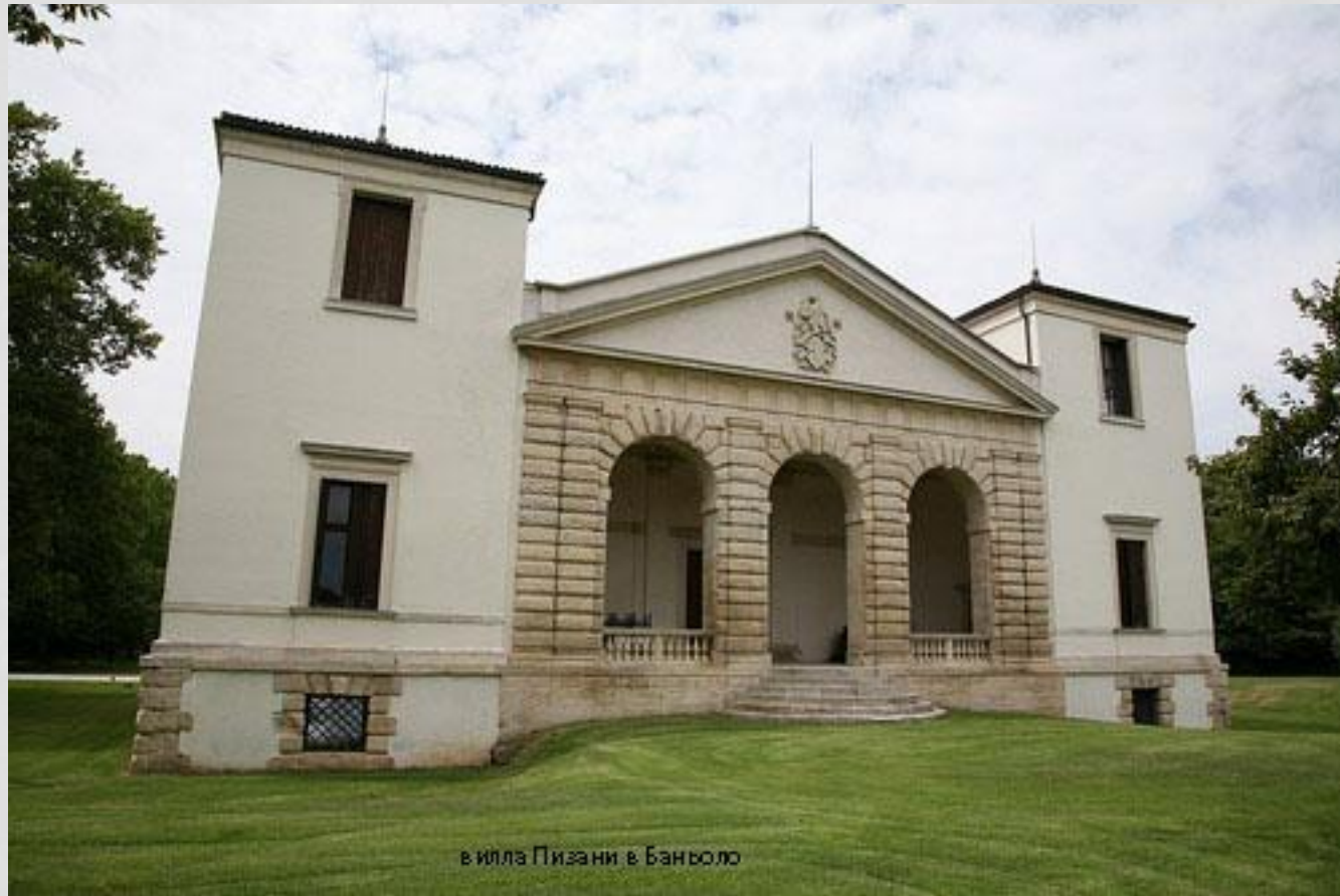
в илла Пизани в Баньоло