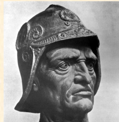
Верроккьо. Конная статуя кондотьера Коллеони в Венеции