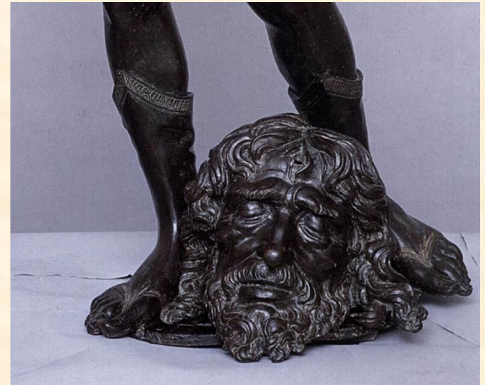
Бронзовая статуя Давида в Палаццо Веккьо