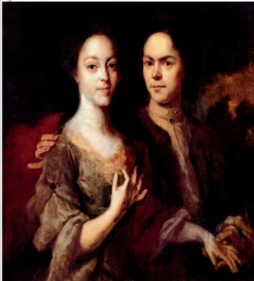
Портрет с женой.

Небывалым расцветом новых ремесел и искусств начавшимся в XVIII веке русская культура обязана в первую очередь Петру посылавшему талантливую молодежь учиться в Европу. Один из первых кого царь послал обучаться за границу мастерству живописца стал Андрей Матвеев. По существующей легенде юный Андрей повстречал царя в Софийском соборе Новгорода и тот предложил ему ехать учиться. Будущему живописцу было тогда что-то около пятнадцати лет, был ли он тогда учеником иконописца или с какой-то другой стороны имел отношение к живописи неизвестно. Так же неизвестно его настоящее отчество: Матвеевич или Меркурьевич, то же самое касается и фамилии, иногда Андрей Матвеев упоминается как Кобылин. По другим сведениям отец Андрея Матвеева был подъячим, служившим в при дворе в Петербурге и учиться Андрея послала Екатерина I. В любом случае то что Андрей Матвеев учился живописному мастерству в Голландии и Фландрии и был личным стипендиатом Екатерины I является