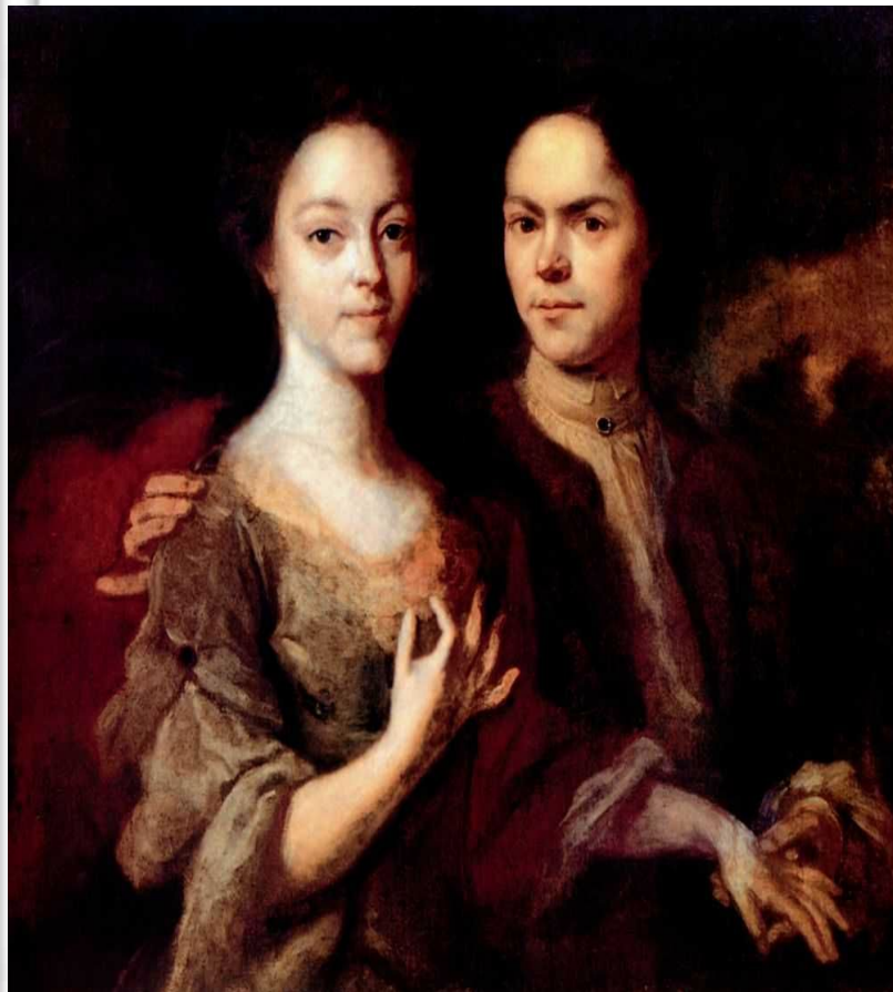
Портрет с женой.

Небывалым расцветом новых ремесел и искусств начавшимся в XVIII веке русская культура обязана в первую очередь Петру посылавшему талантливую молодежь учиться в Европу. Один из первых кого царь послал обучаться за границу мастерству живописца стал Андрей Матвеев. По существующей легенде юный Андрей повстречал царя в Софийском соборе Новгорода и тот предложил ему ехать учиться. Будущему живописцу было тогда что-то около пятнадцати лет, был ли он тогда учеником иконописца или с какой-то другой стороны имел отношение к живописи неизвестно. Так же неизвестно его настоящее отчество: Матвеевич или Меркурьевич, то же самое касается и фамилии, иногда Андрей Матвеев упоминается как Кобылин. По другим сведениям отец Андрея Матвеева был подъячим, служившим в при дворе в Петербурге и учиться Андрея послала Екатерина I. В любом случае то что Андрей Матвеев учился живописному мастерству в Голландии и Фландрии и был личным стипендиатом Екатерины I является