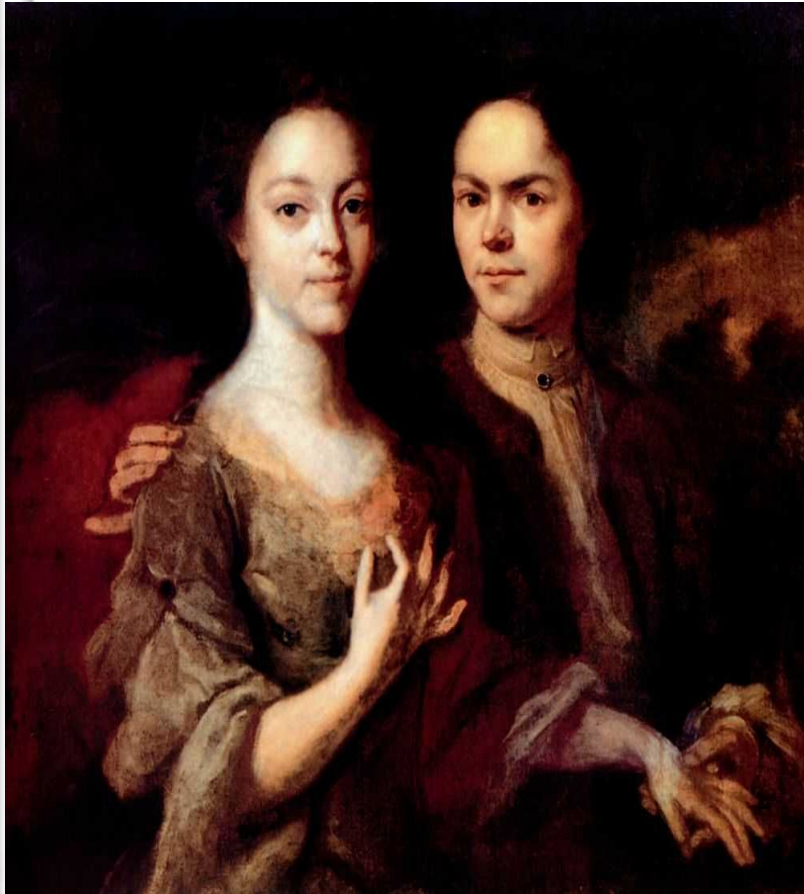
Портрет с женой.

Небывалым расцветом новых ремесел и искусств начавшимся в XVIII веке русская культура обязана в первую очередь Петру посылавшему талантливую молодежь учиться в Европу. Один из первых кого царь послал обучаться за границу мастерству живописца стал Андрей Матвеев. По существующей легенде юный Андрей повстречал царя в Софийском соборе Новгорода и тот предложил ему ехать учиться. Будущему живописцу было тогда что-то около пятнадцати лет, был ли он тогда учеником иконописца или с какой-то другой стороны имел отношение к живописи неизвестно. Так же неизвестно его настоящее отчество: Матвеевич или Меркурьевич, то же самое касается и фамилии, иногда Андрей Матвеев упоминается как Кобылин. По другим сведениям отец Андрея Матвеева был подъячим, служившим в при дворе в Петербурге и учиться Андрея послала Екатерина I. В любом случае то что Андрей Матвеев учился живописному мастерству в Голландии и Фландрии и был личным стипендиатом Екатерины I является