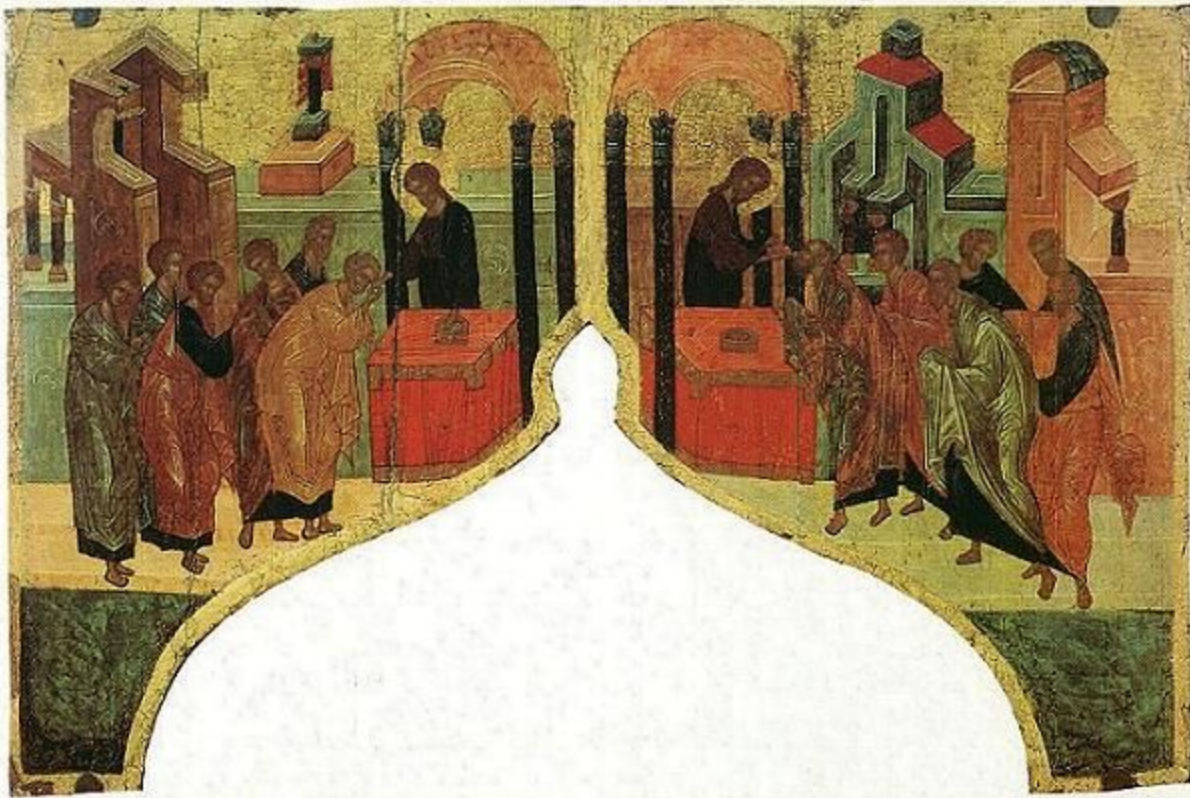
Евхаристия Сень надвратная из иконостаса Благовещенской церкви села Благовещения близ Сергиева Посада. 1422-1427(?)