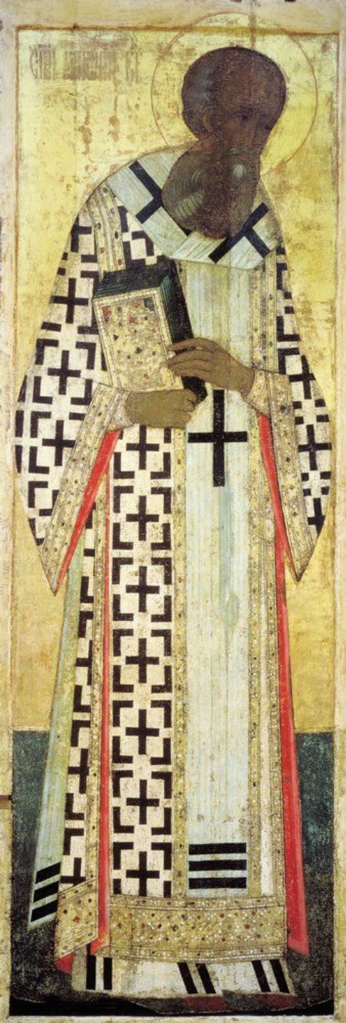
Григорий Богослов, 1408 Цикл икон деисусного чина иконостаса Успенского собора во Владимире.