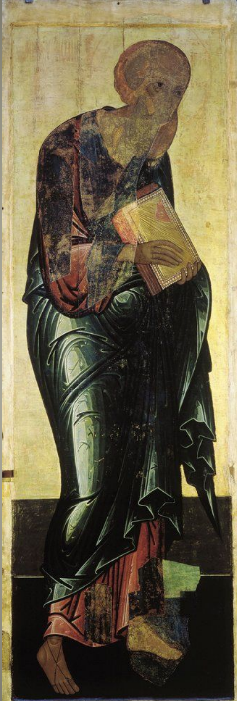
Иоанн Богослов, 1408 Цикл икон деисусного чина иконостаса Успенского собора во Владимире