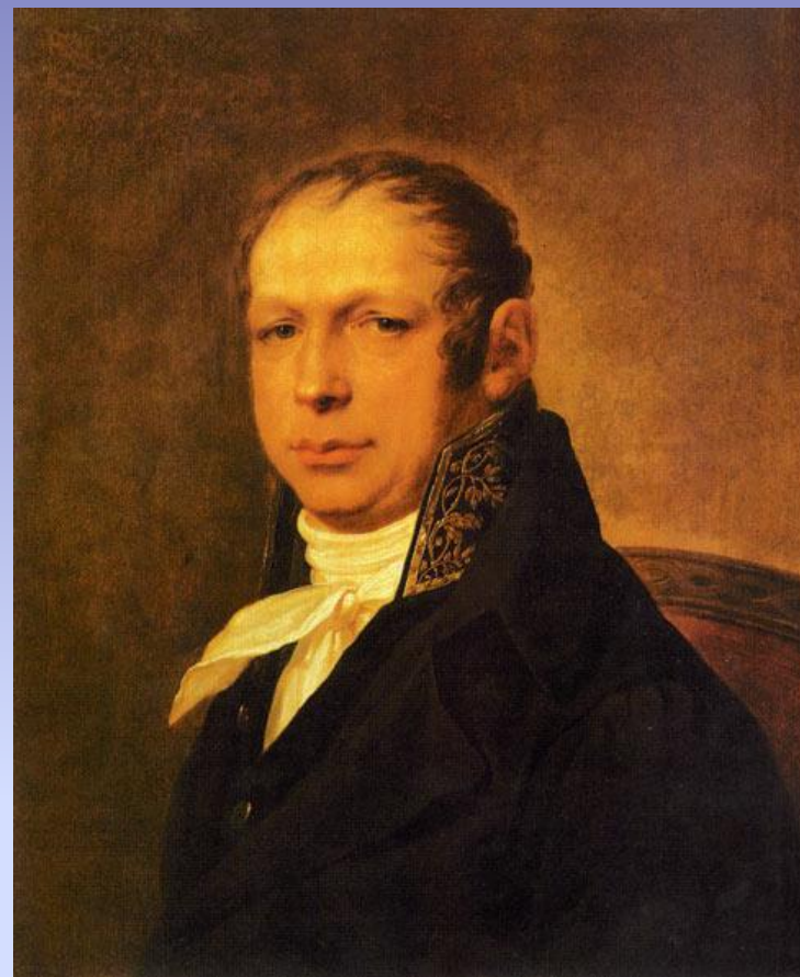
Портрет работы С. С. Щукина. Около 1804 года.

Андреян Дмитриевич Захаров - русский архитектор, представитель стиля ампир. Создатель комплекса зданий Адмиралтейства в Санкт-Петербурге.