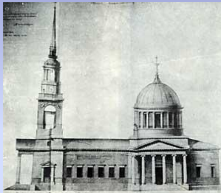
Проект Андреевского собора архитектора А.Д.Захарова. 1806 г.