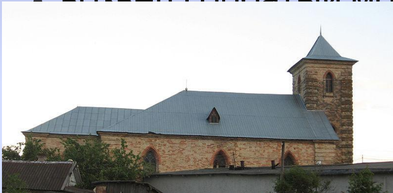
Лютеранская церковь Святого Петра (1799 – 1800 гг.)