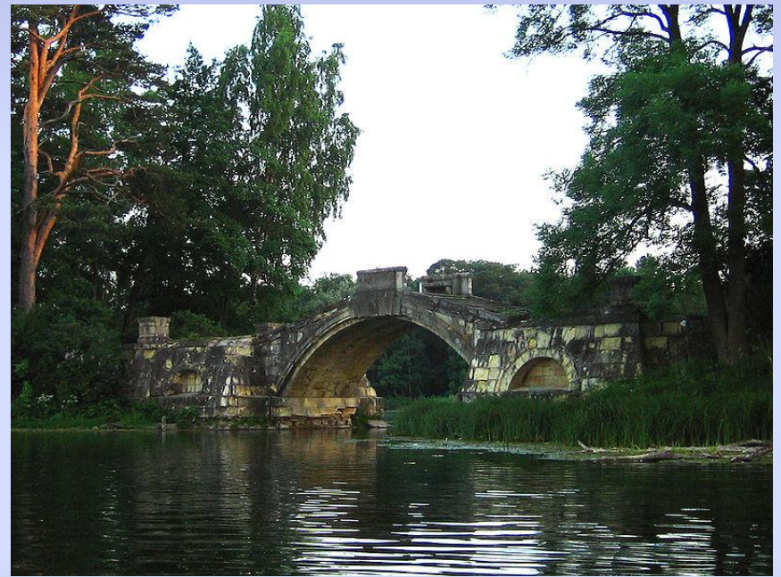
Горбатый мост. 1800.