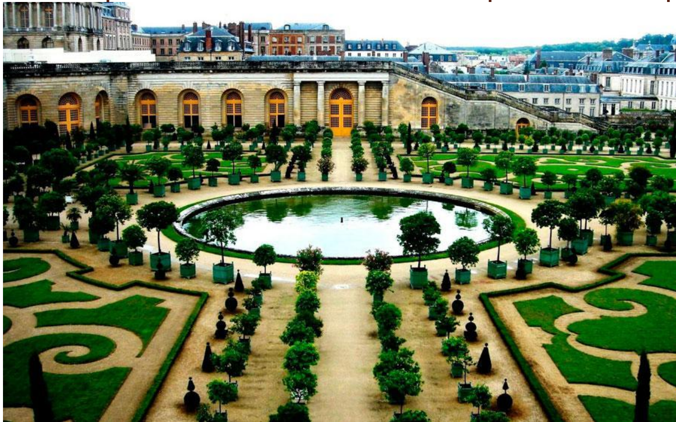
( Версальський парк, Франція )

Регулярний стиль планування — це один з головних напрямів у садово-парковому мистецтві, ознаки цього стилю з'явилися ще в давнину (Вавилон, Єгипет, Давня Греція та Рим), а пізніше поширилися в XVI — XVIII ст. в європейських країнах.