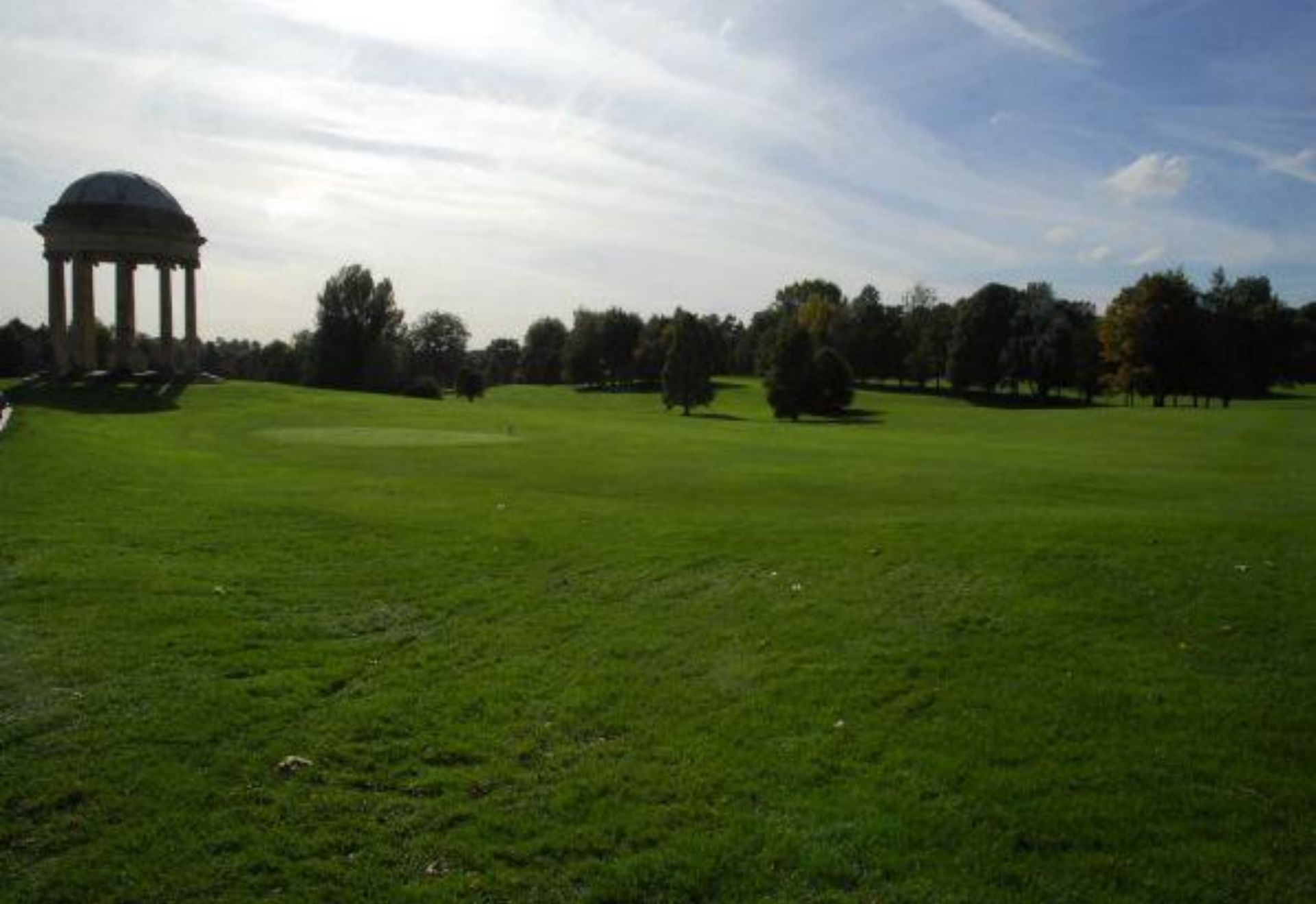
Стоу. Західний сад з Ротондою Венери.