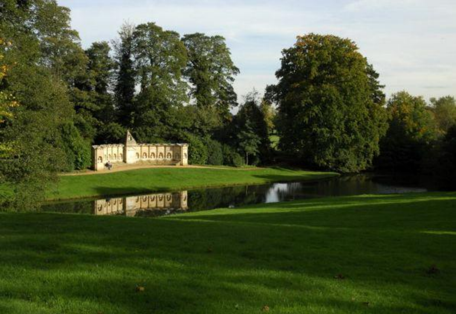
Стоу. Єлисейські поля. Пам'ятник Доблесним британцям.