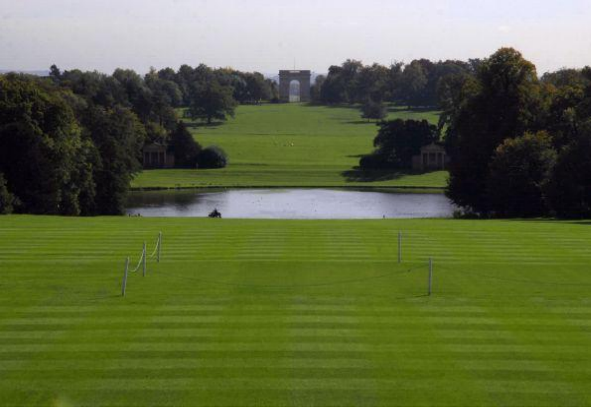
Стоу. Вигляд від палацу на партер, восьмигранне озеро і Триумфальну арку