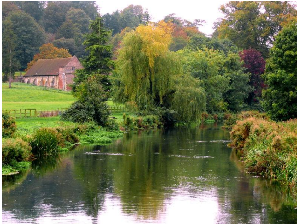
(Парк Уілтон-Хаус, Англія)

Англія увійшла в історію ландшафтного дизайну своїми численними садами і парками, прославленими на весь світ. Основним напрямком і стилем, якого дотримувалися англійські садівники в усі часи, був пейзажний, що прийшов на зміну регулярному французькому стилю садового мистецтва в кінці XVIII століття.