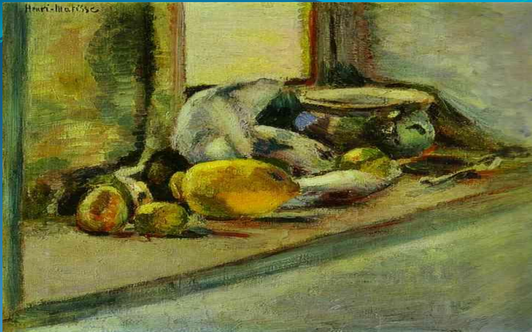
Голубой горшок и лимон-1897