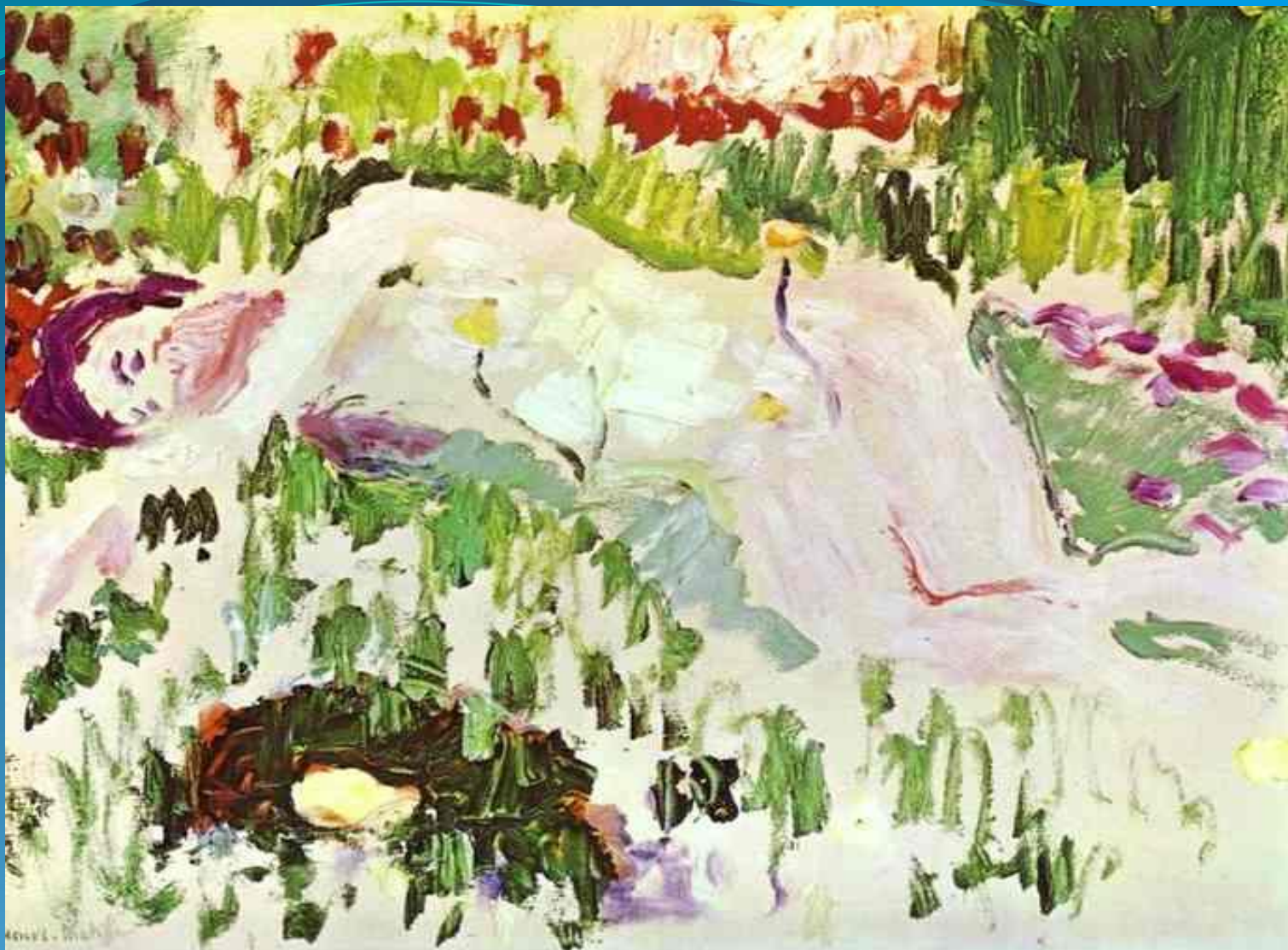
Лежащая обнажённая - 1906