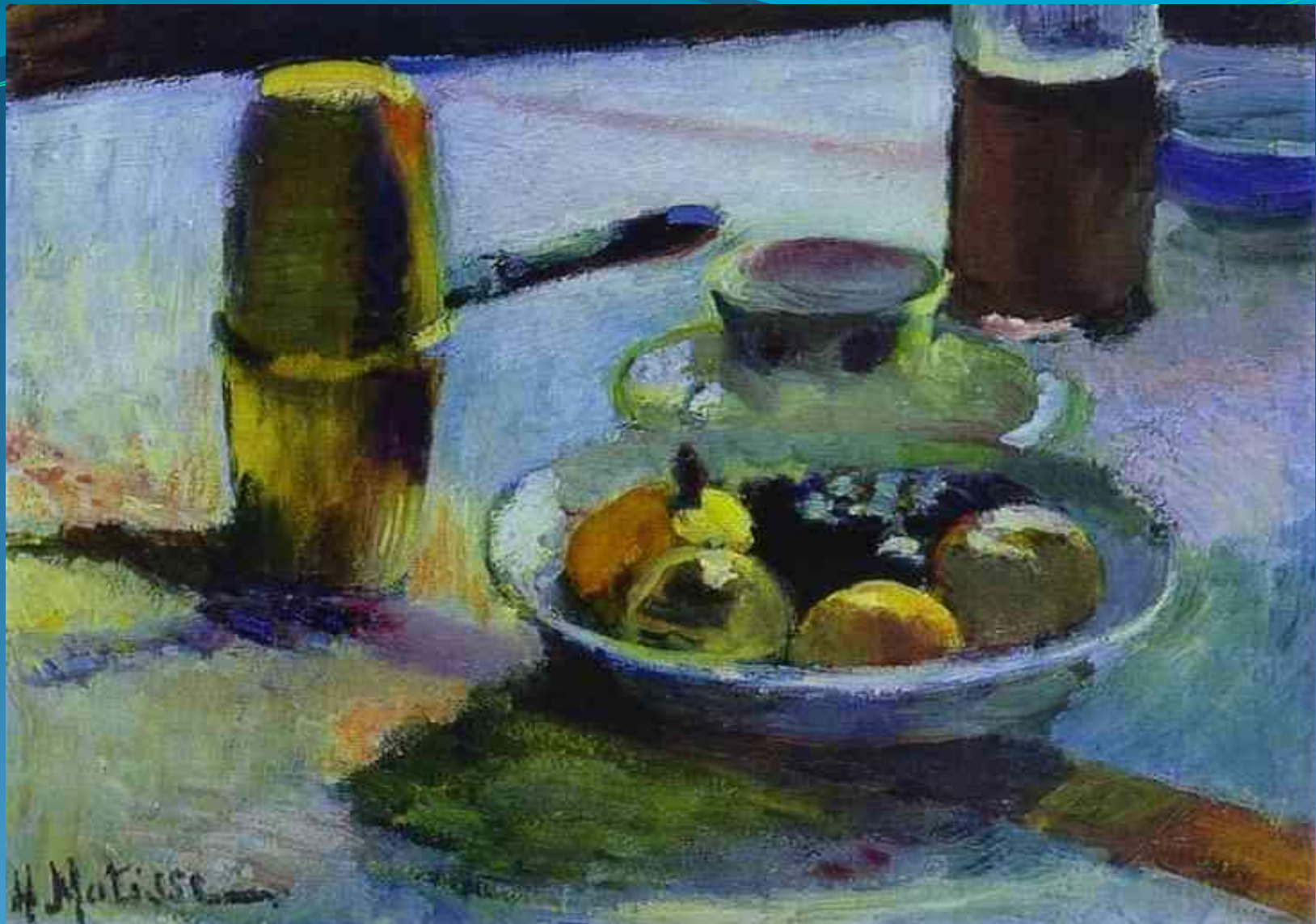
Фрукты и кофейник - 1899