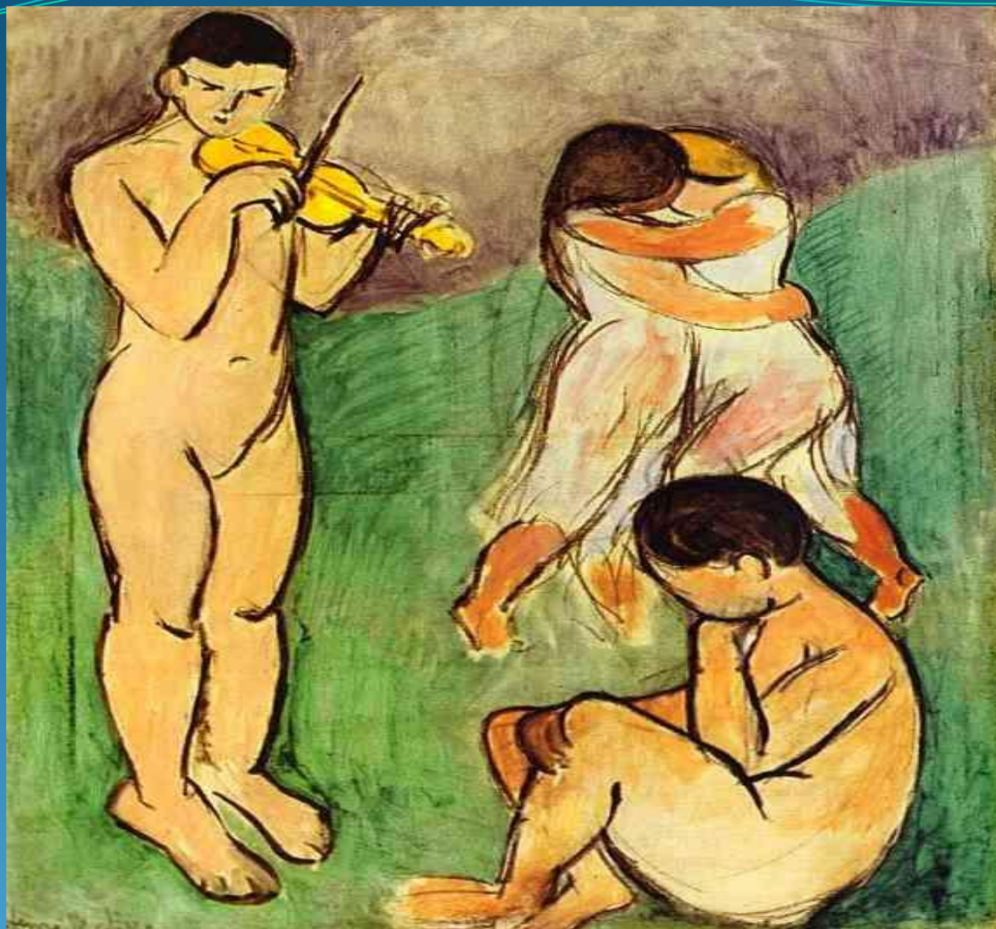
Музыка (эскиз) - 1907