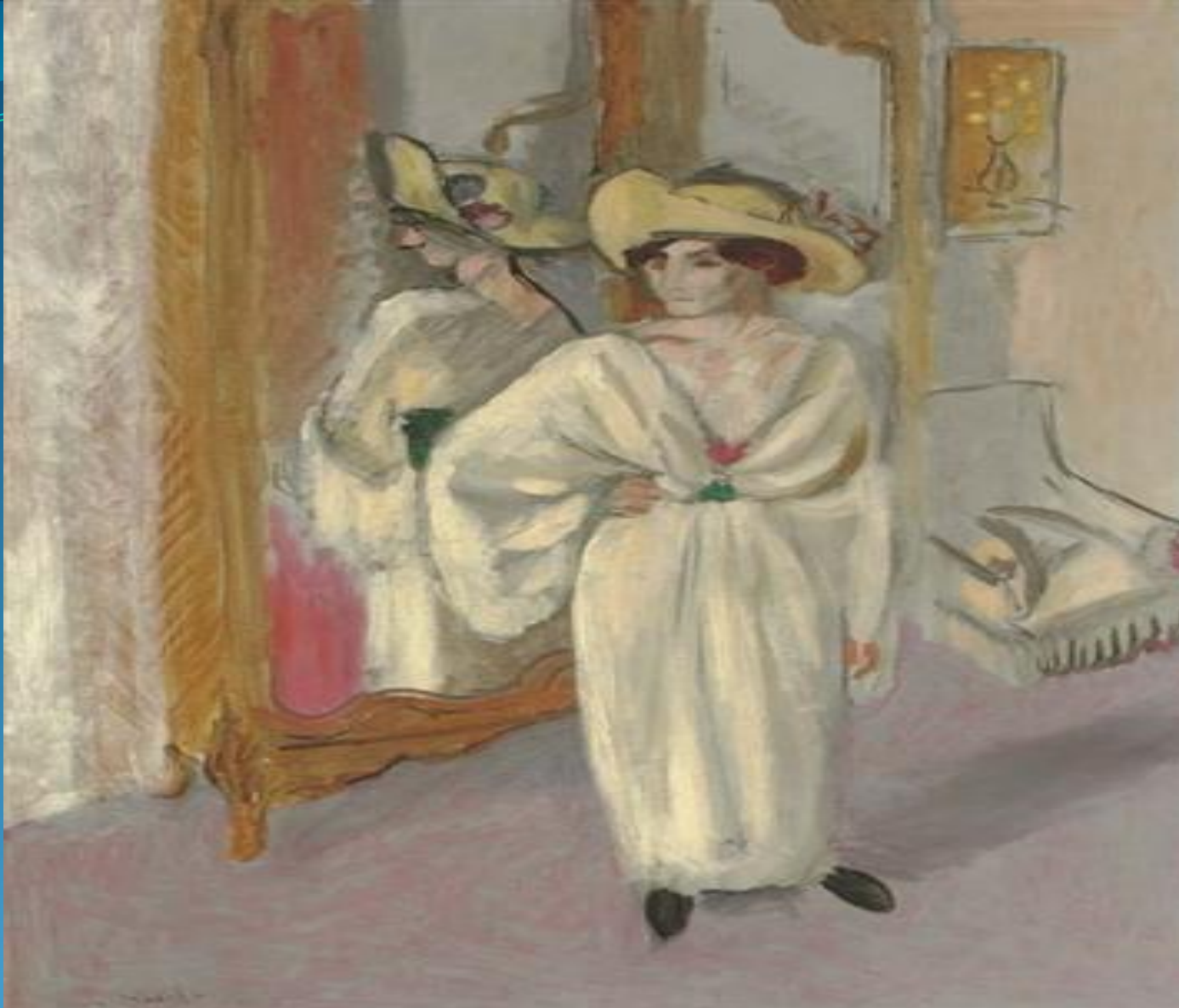
Женщина в белом, стоящая у зеркала – 1918-1919.