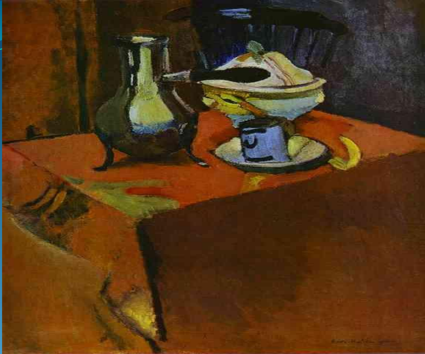
Посуда на столе - 1900