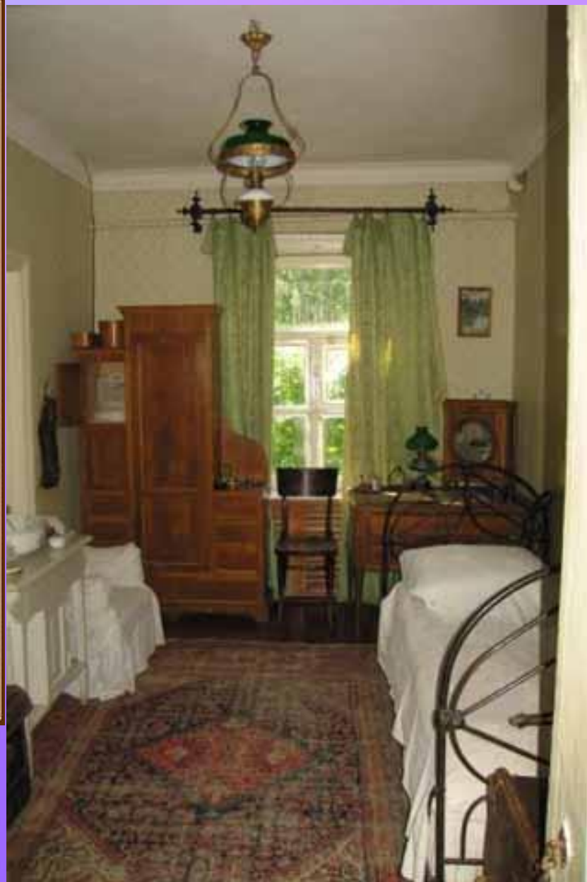
МУЗЕЙ ЧЕХОВА В МЕЛИХОВЕ