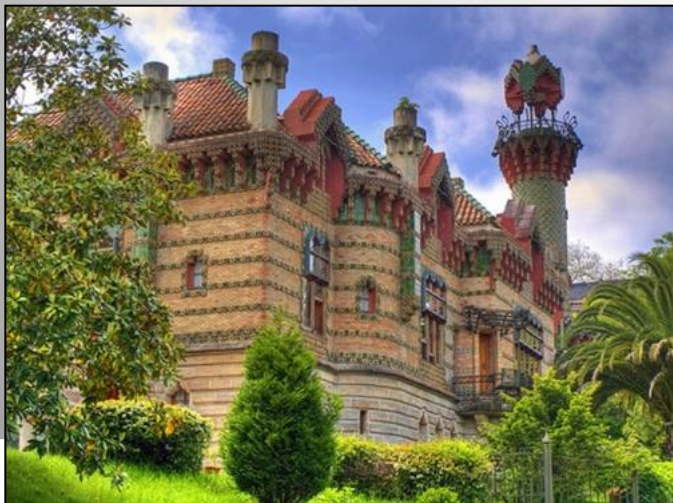
дом Эль Капричо