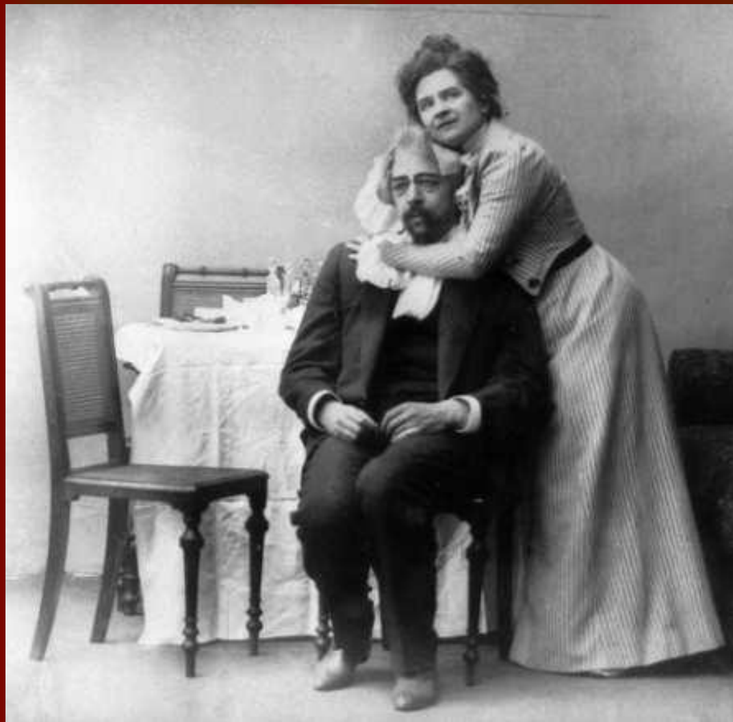
1899 год. Сцена из спектакля "Чайка", поставленном в МХТ. В роли Аркадиной - Ольга Книппер, в роли Тригорина - Константин Станиславский