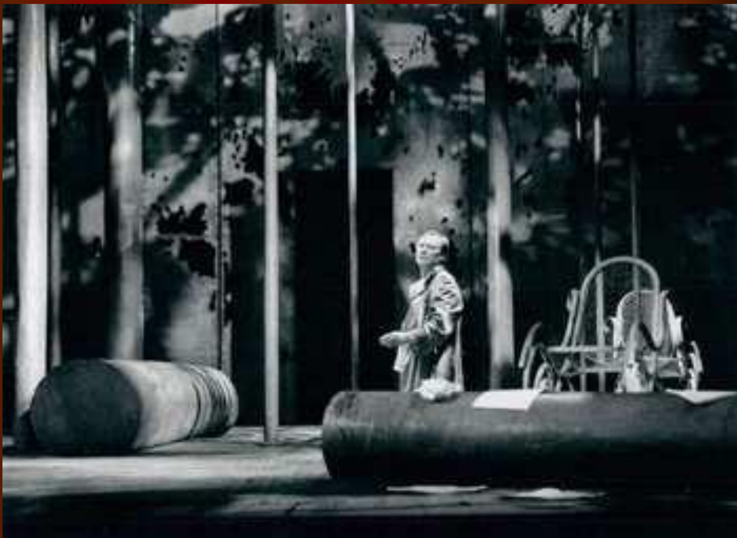
Спектакль «Иванов и другие» Генриетты Яновской. В главной роли - Сергей Шакуров