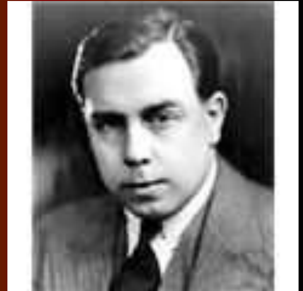
Английский драматург Дж.-Б. Пристли