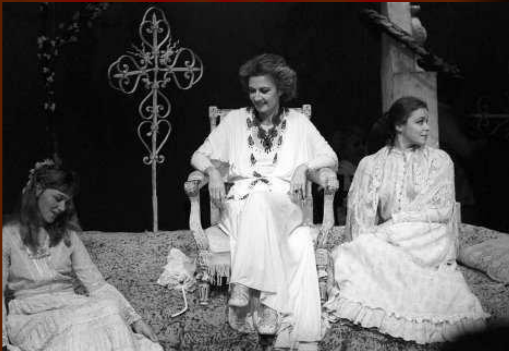
«Вишневый сад» на Таганке. Постановка А. Эфроса, 1975 год. В главной роли - Алла Демидова.