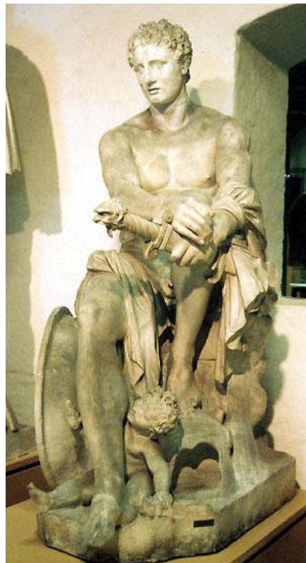
Арес Лоренцо Бернини, 1622