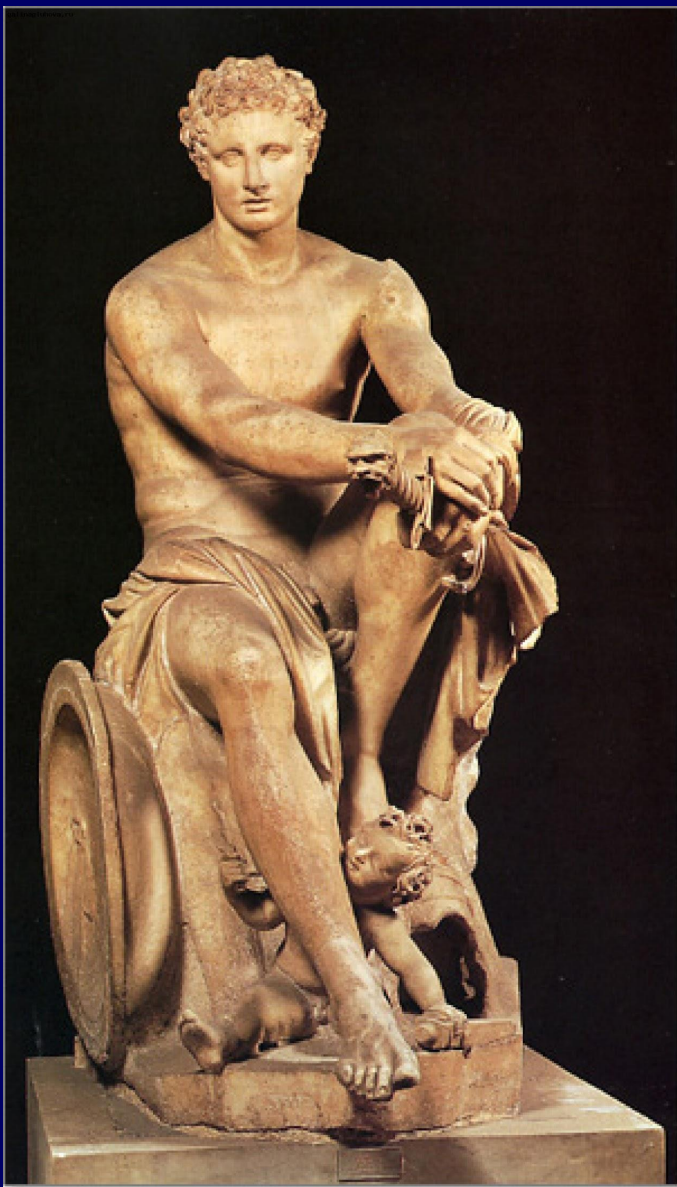
Ares / Mars, the God of Severity, with his sword and shield. At his feet, his bodhisattva.

Неизвестный автор. Арес Людовизи. Римская мраморная копия с греческого оригинала. Ок. 150 г. до н.э. Национальный музей, Рим