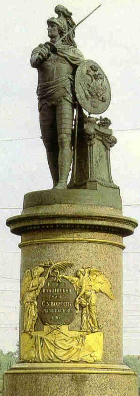
М.И.Козловский. Памятник А.В. Суворову. 1801 г. Санкт-Петербург