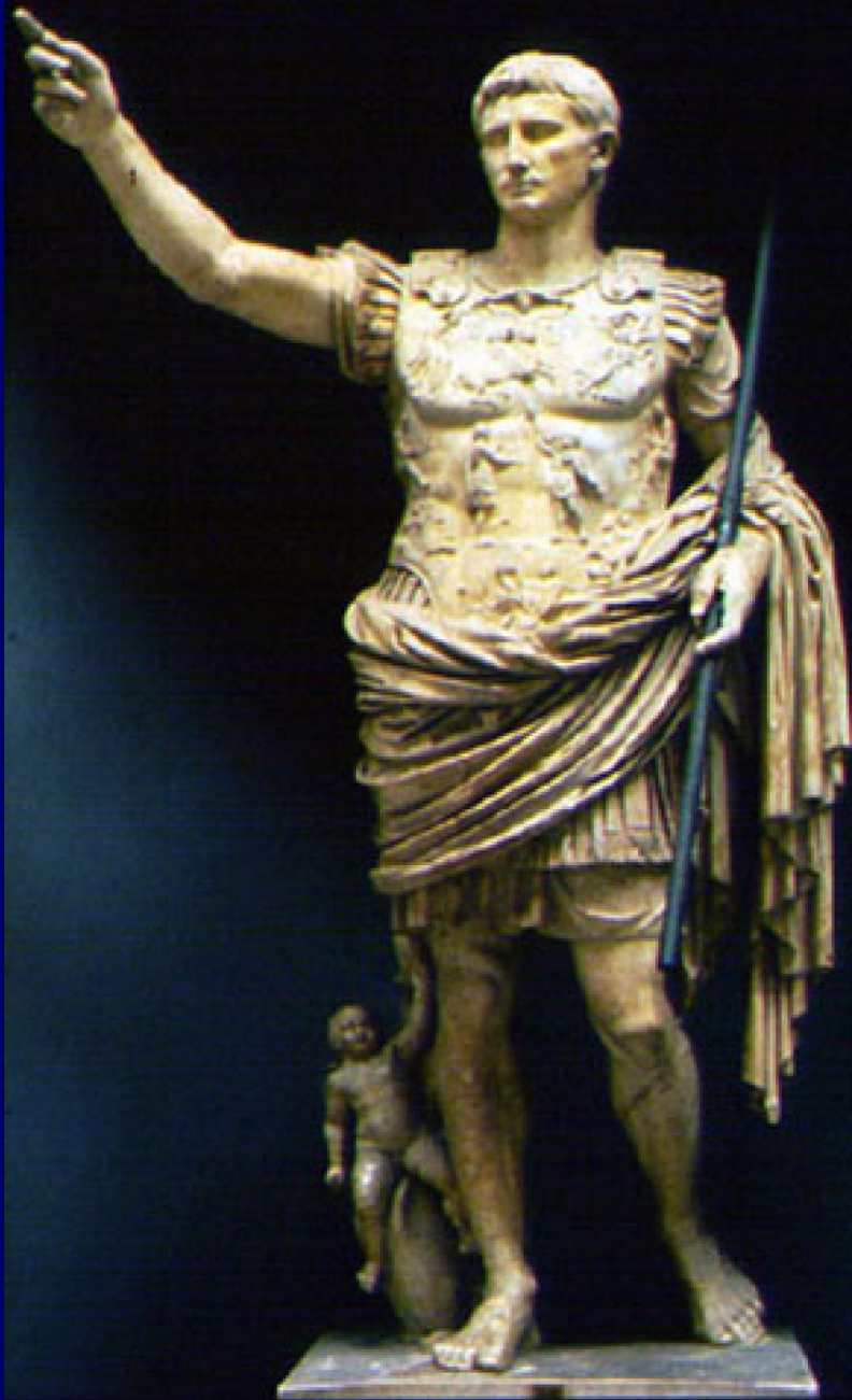
Скульптурный портрет императора Августа из Прима Порты. Мрамор. Начало I в.н.э. Музеи Ватикана, Рим