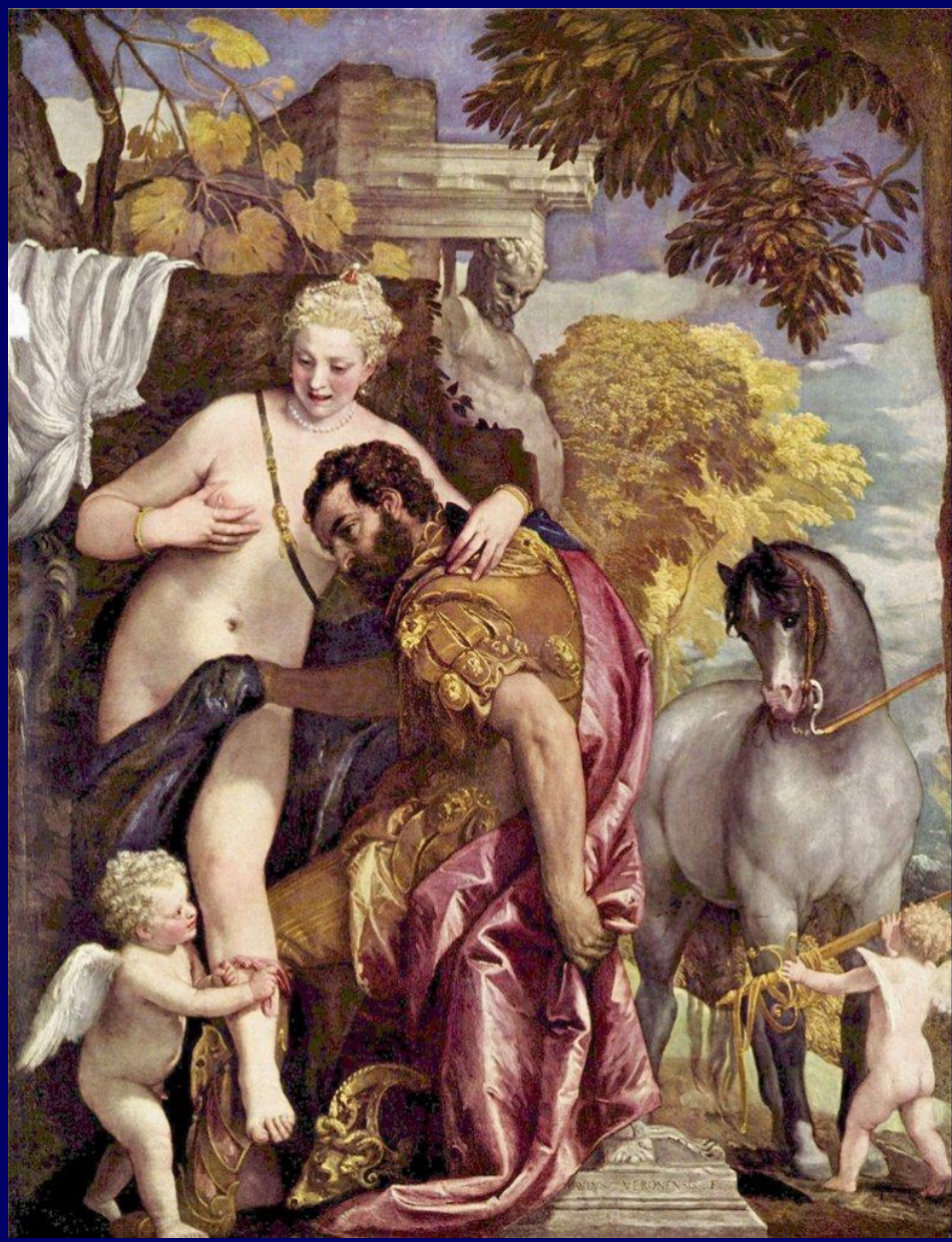
Паоло Веронезе. Венера и Марс, связанные Амуром. XVI в. Метрополитен- музей. Нью-Йорк