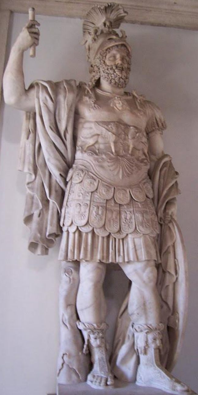
Марс с форума Нервы. Копия 90-х гг. I в. с оригинала II в. до н.э. Мрамор. Капитолийский музей, Рим