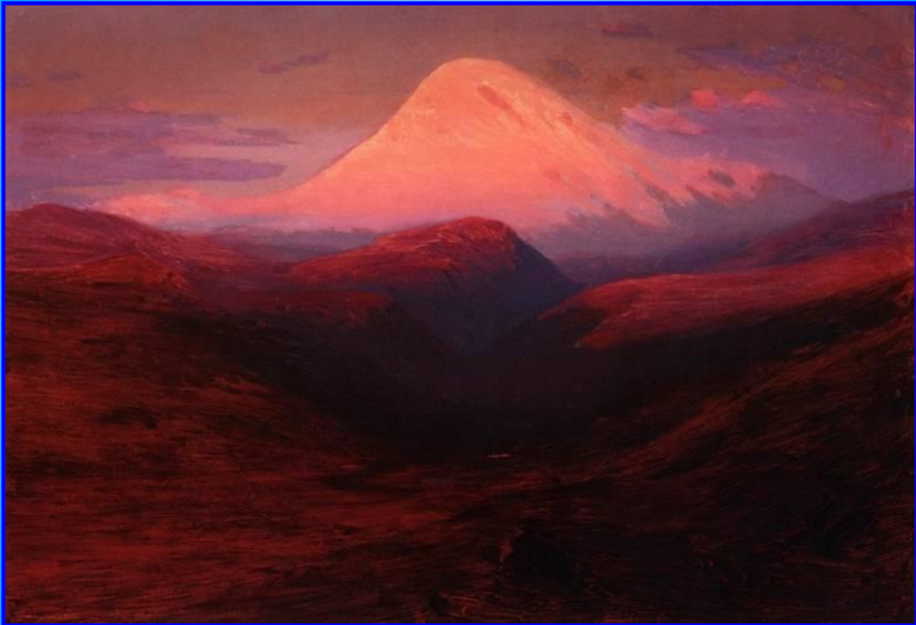
Эльбрус на закате