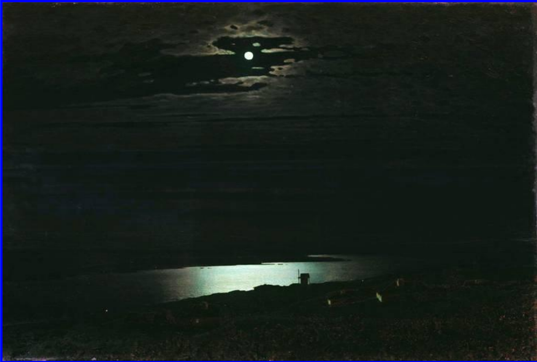
Лунная ночь на Днепре