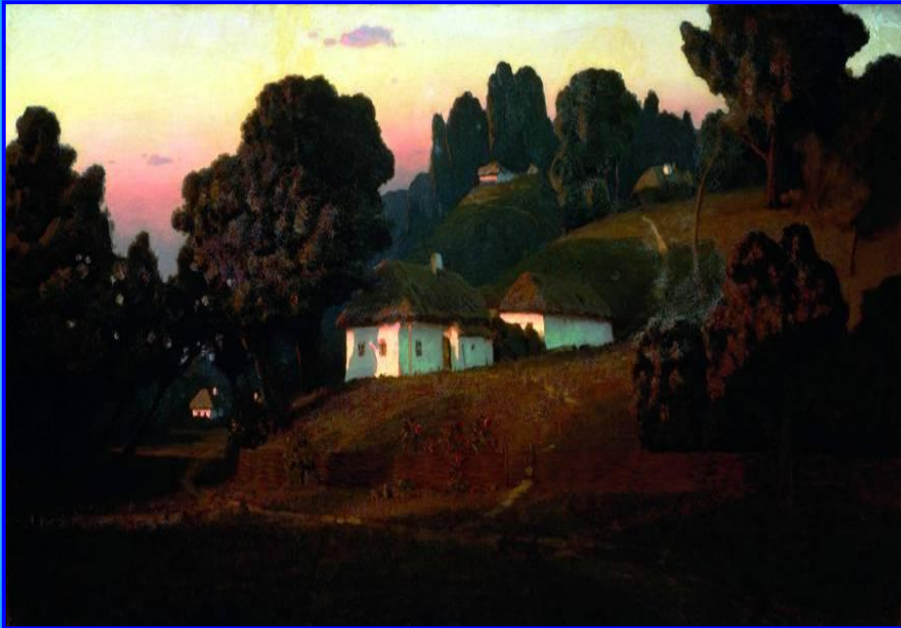
Вечер на Украине