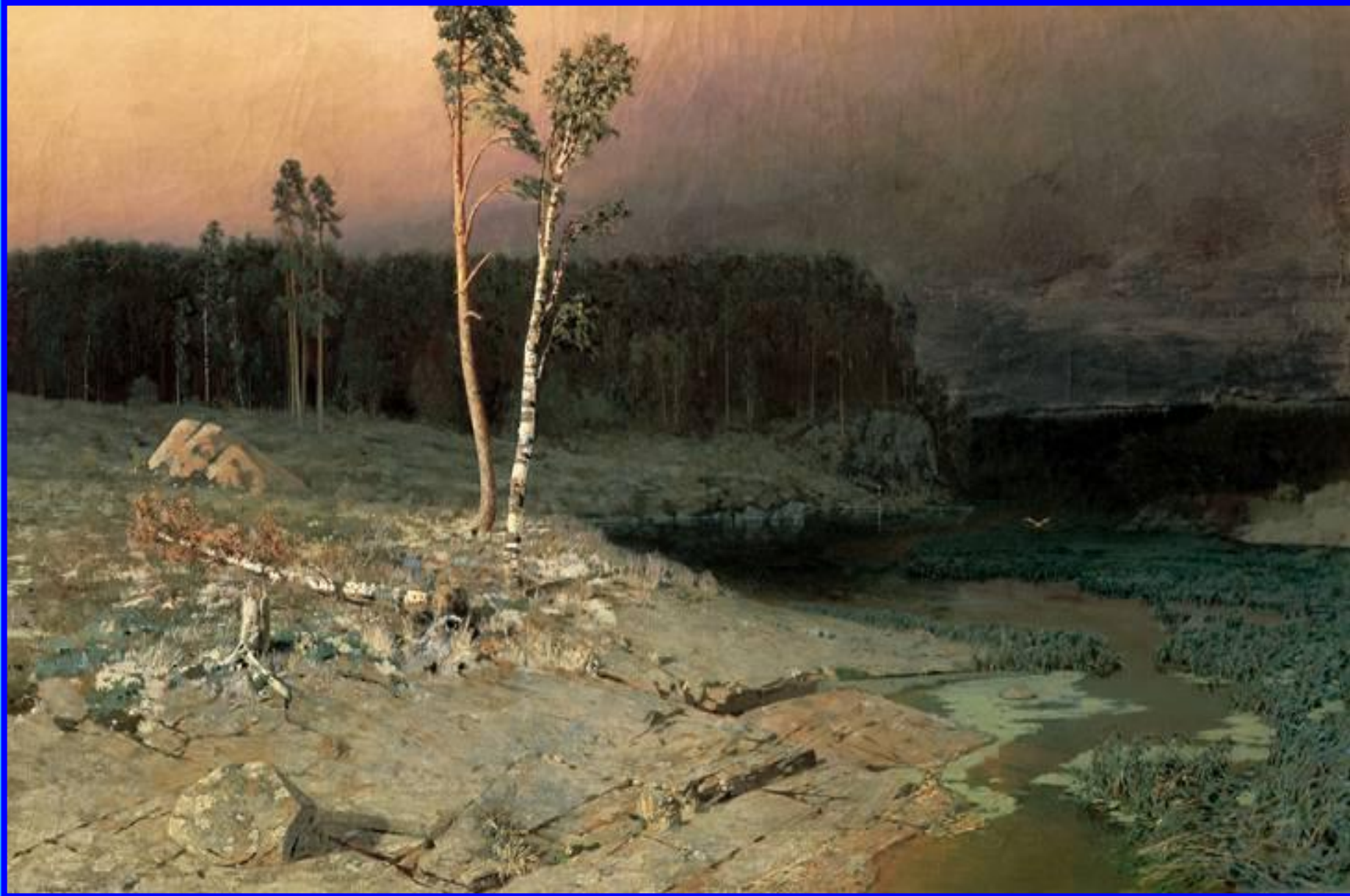
На острове Валааме