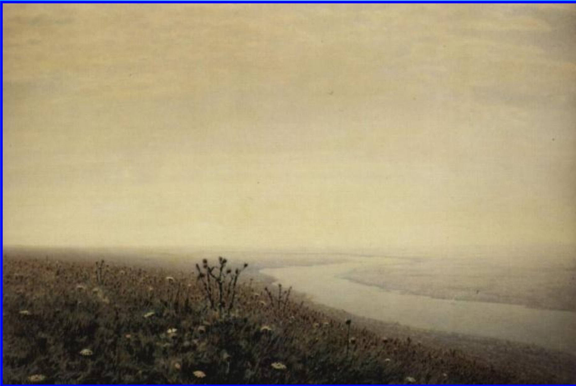
Утро на Днепре