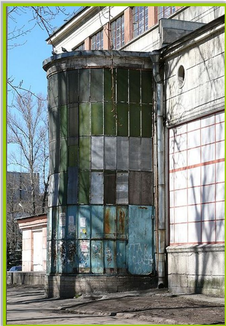
Объем винтовой лестницы