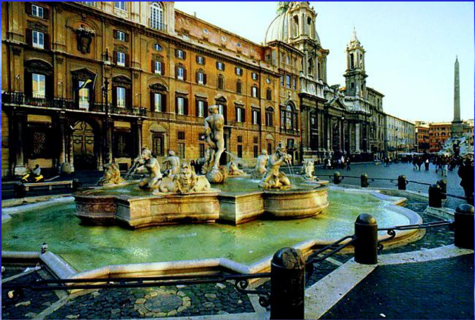
Лоренцо Бернини. Рим. Фонтан Нептуна на площади Навона.