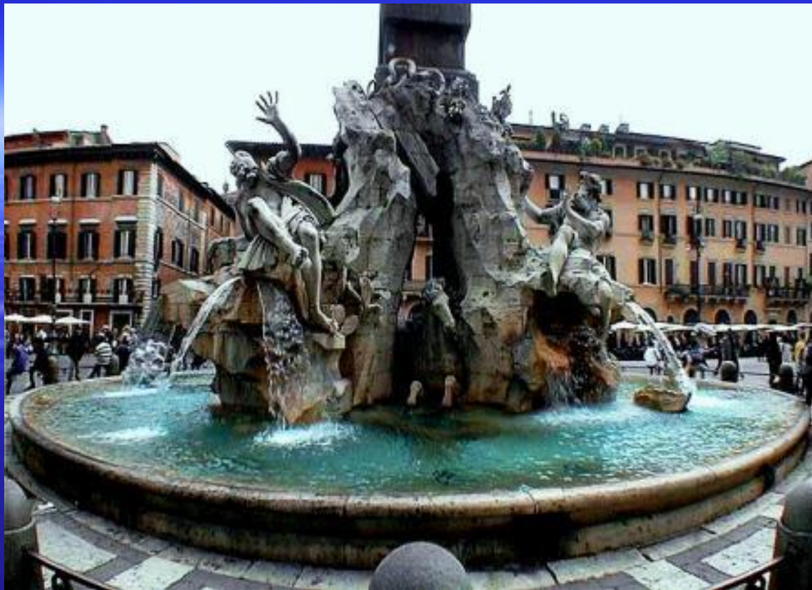
Лоренцо Бернини. Фонтан Четырех рек на площади Навона. 1648-1651.

Аллегорические фигуры изображают самые большие реки континентов — Нил, Дунай, Ганг и Рио-де-ла-Плата (Амазонка тогда была неизвестна). Покрывало на голове Нила символизирует таинственность его истока, который в то время еще не открыли. Расположение фигур фонтана породило легенду о поединке между гениями эпохи барокко — Бернини и Борромини: будто бы Ла Плата Бернини загоразживается рукой, чтобы не видеть церковь — «ужасное» творение Борромини. На самом деле фонтан построен гораздо раньше, чем церковный фасад. По проекту Бернини создан и фонтан Мавра, один из двух фонтанов, расположенных по краям площади. Другой фонтан в оригинале состоял лишь из одного бассейна, к которому в конце 19 в. добавили скульптуру — так возник фонтан Нептуна.