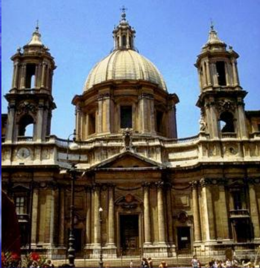
Франческо Барромини. Церковь Сант Аньезе. 1653 г. Рим.

Характерные черты итальянского барокко нашли наиболее яркое воплощение в творчестве двух зодчих, создавших целую эпоху в развитии архитектуры, - Франческо Борромини и Лоренцо Бернини.