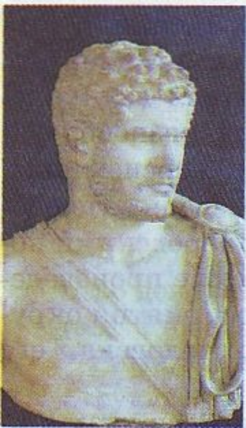
Император Каракалла. II в. Лувр, Париж