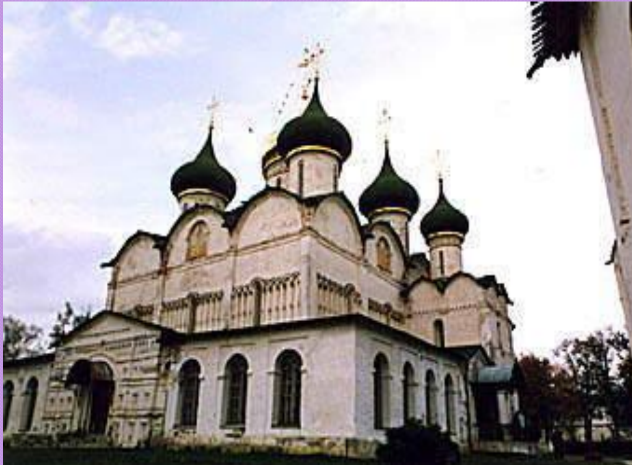
Суздаль. Преображенский собор Спасо-Евфимьевого монастыря. 1507 год