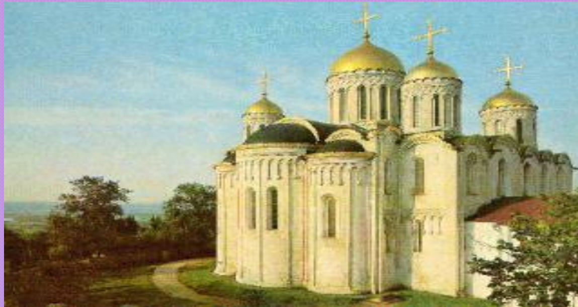
Владимир. Дмитриевский собор. 1194 год