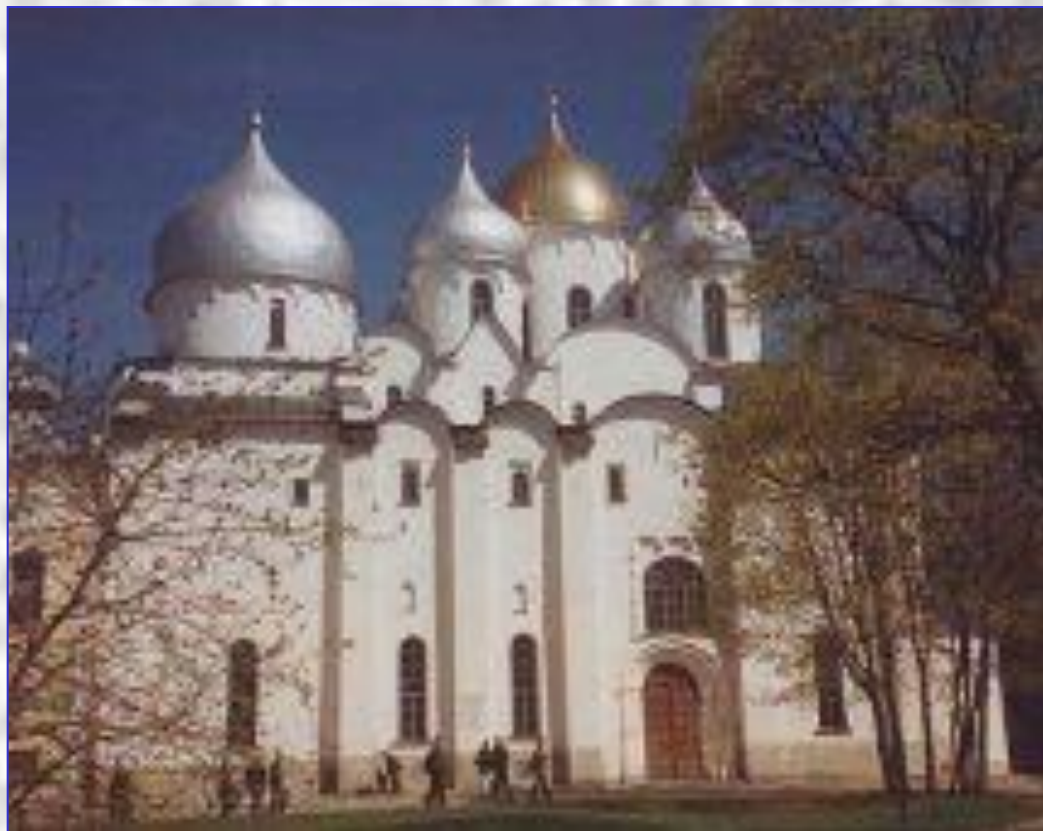
Софийский собор в Новгороде