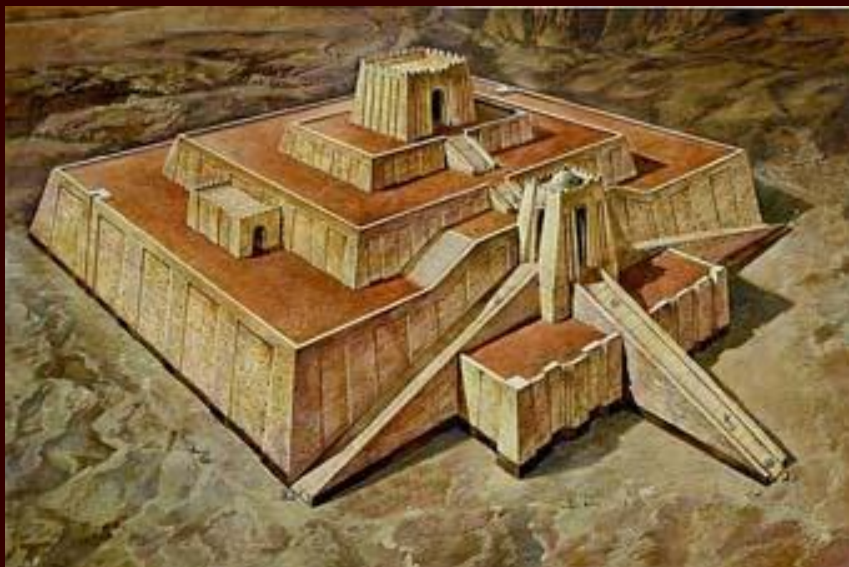
Реконструкция зиккурата в

На вершине находился храм, где, как считалось, обитали боги.