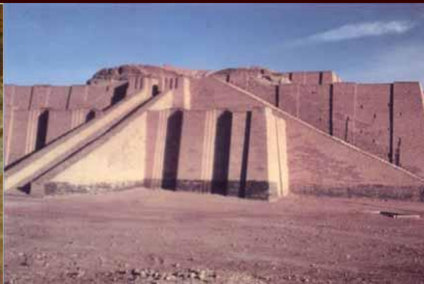
Остатки зиккурата в