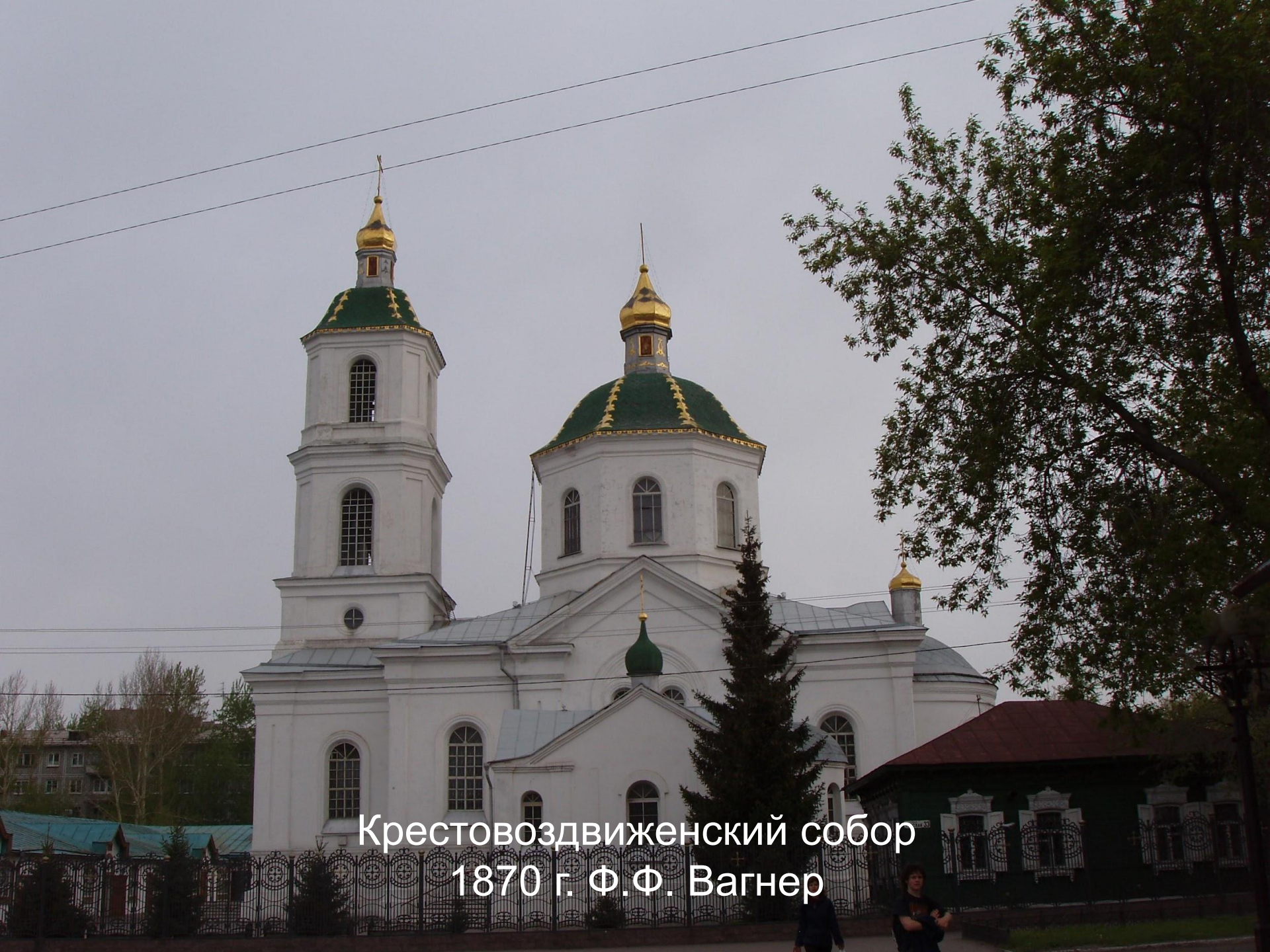
Крестовоздвиженский собор 1870 г. Ф.Ф. Вагнер