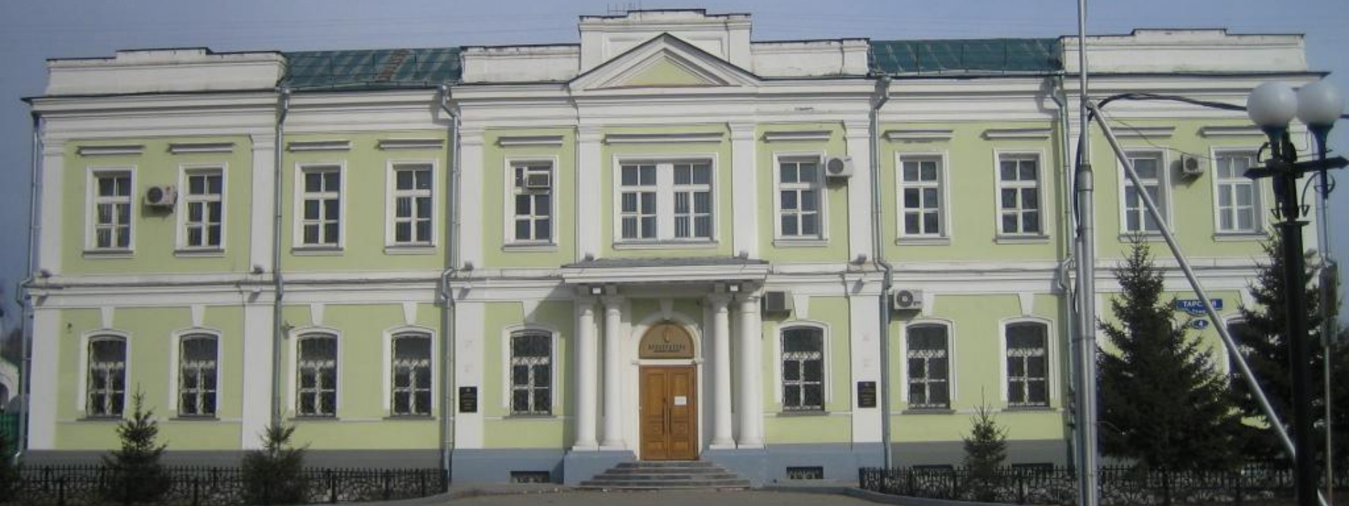
Фельдшерская школа 1883 г. Эзет Э.И.