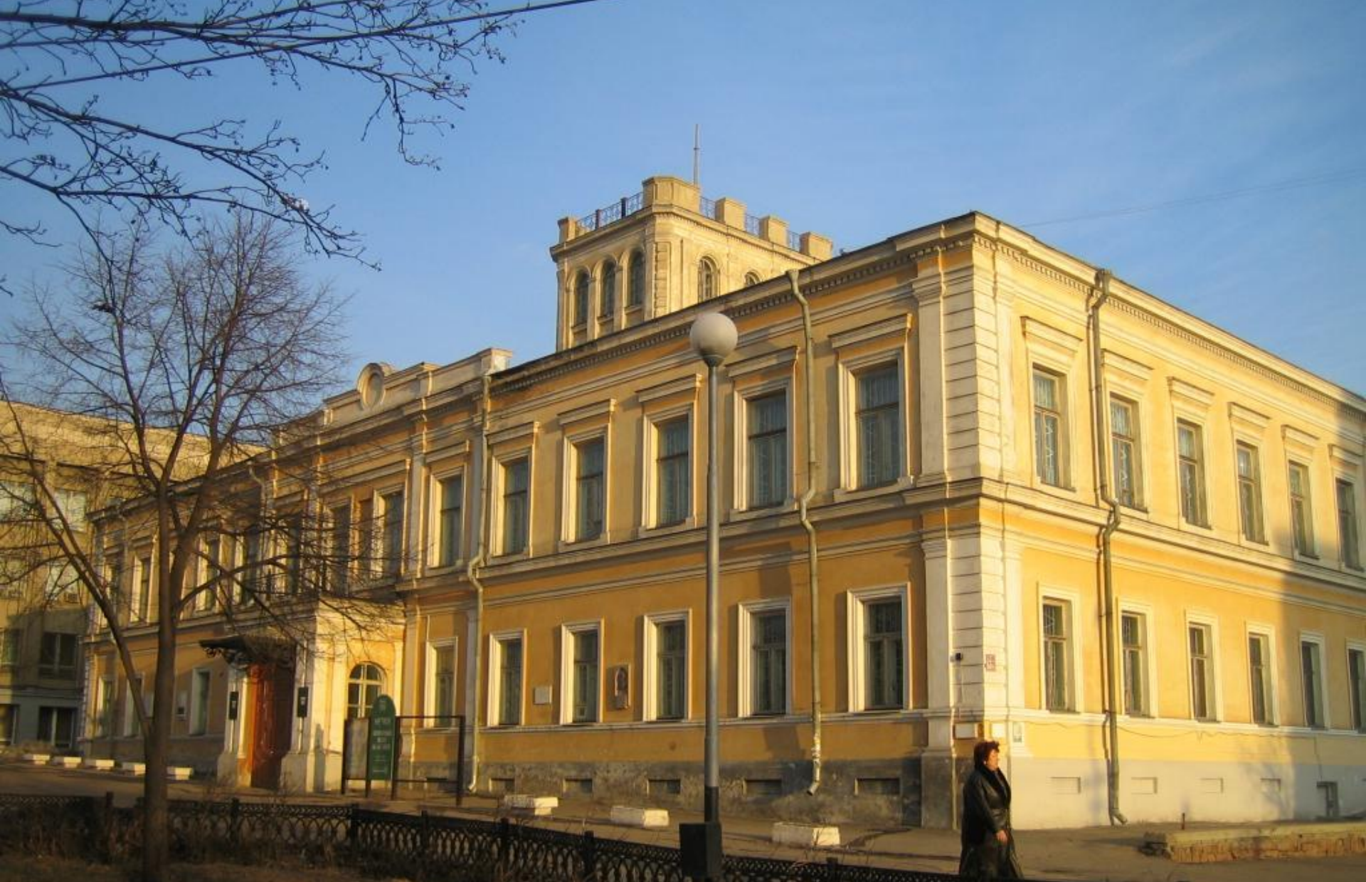
Генерал-губернаторский дворец 1862 г. Вагнер Ф.Ф.