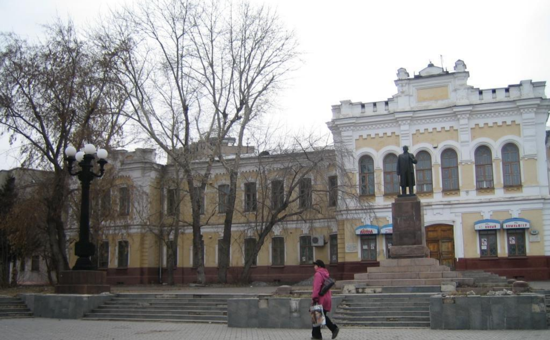
Женская гимназия 1882 г. Эзет Э.И.