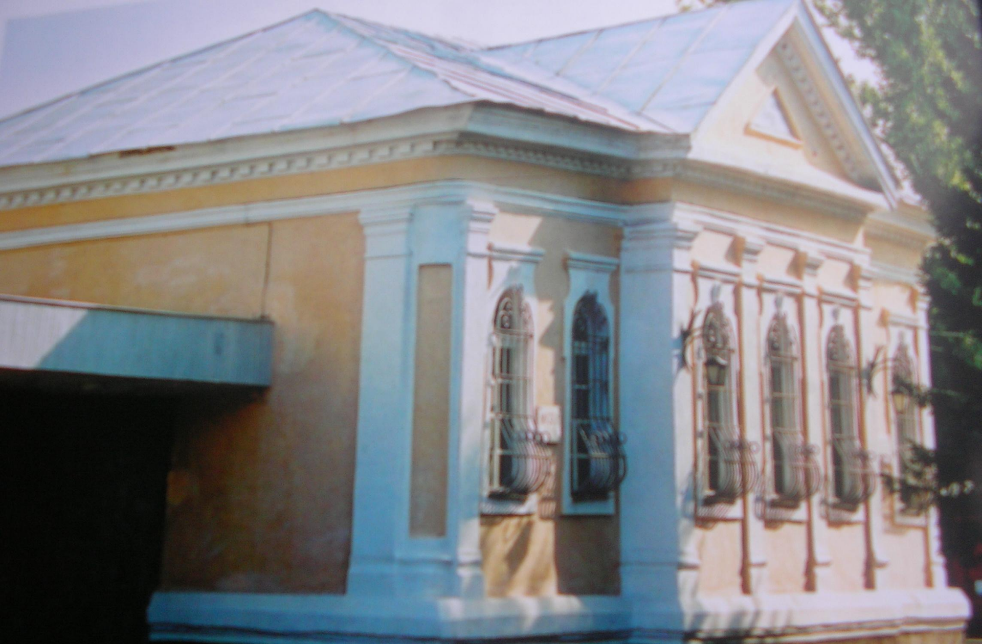
Лютеранская церковь 1792 г.