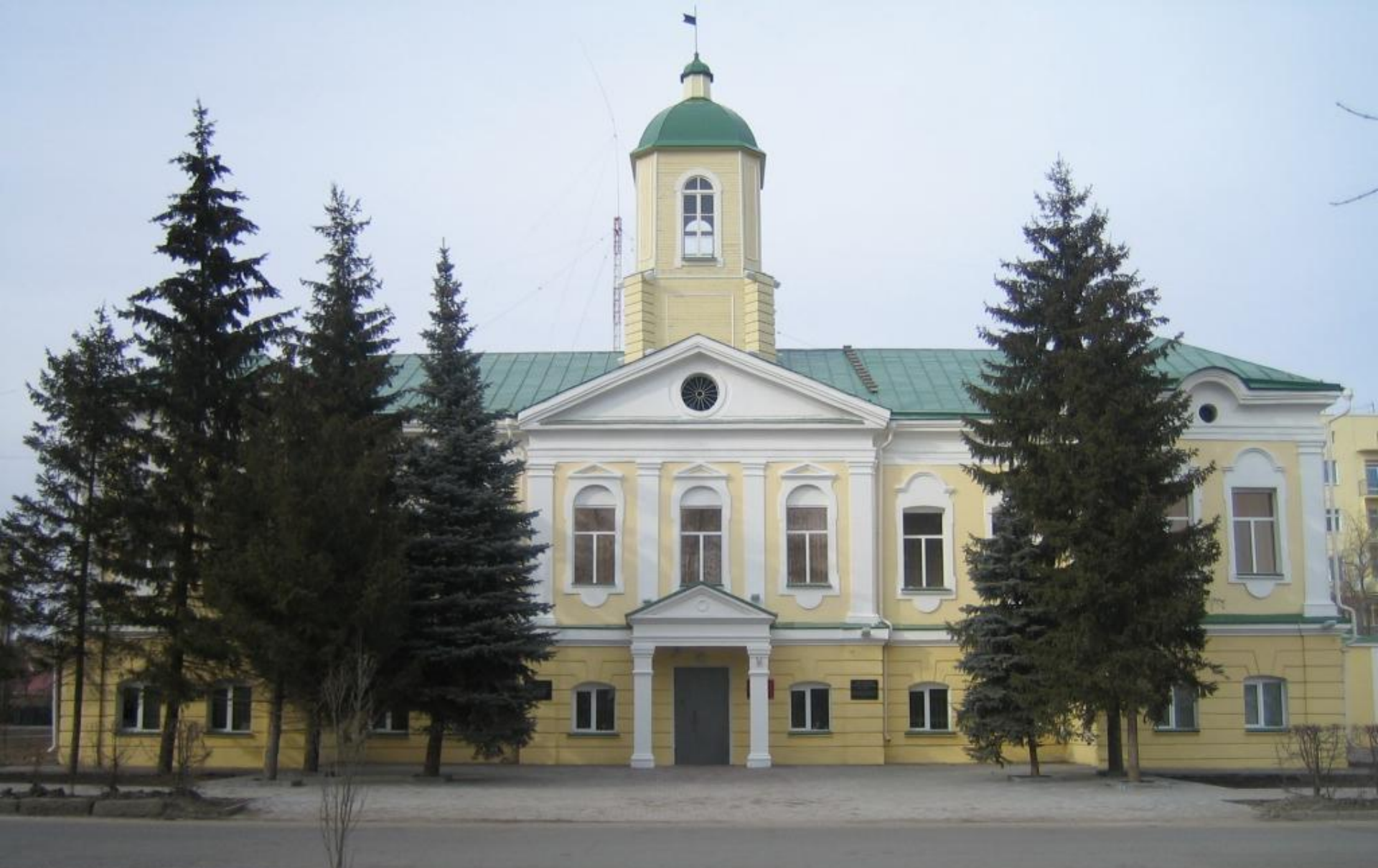
Здание Гауптвахты 1781 г.