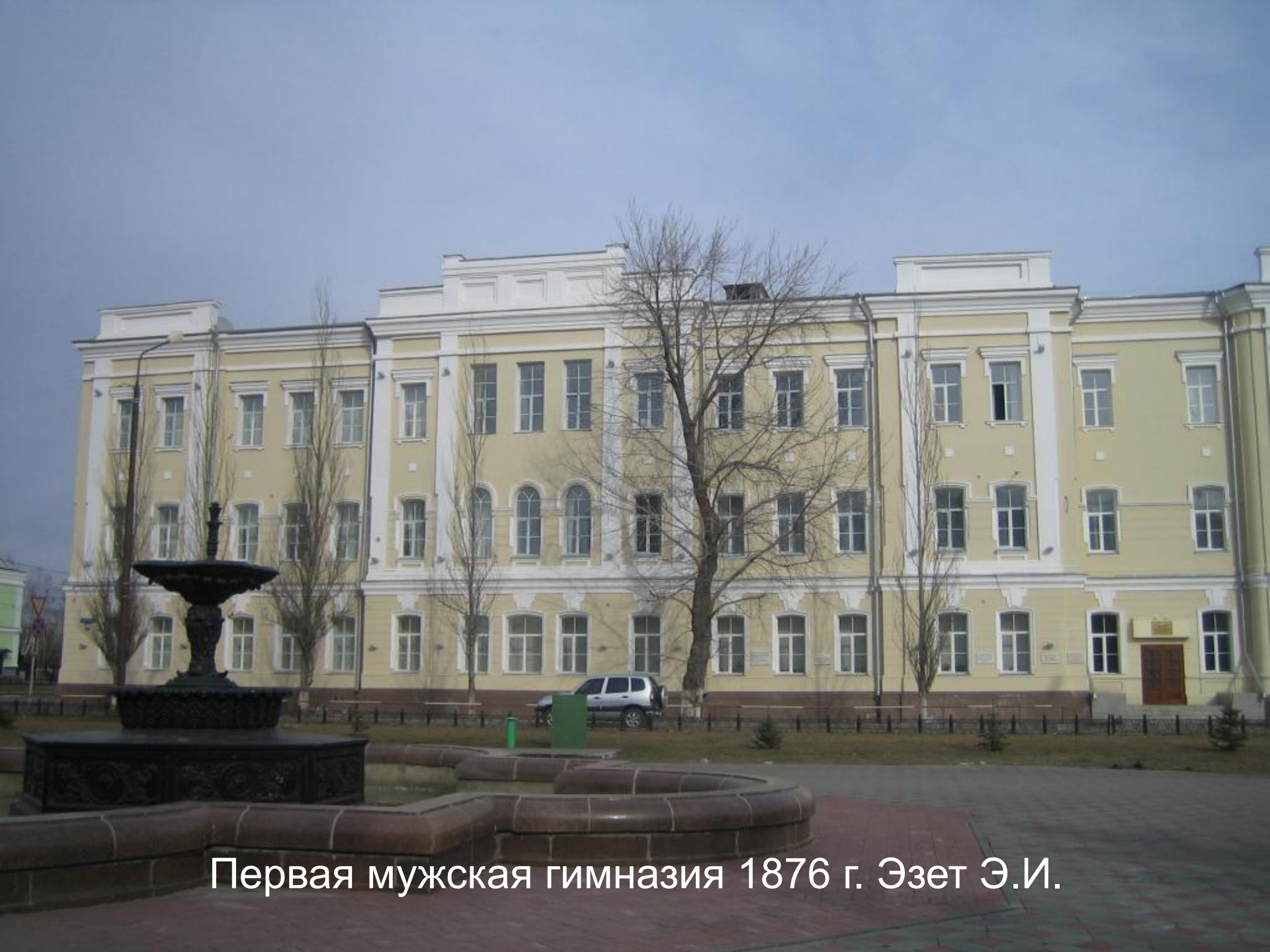
Первая мужская гимназия 1876 г. Эзет Э.И.