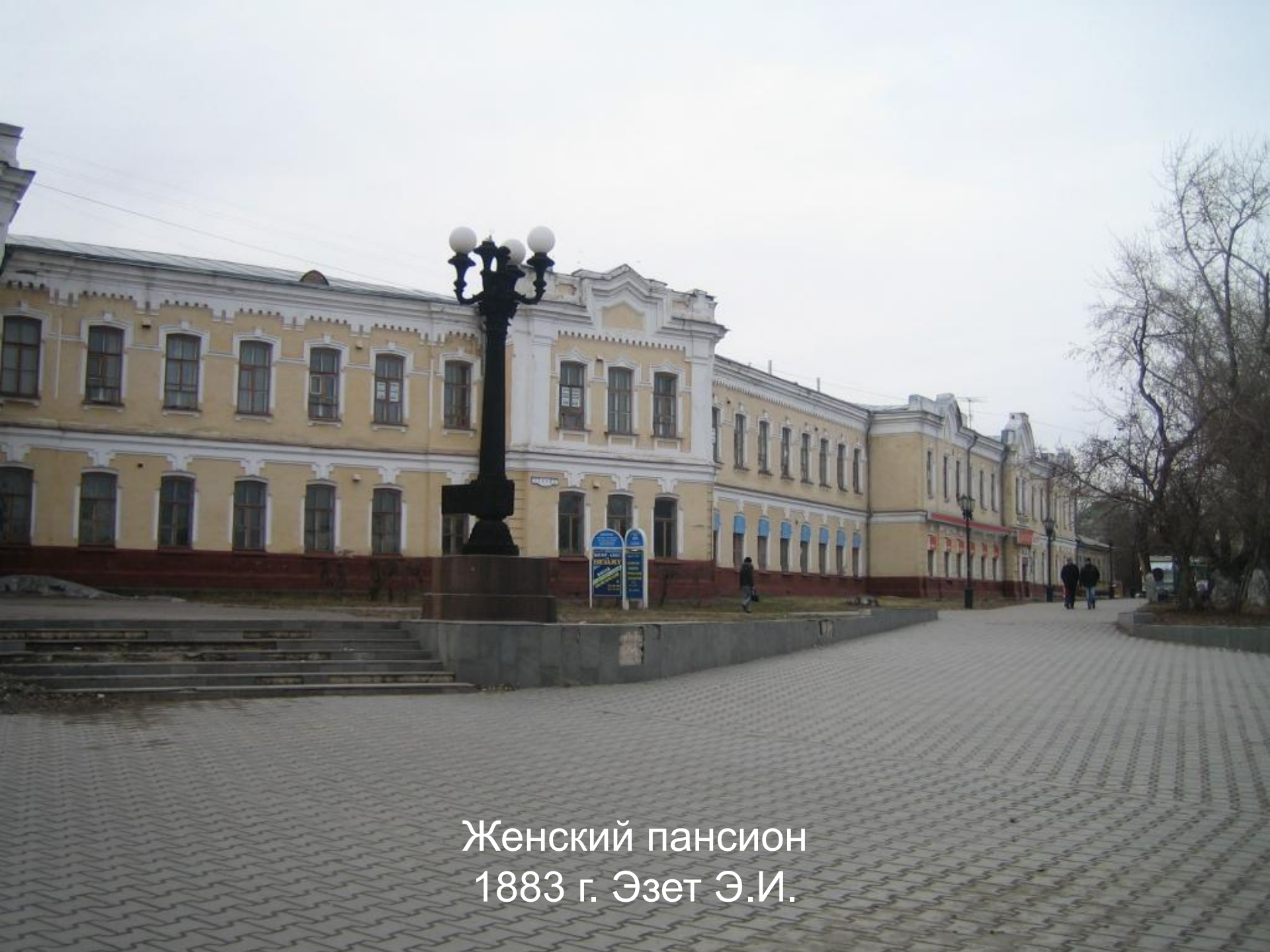
Женский пансион 1883 г. Эзет Э.И.