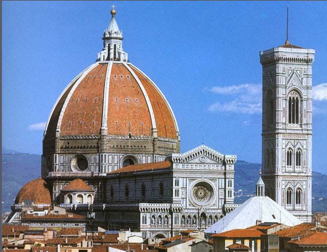
Собор Санта- Мария дель Фьоре. 1420-1426