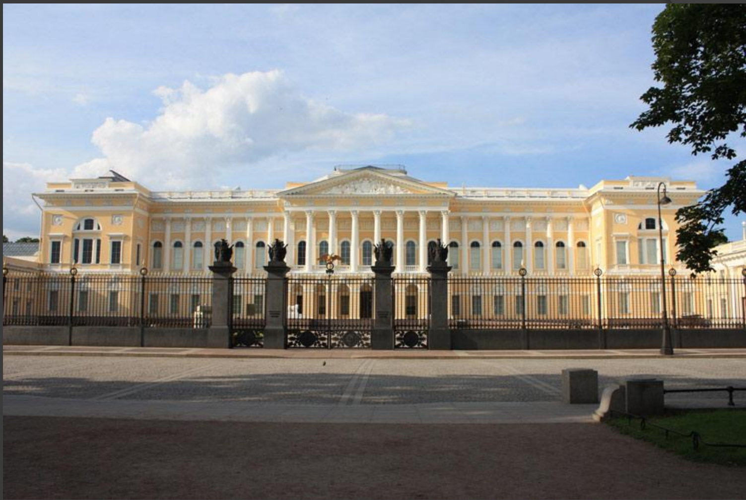
Михайловский Дворец. Санкт-Петербург. 1817-1825гг. Сейчас- Русский музей