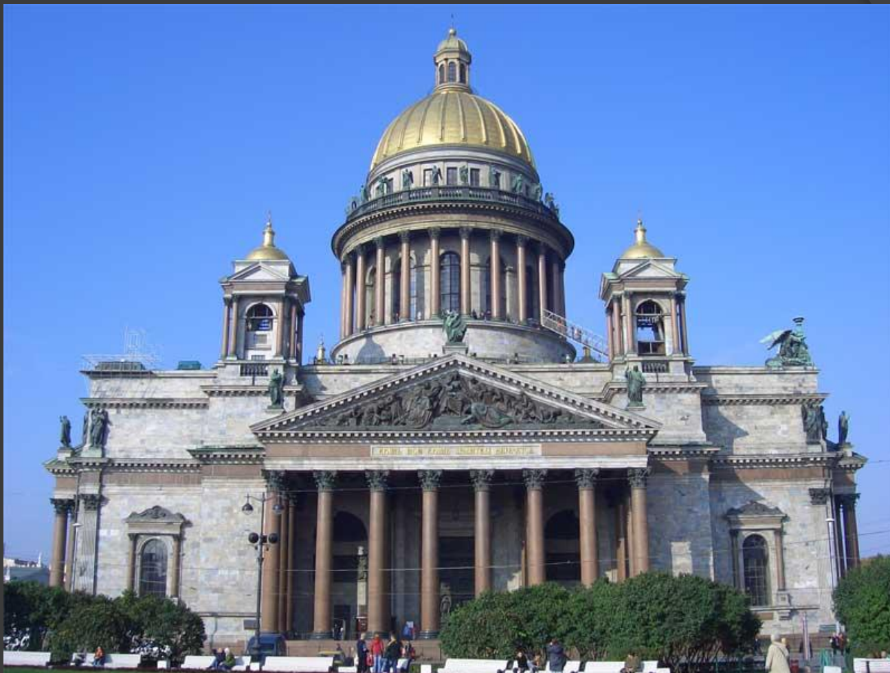
Исаакиевский собор. Санкт-Петербург. 1818-1858гг.