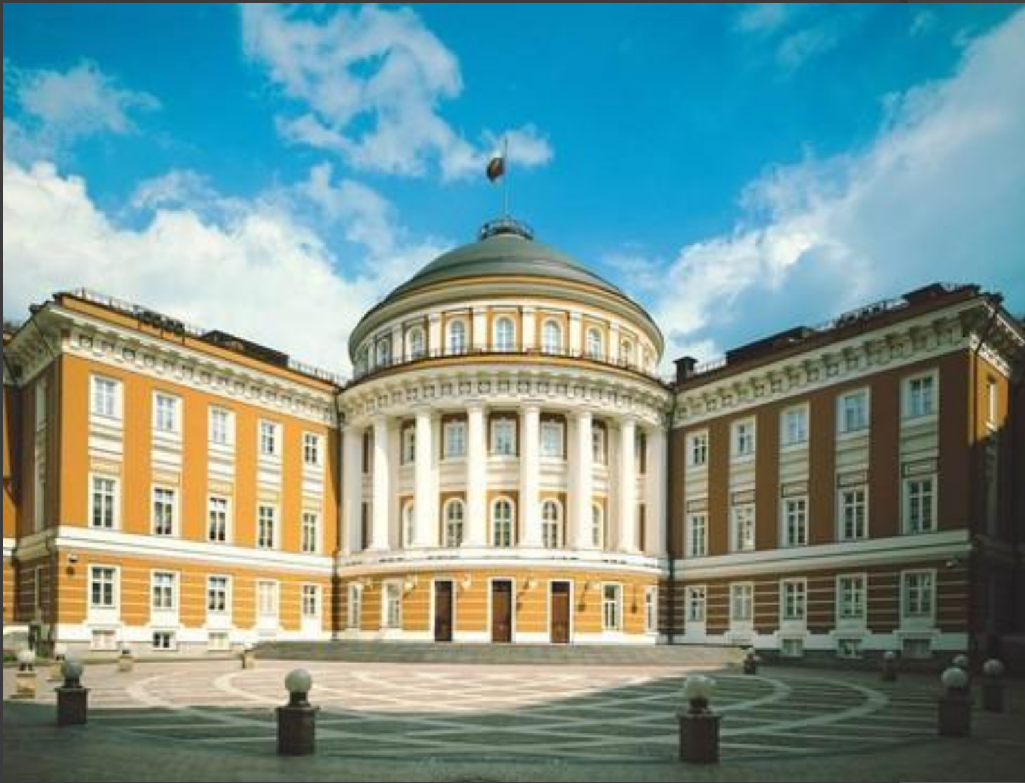
Здание Сената в Кремле. 1783г.