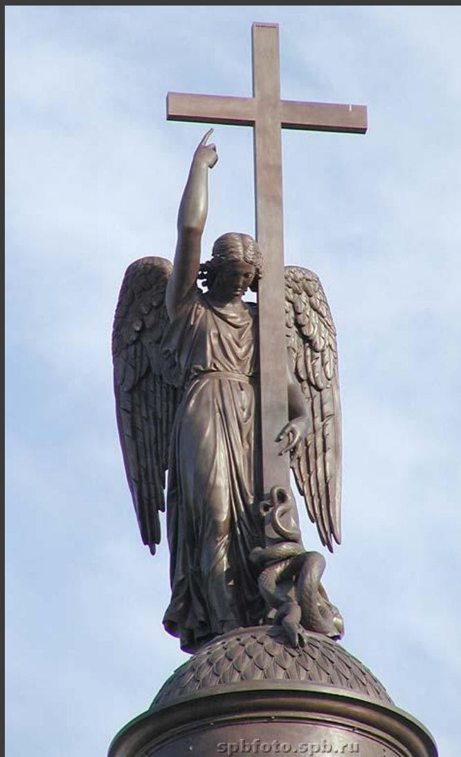
Ангел на Александровской колонне.