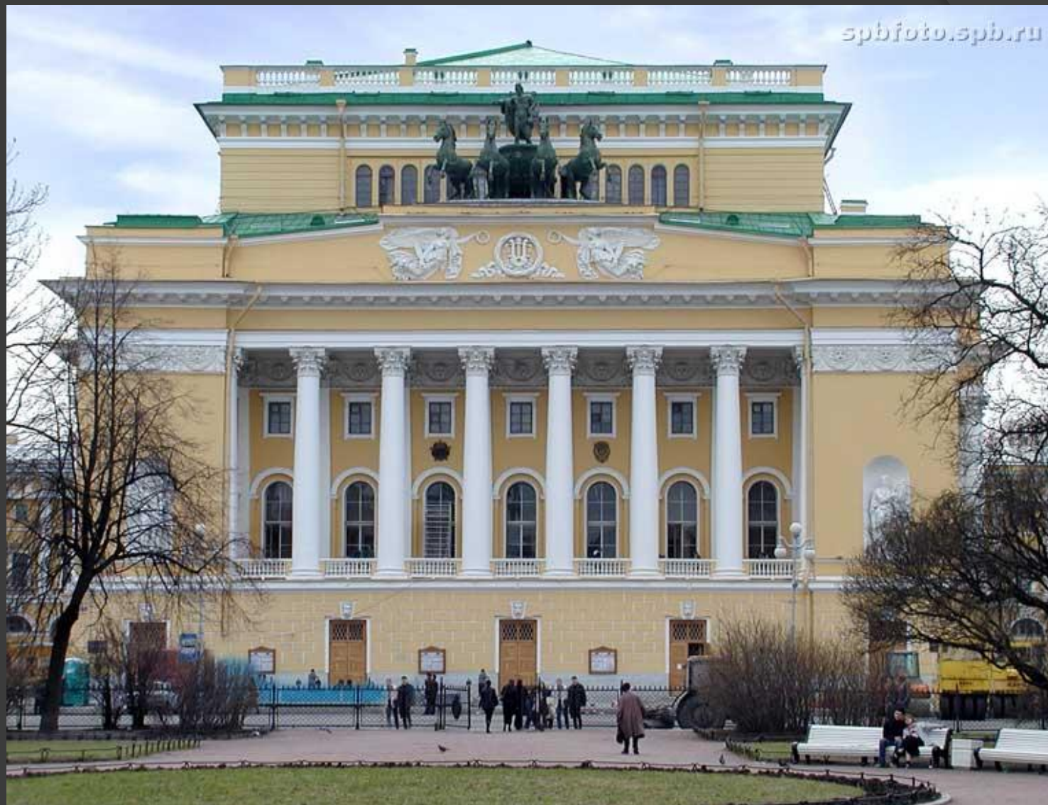
Александринский театр. Санкт-Петербург. 1832 г.