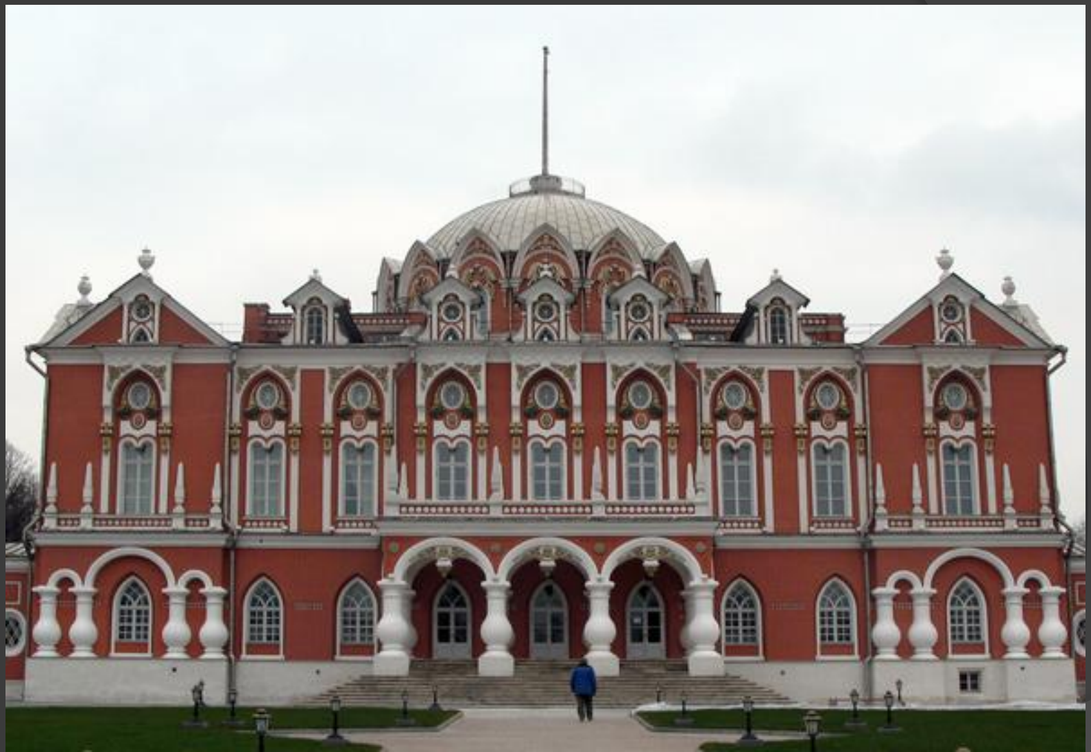
Петровский дворец. 1775 – 1782 гг. Москва.