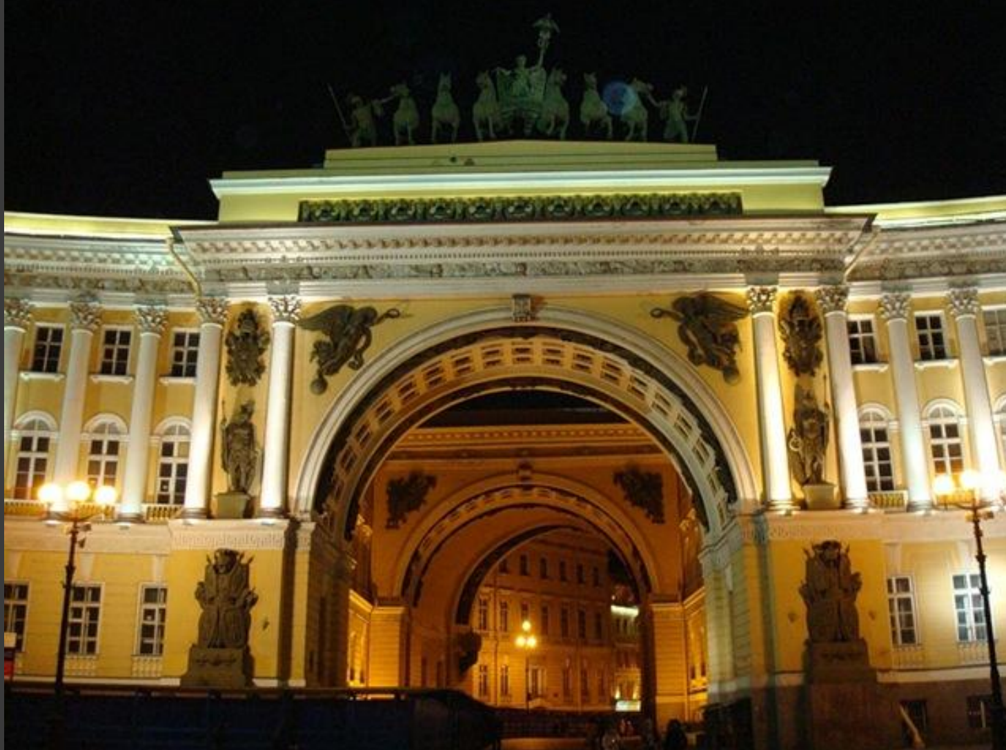
Здание главного штаба. Санкт-Петербург 1819-1829гг.