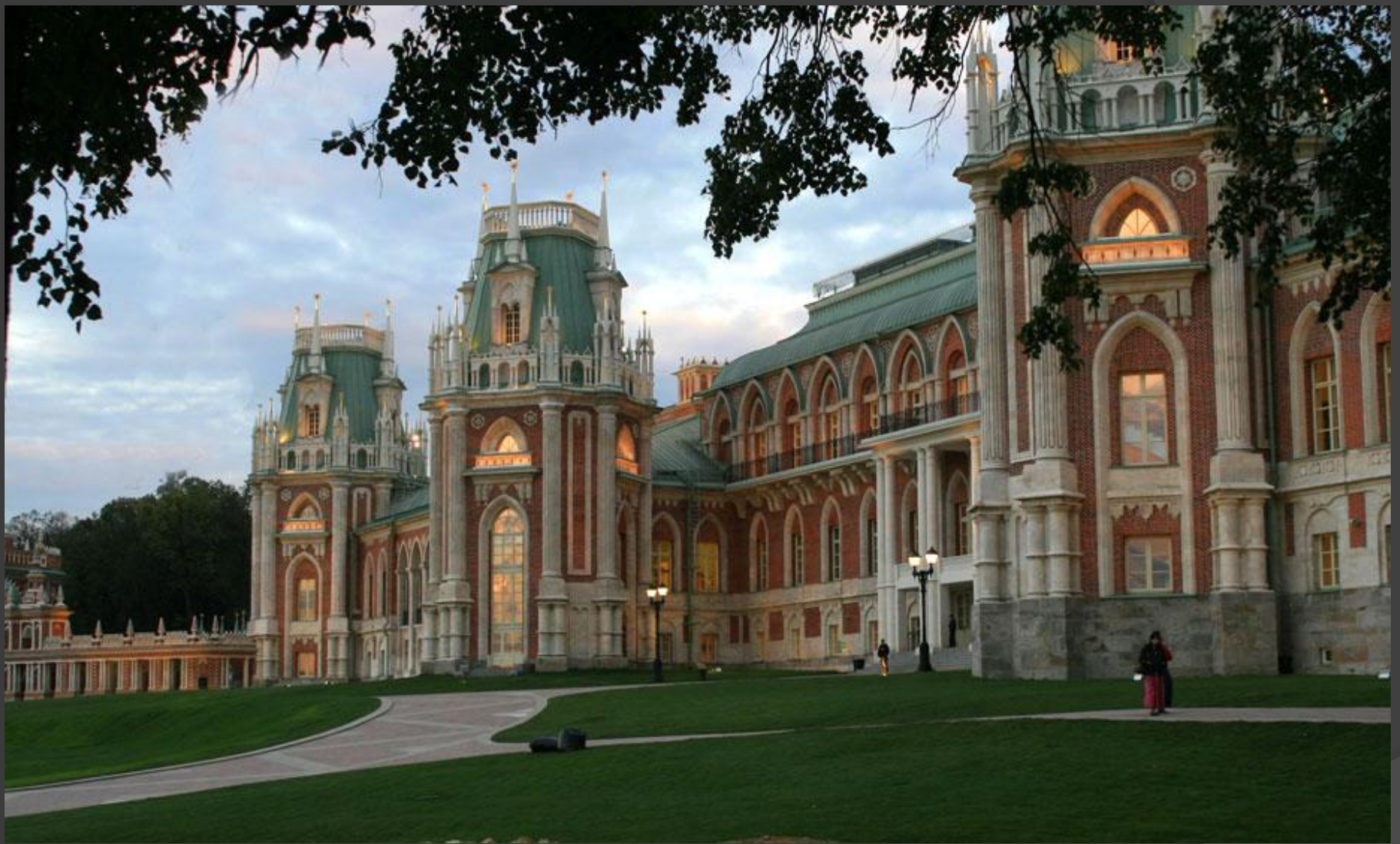
Дворцовый ансамбль в Царицыно. 1775 – 1785 гг. Москва.