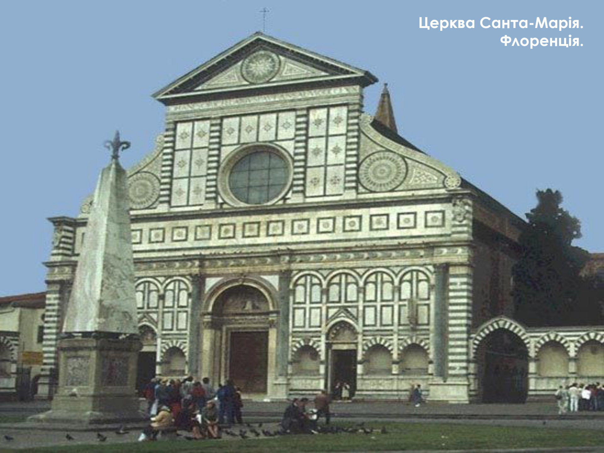
Церква Санта-Марія. Флоренція.