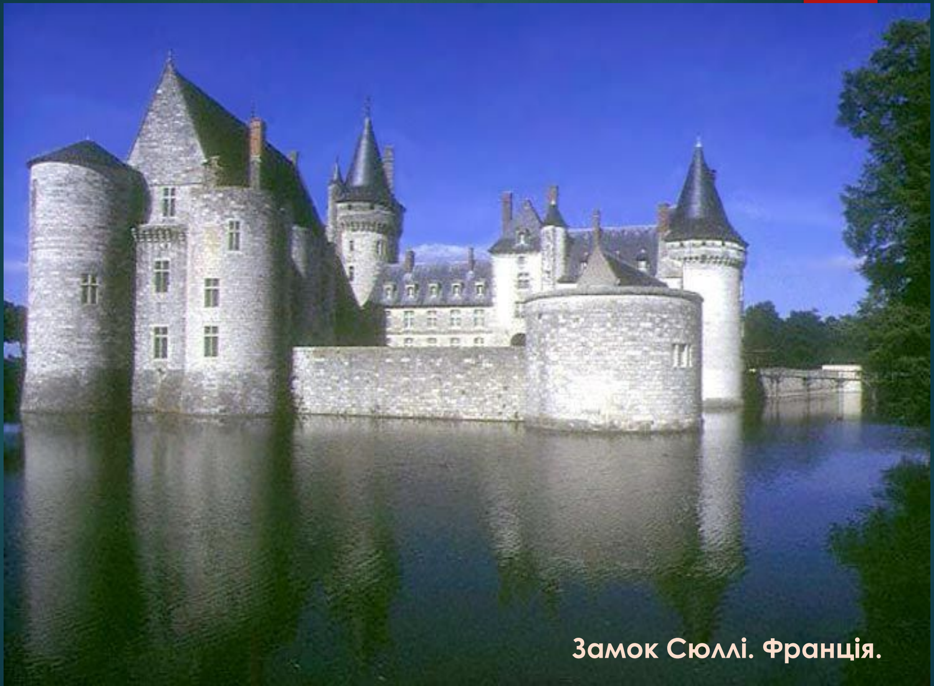
Замок Сюллі. Франція.