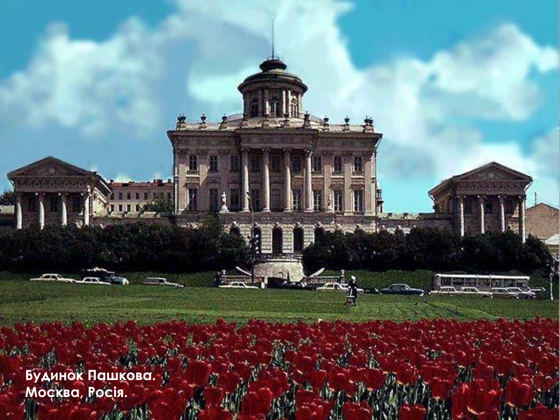
Будинок Пашкова. Москва, Росія.