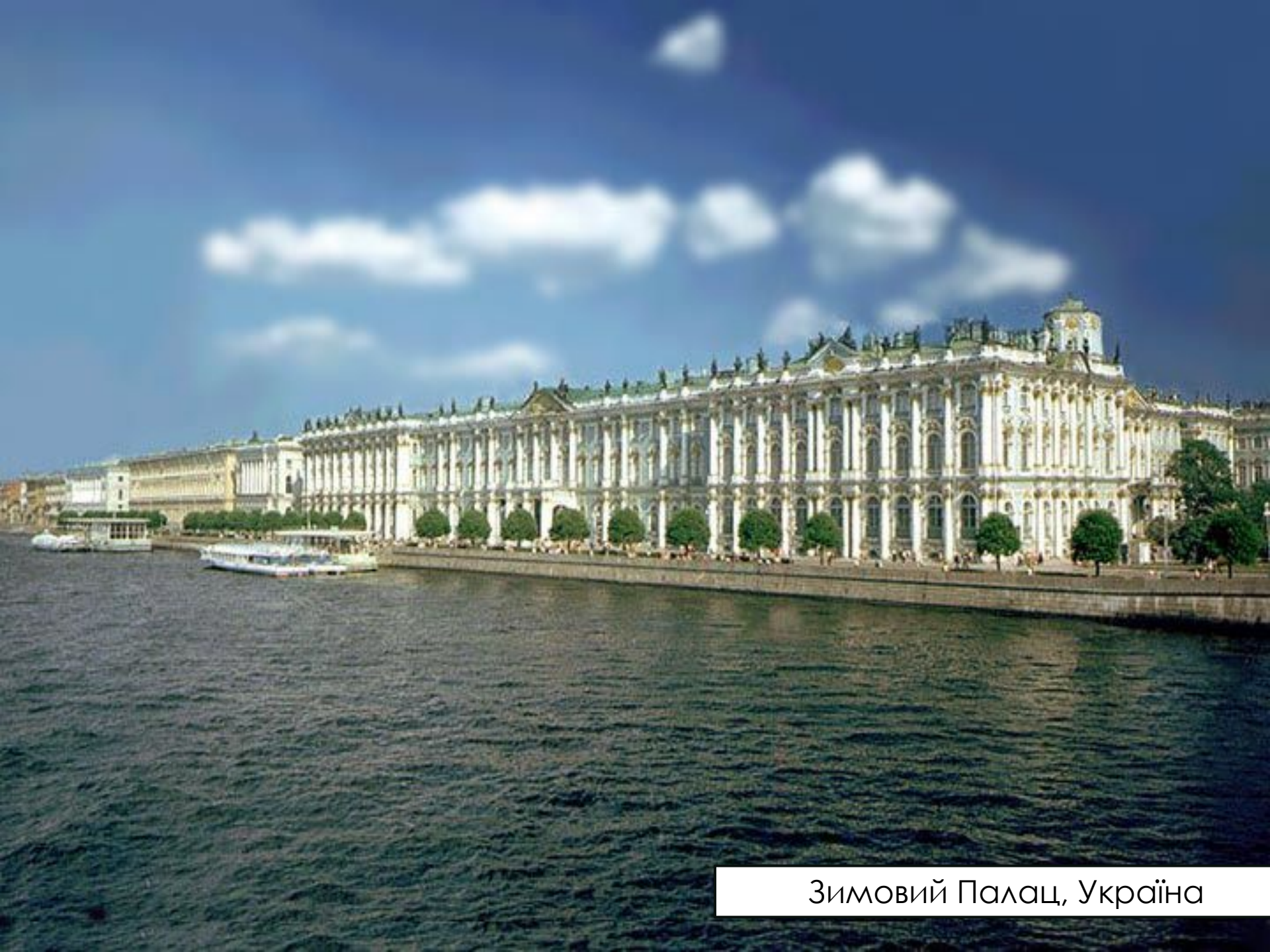
Зимовий Палац, Україна