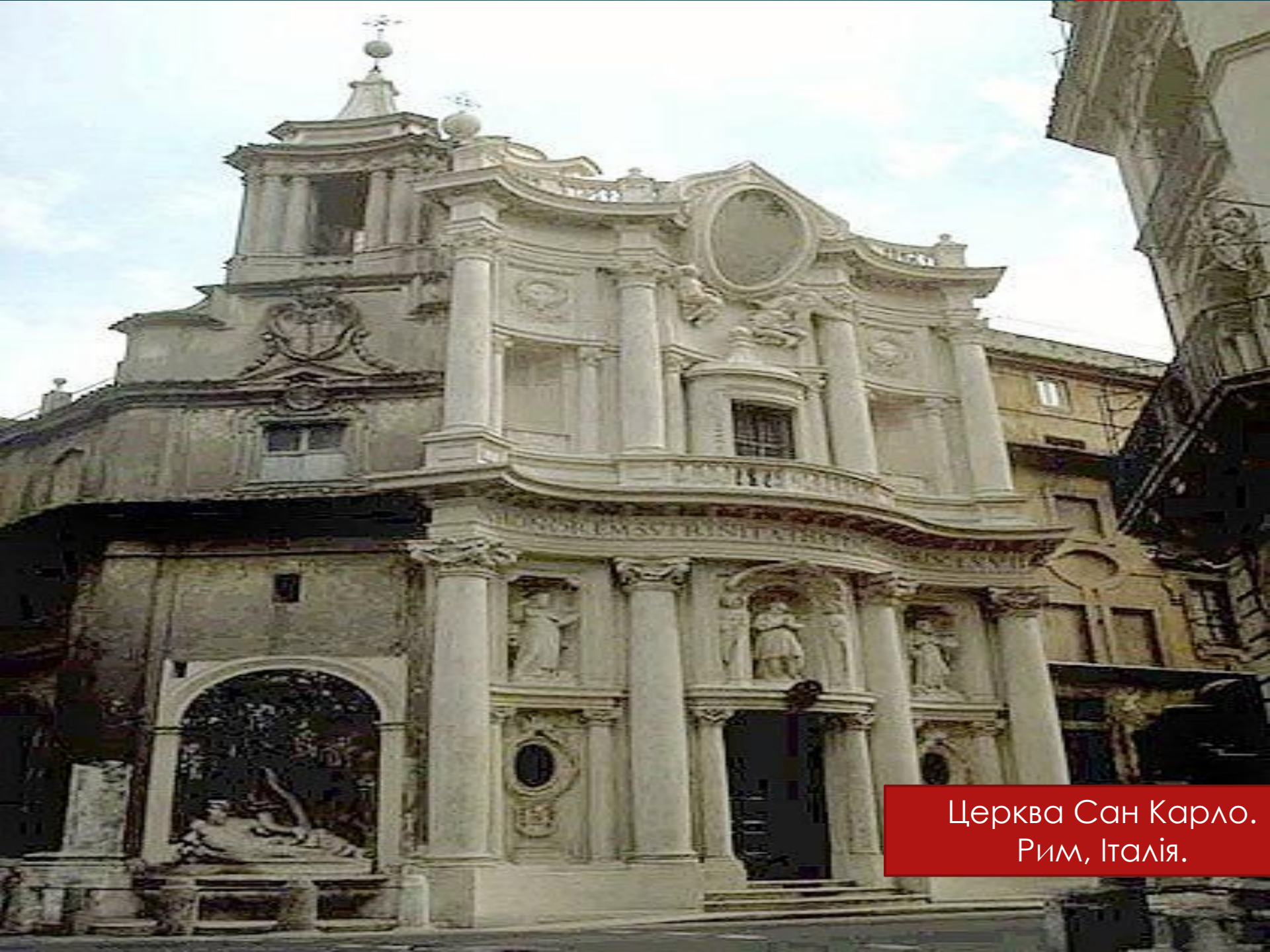
Церква Сан Карло. Рим, Італія.