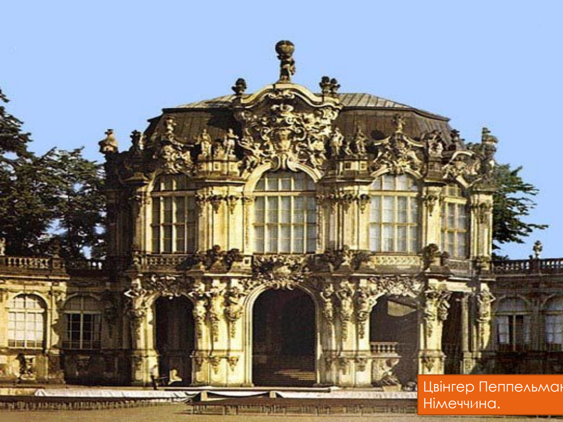
Цвінгер Пеппельман Німеччина.