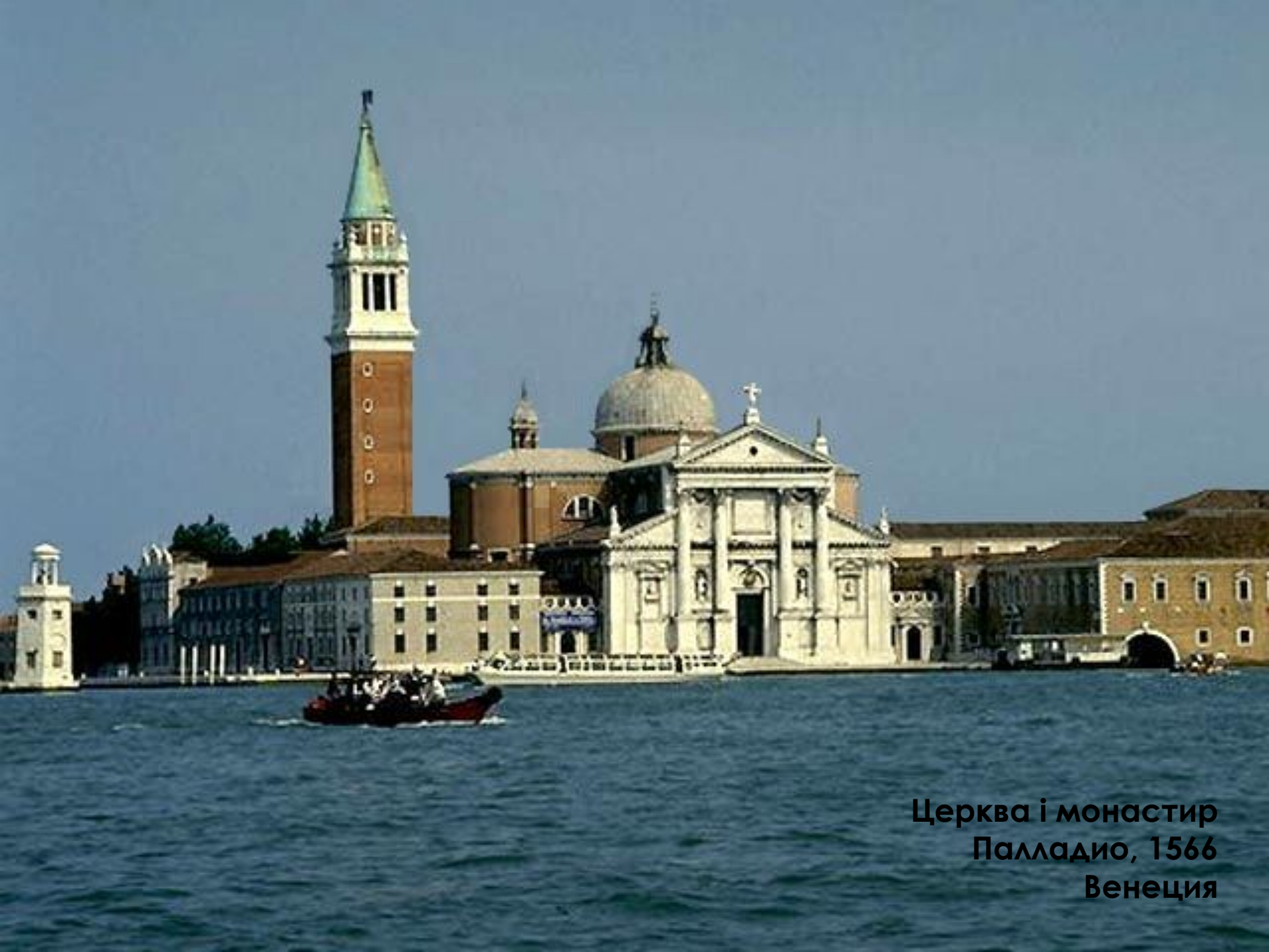
Церква і монастир Палладіо, 1566 Венеція