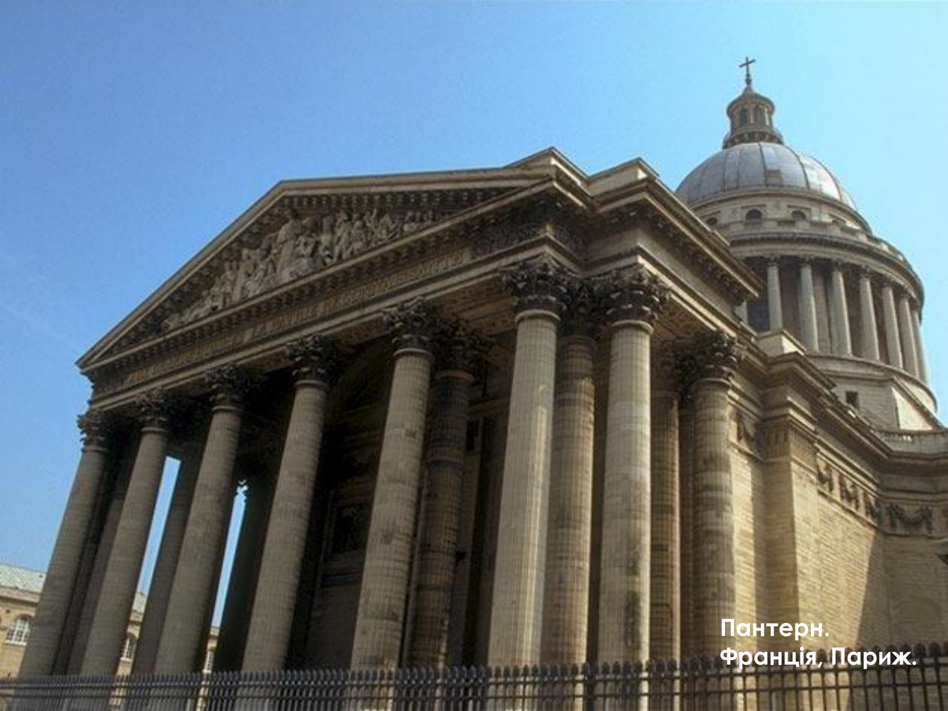
Пантерн. Франція, Париж.