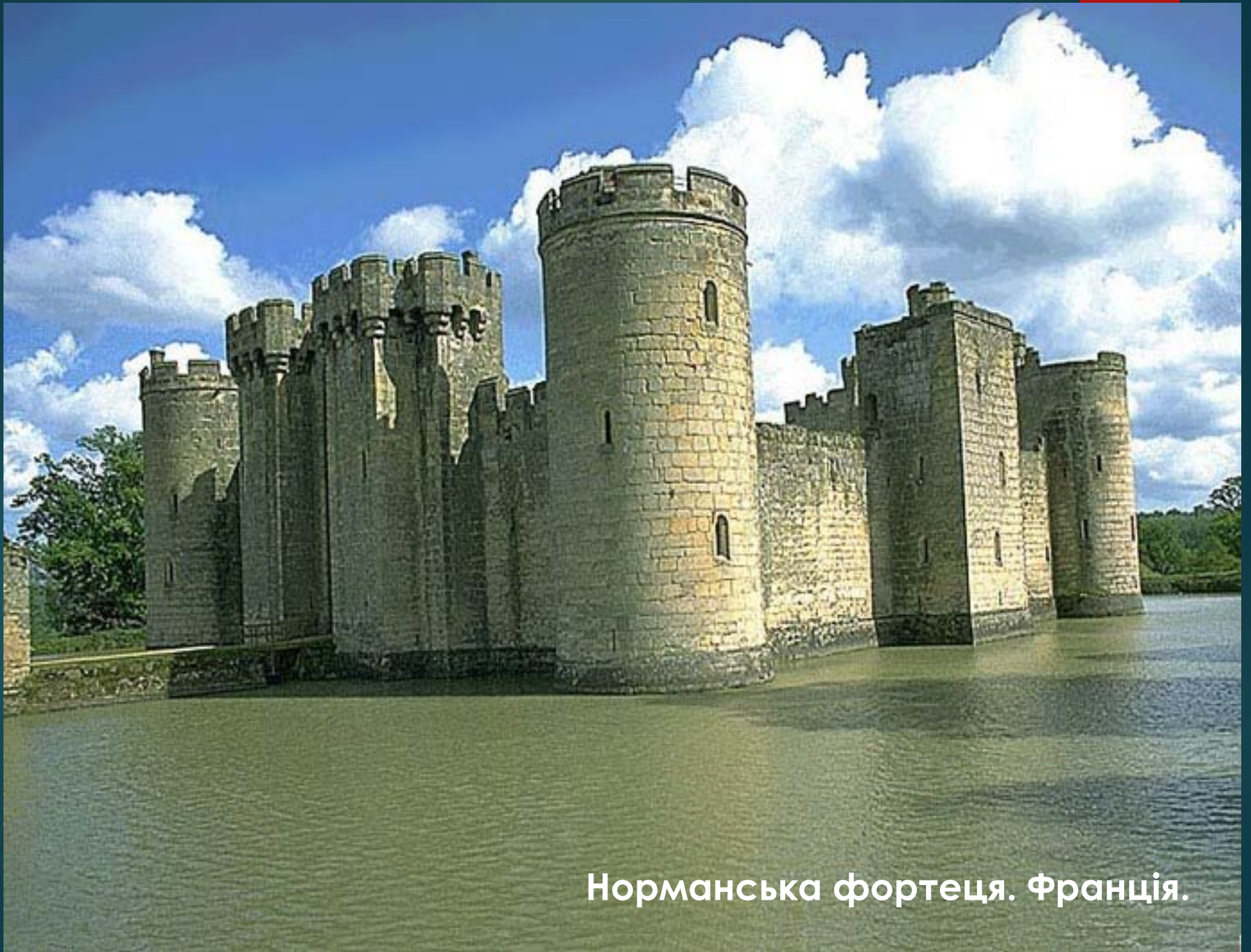
Норманська фортеця. Франція.