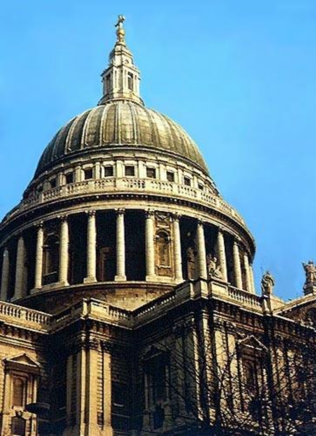
Собор Святого Павла. Лондон, Великобританія.