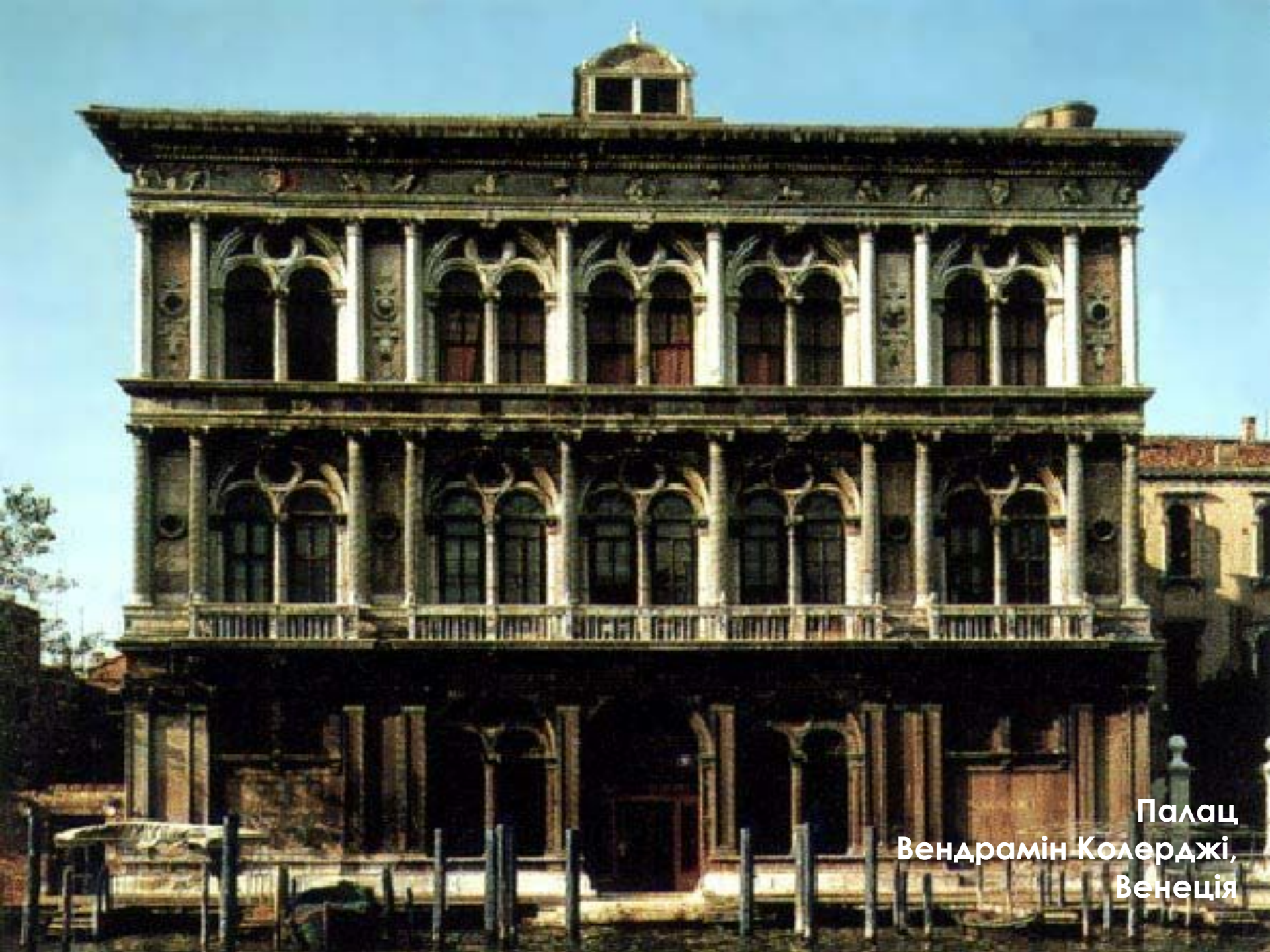
Палац Вендрамін Колерджі, Венеція