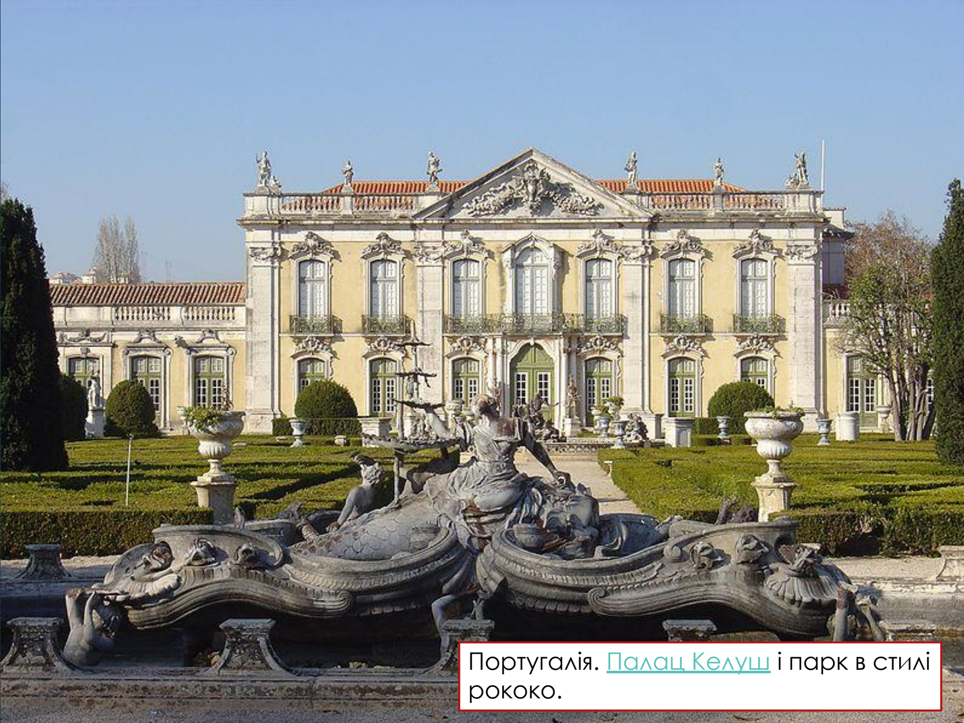
Португалія. Палац Келуш і парк в стилі рококо.