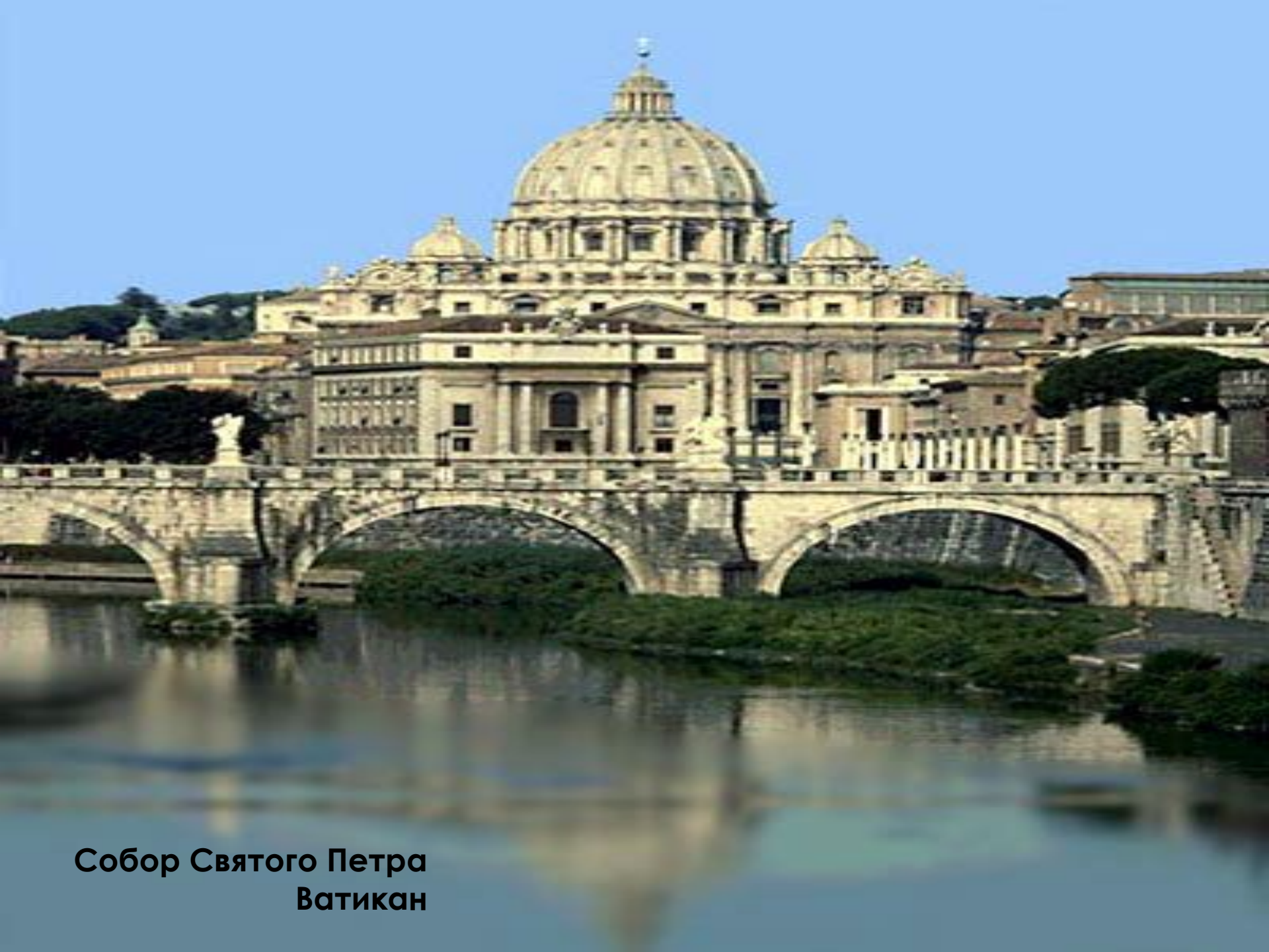
Собор Святого Петра Ватикан