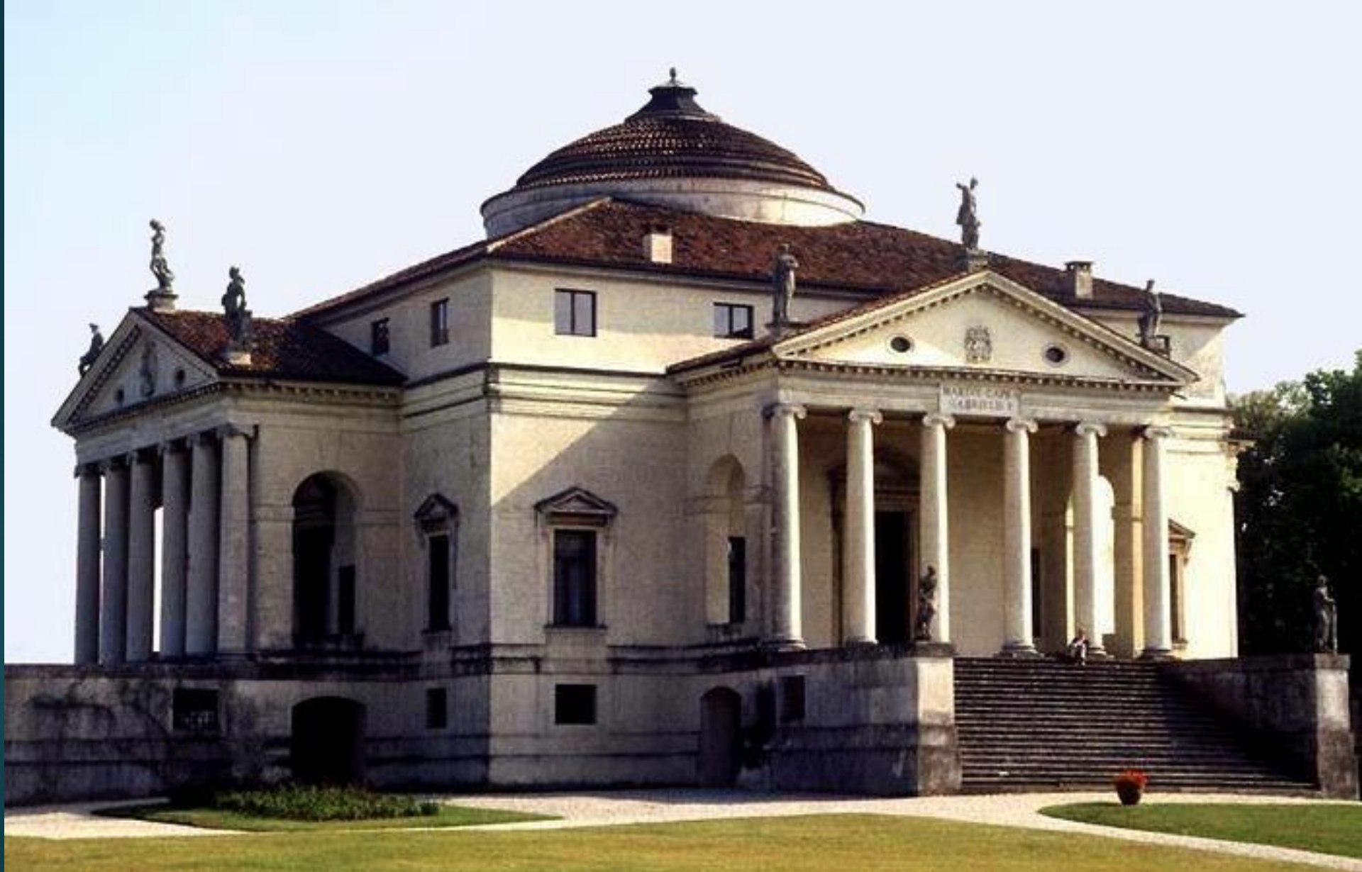
Вілла Ротонда Італія