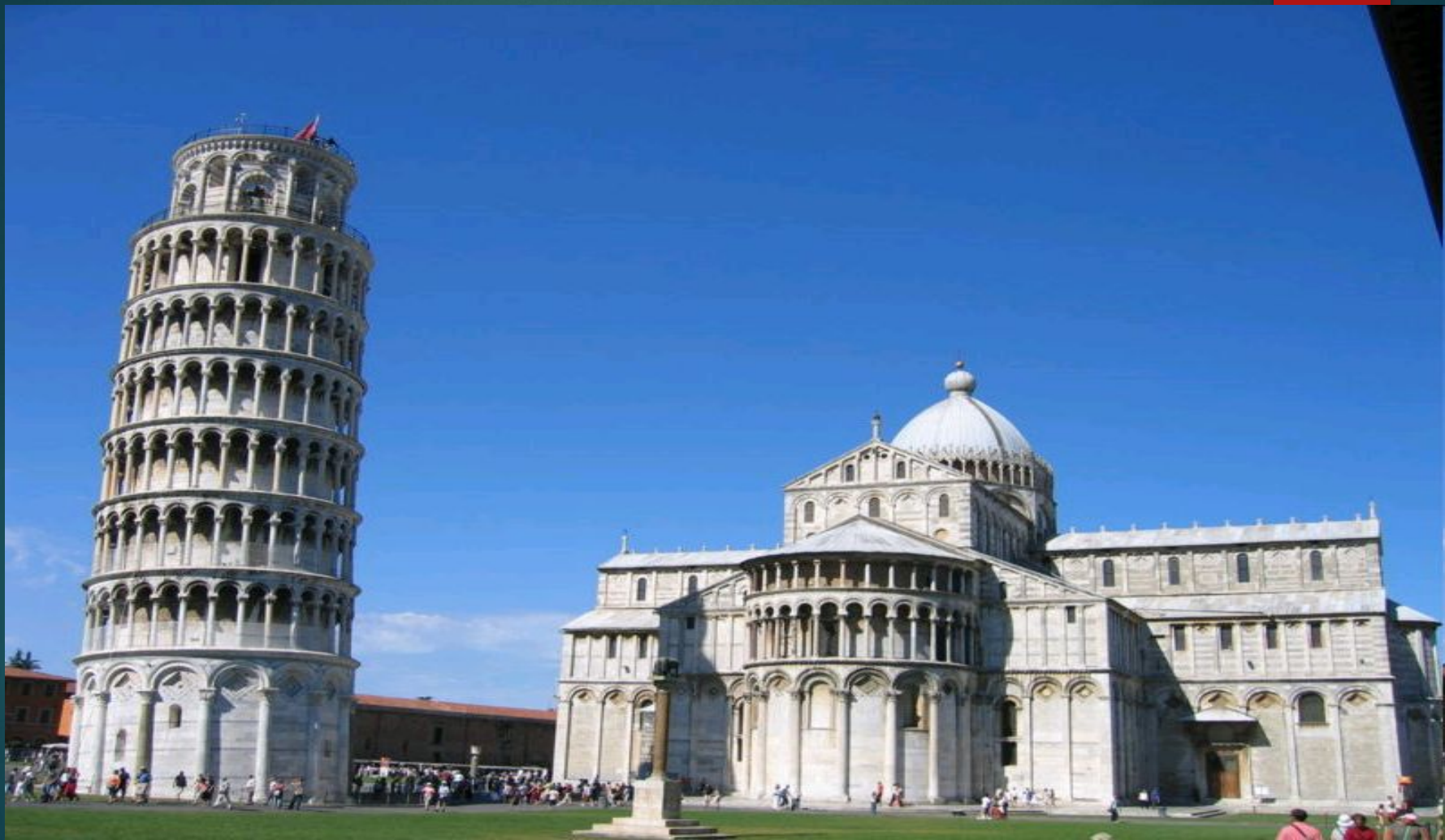
Пізанська вежа та собор