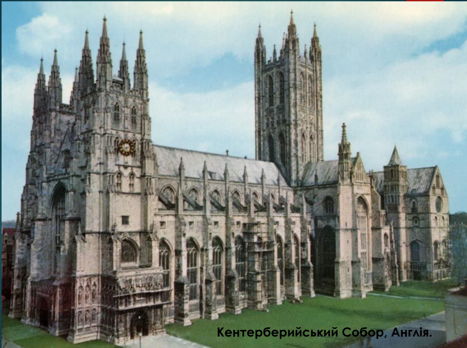
Кентерберийський Собор, Англія.