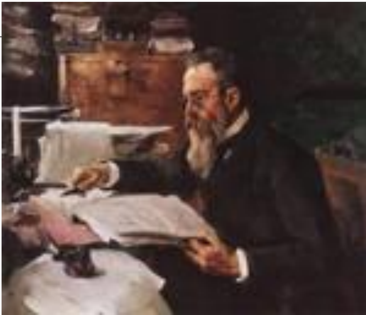
Портрет композитора Н.А.Римского-Корсакова.