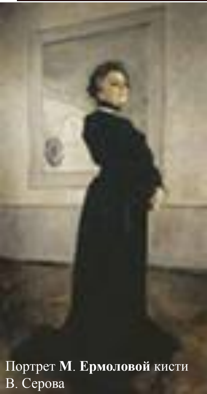
Портрет М. Ермоловой кисти В. Серова