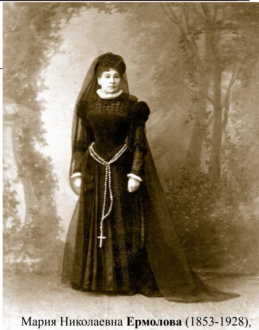
Мария Николаевна Ермолова (1853-1928), русская актриса...