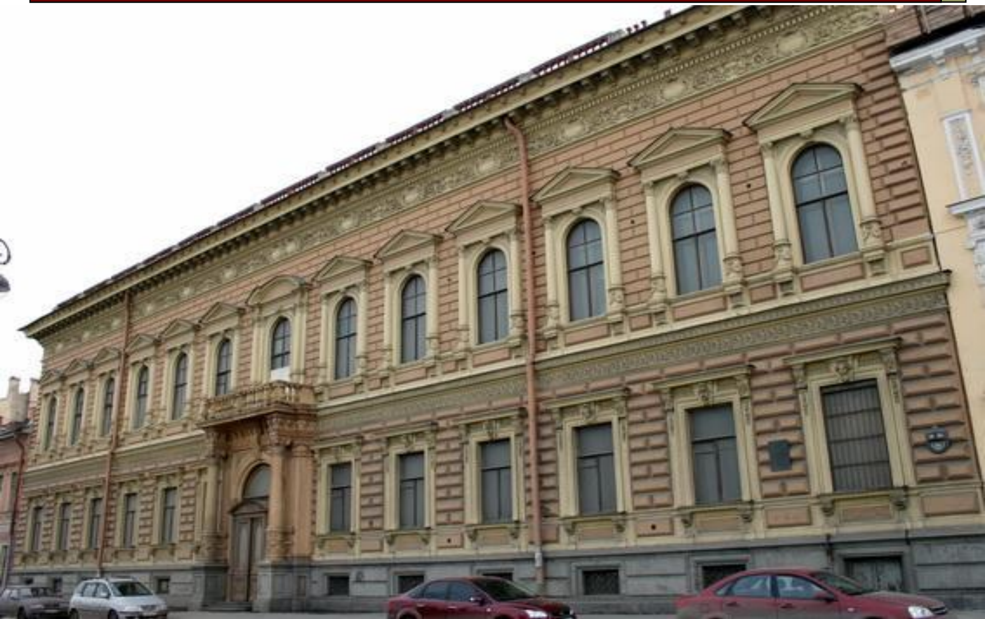
Особняк барона Штиглица на Английской набережной Невы.