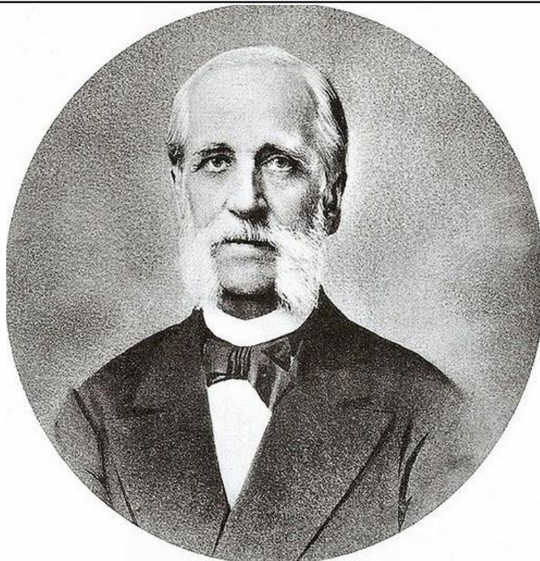
Архитектор А.И. Кракау