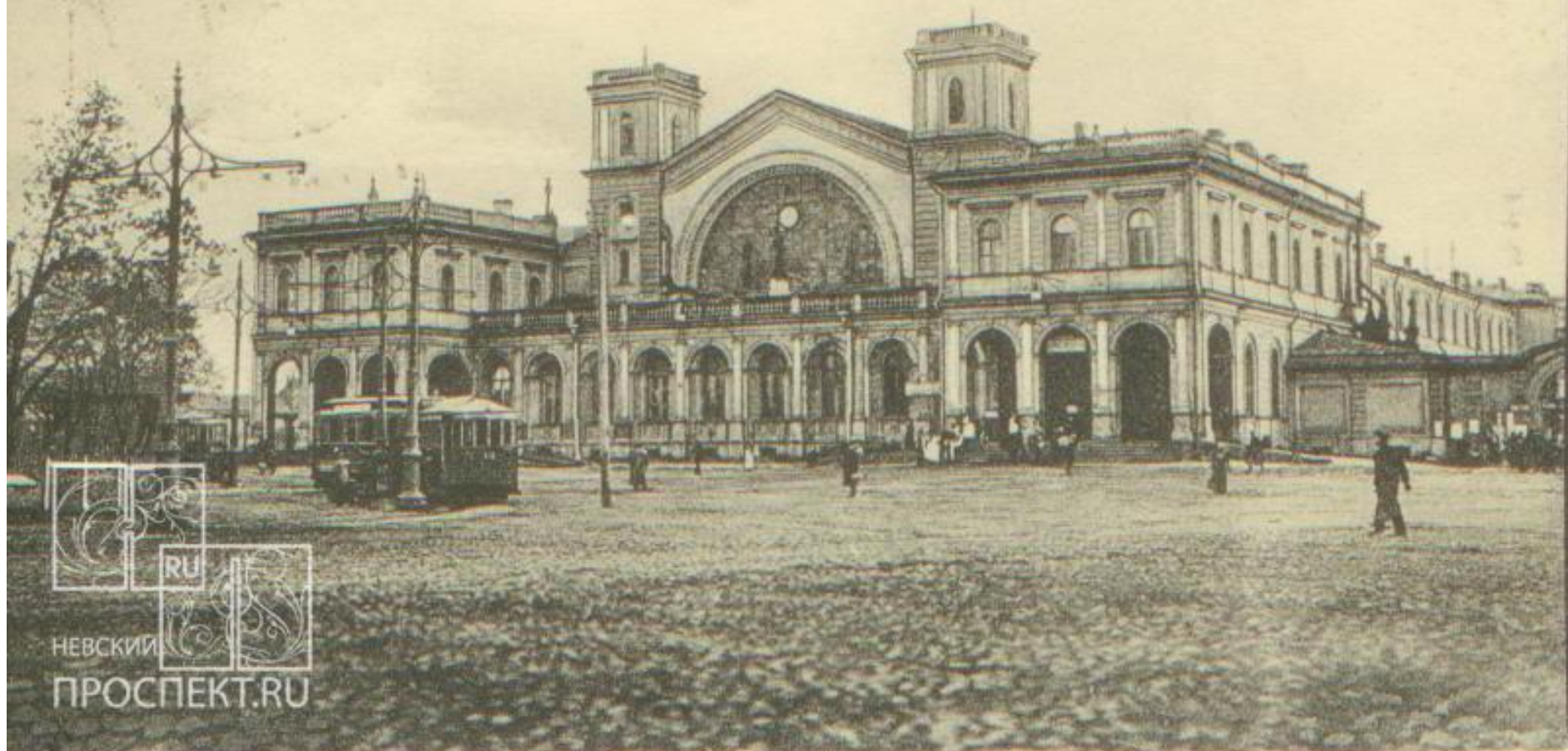
Здание Балтийского вокзала, находится на набережной Обводного канала.