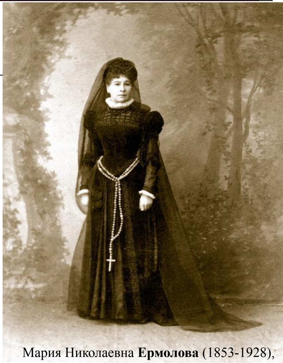
Мария Николаевна Ермолова (1853-1928), русская актриса...