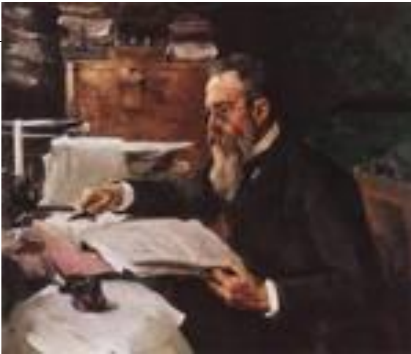
Портрет композитора Н.А.Римского-Корсакова.