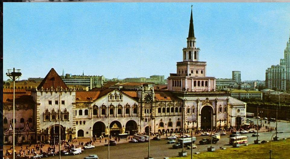
здание Казанского вокзала