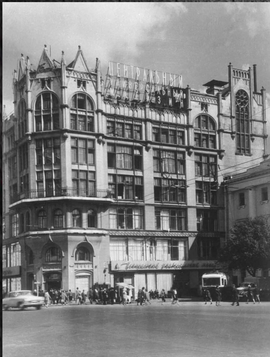
Здание магазина "Мюр и Мерилиз" (ныне Центральный универмаг)