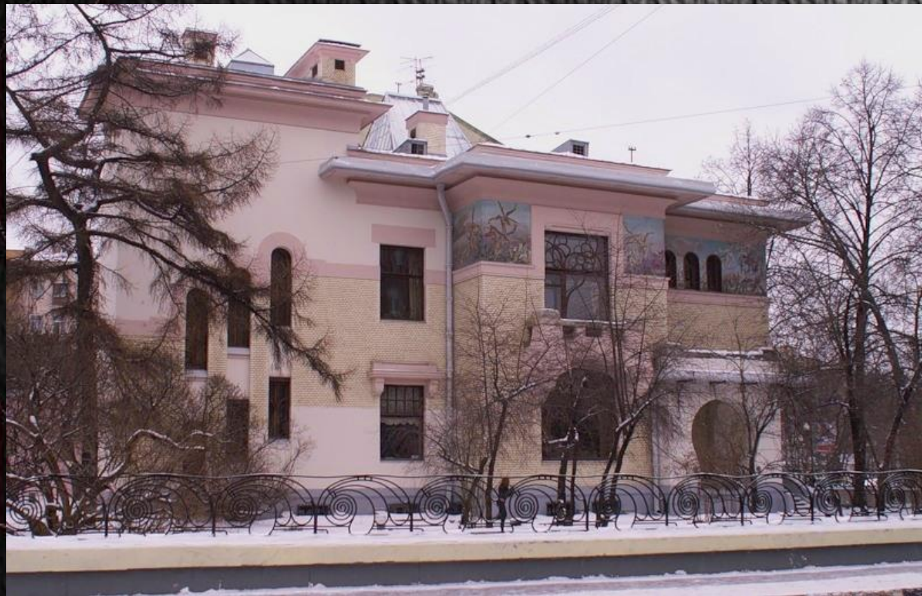
Особняк Рябушинского (1900-1902)