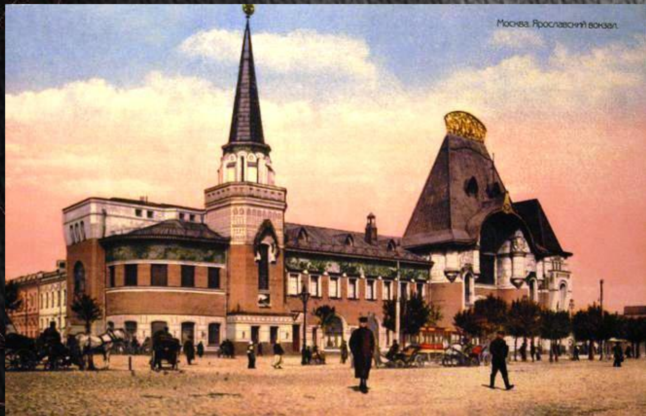
здание Ярославского вокзала