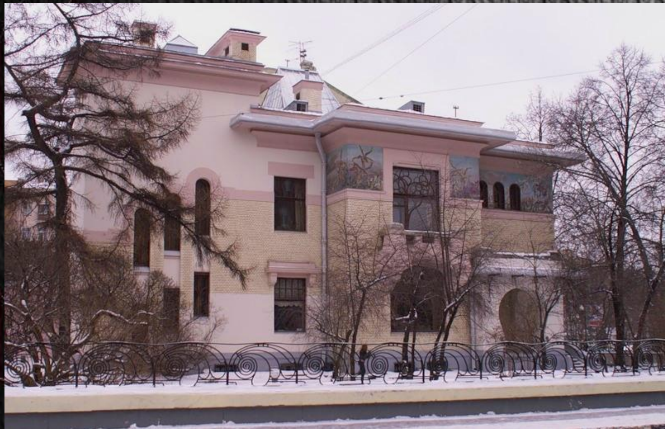
Особняк Рябушинского (1900-1902)