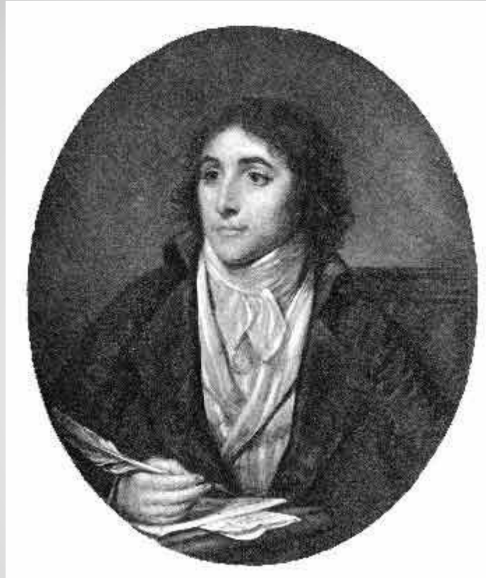
Жан Батист Грёз (1725-1805)