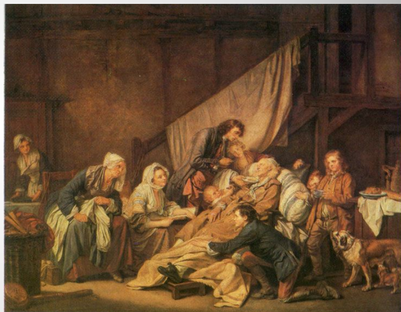
«Паралитик, за которым ухаживают его дети, или Плоды хорошего воспитания»,

бытовые картины с пропагандой банальных житейских истин