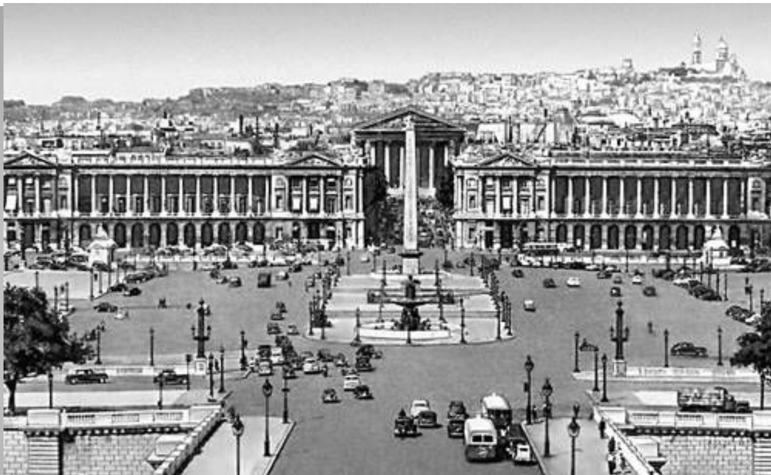
Площадь Согласия. 1753-75. Архитектор Ж. А. Габриель