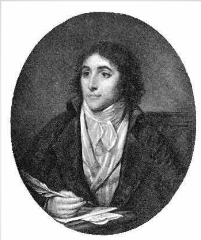
Жан Батист Грёз (1725-1805)