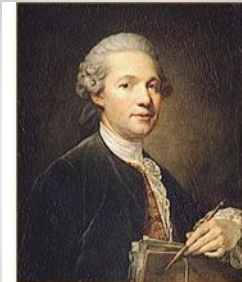
Жак Анж Габриэль