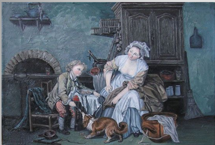
«Балованное дитя, или Плоды дурного воспитания»