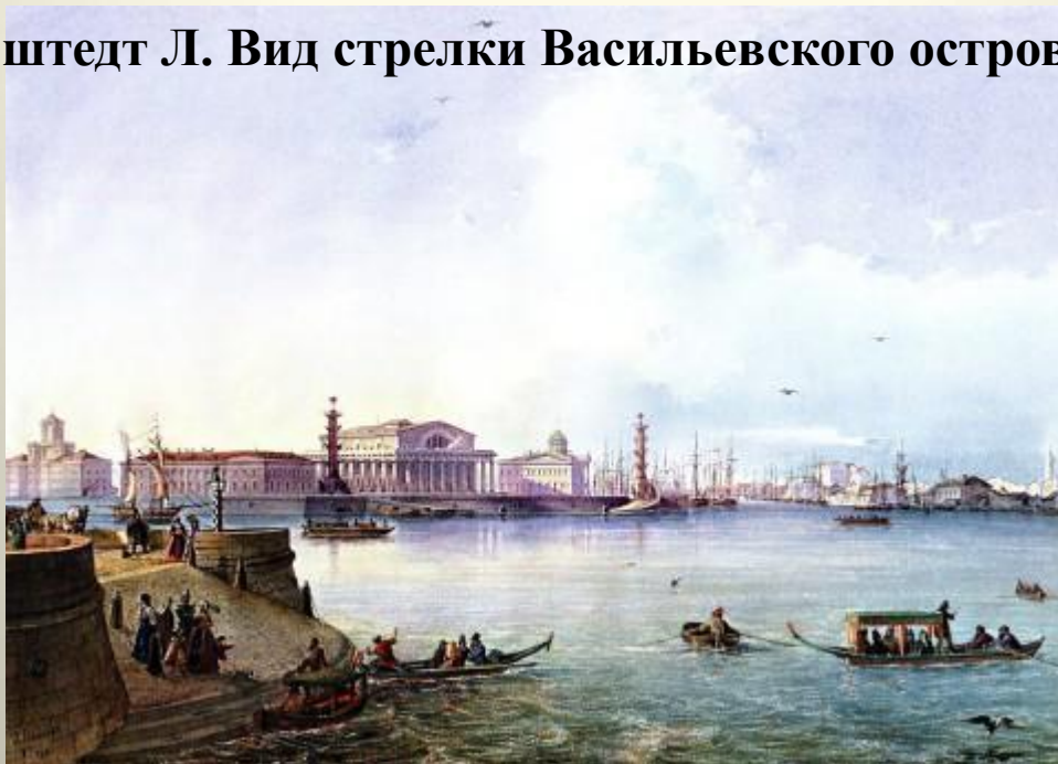
Бонштедт Л. Вид стрелки Васильевского острова. 1847 г

Благодаря удачно найденному масштабу, биржевой ансамбль превосходно согласуется с ансамблем Петропавловской крепости и застройкой Дворцовой набережной. Он явился тем недостающим звеном, которого так не хватало для завершения столь привычного теперь облика городского центра.