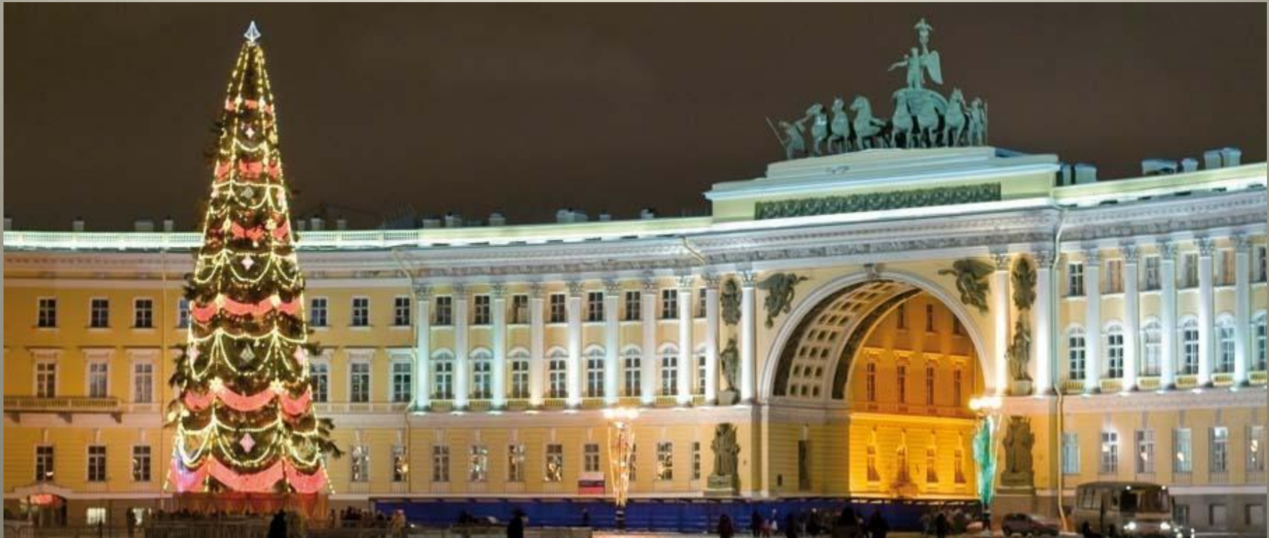
Карл Росси. Арка Генерального штаба

17 апреля 1819 года архитектор приступил к созданию двух величественных корпусов здания Главного штаба и арки между ними. Градостроительные замыслы Росси здесь проявились в изменении направления Большой Морской улицы, которую зодчий вывел под аркой точно по оси въездных ворот в Зимний дворец.