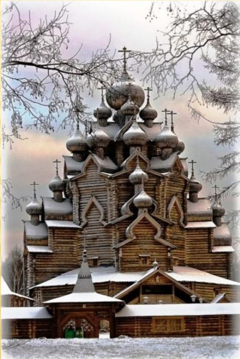
Преображенская церковь в Кижях

Вершиной древнерусского деревянного зодчества стали многоглавые церкви. Русские плотники, передававшие строительный опыт из поколения в поколение, по-новому осмысливали уже освоенные формы и разрабатывали выразительнейшие в художественном и строительном отношении композиции. Различные по высоте и силуэту, церкви Кижского погоста составляют единую живописную группу.