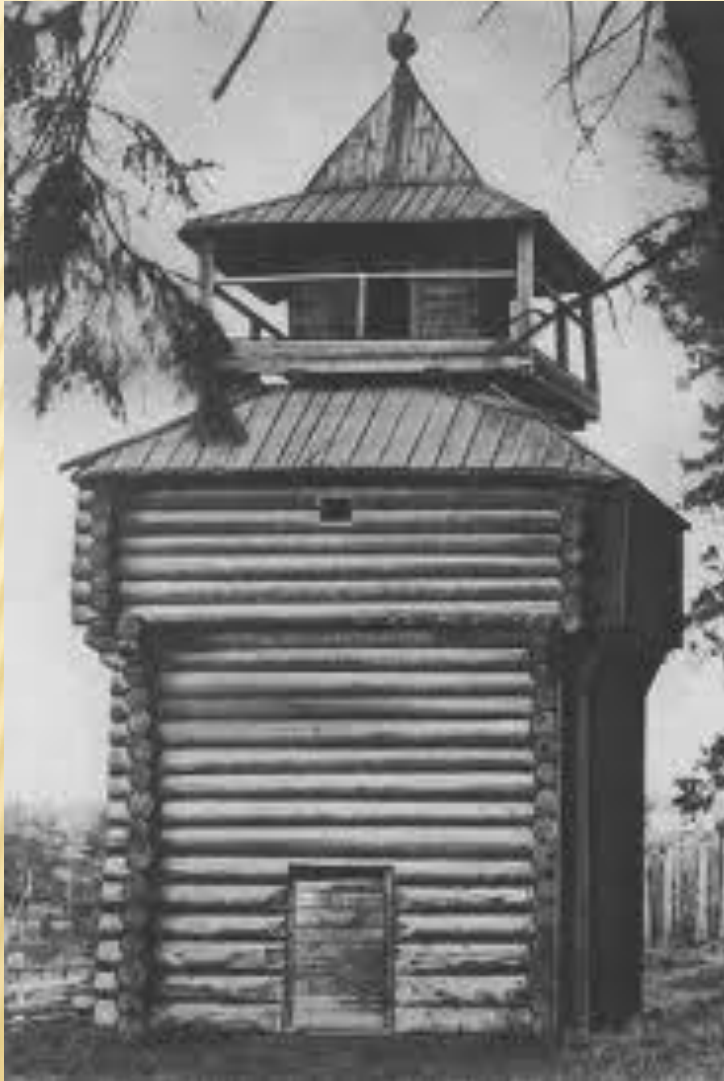
Башня Илимского острога. XVII век