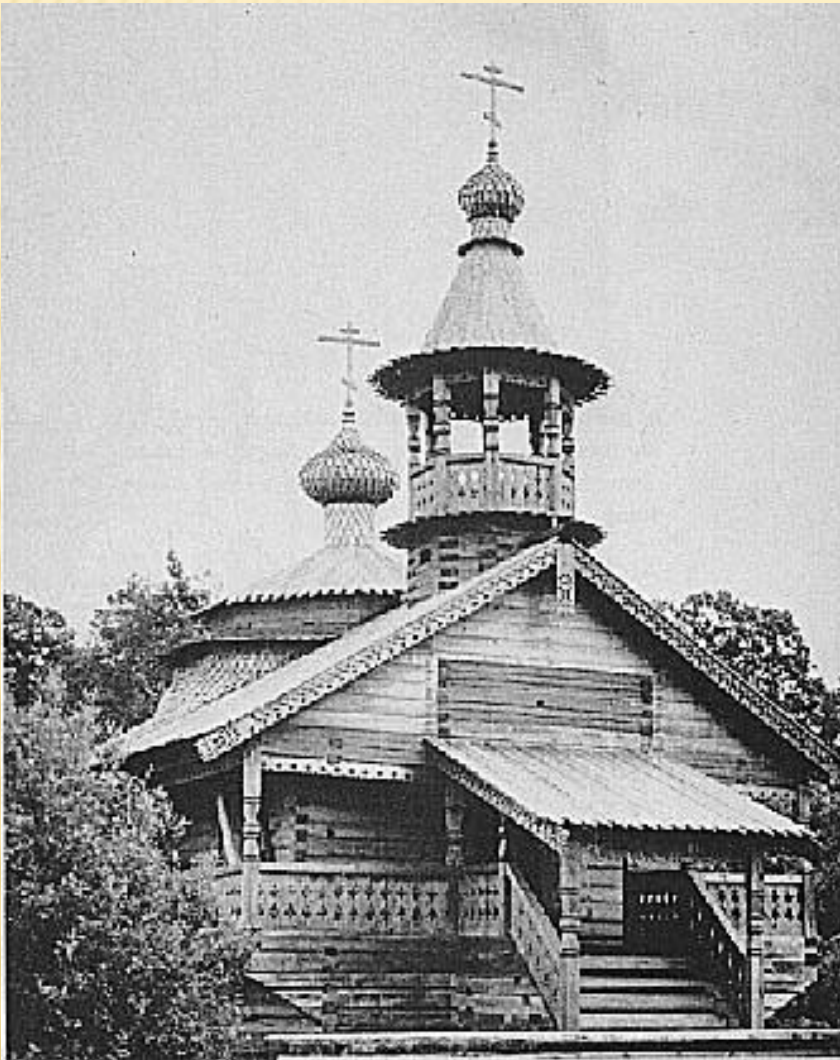
Часовня. XVII в. Село Кашира (Маловишерский район, Новгородская область)