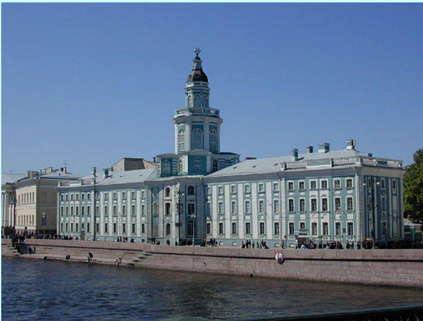
Кунсткамера. Арх. Георг Маттарнови, Николай Гербель, Михаил Земцов, Савва Чевакинский.