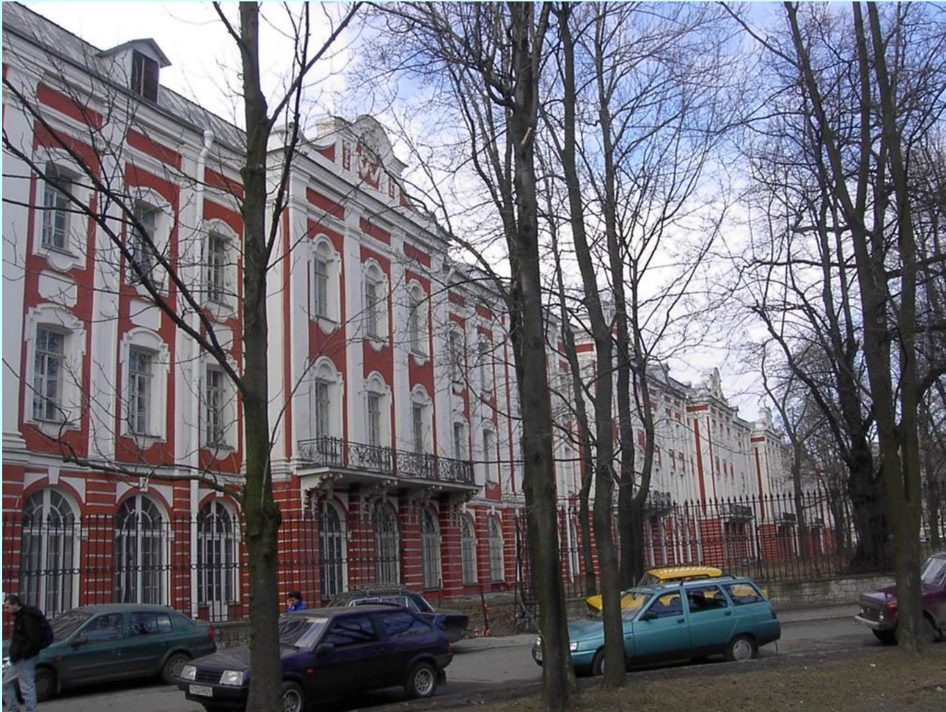
Здание 12 коллегий. Арх. Доменико Трезини