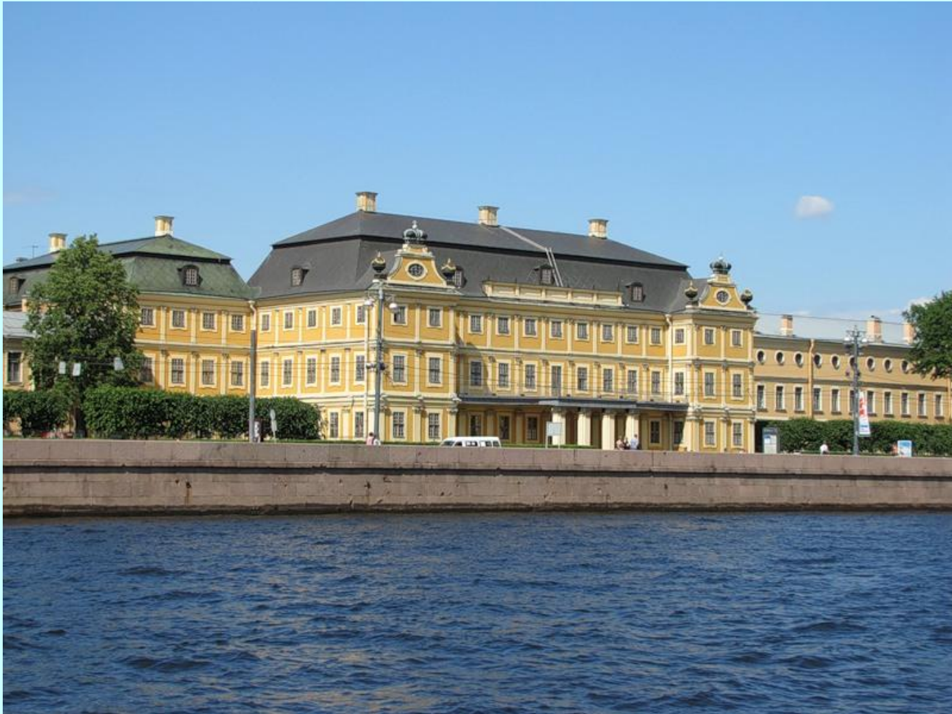
Меншиковский дворец. Арх. Джованни Фонтана и Готфрид Шедель