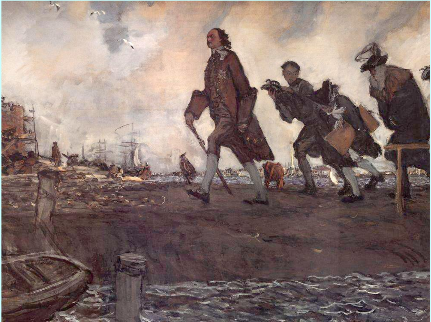
Пётр I Великий. Худ. Валентин Серов.