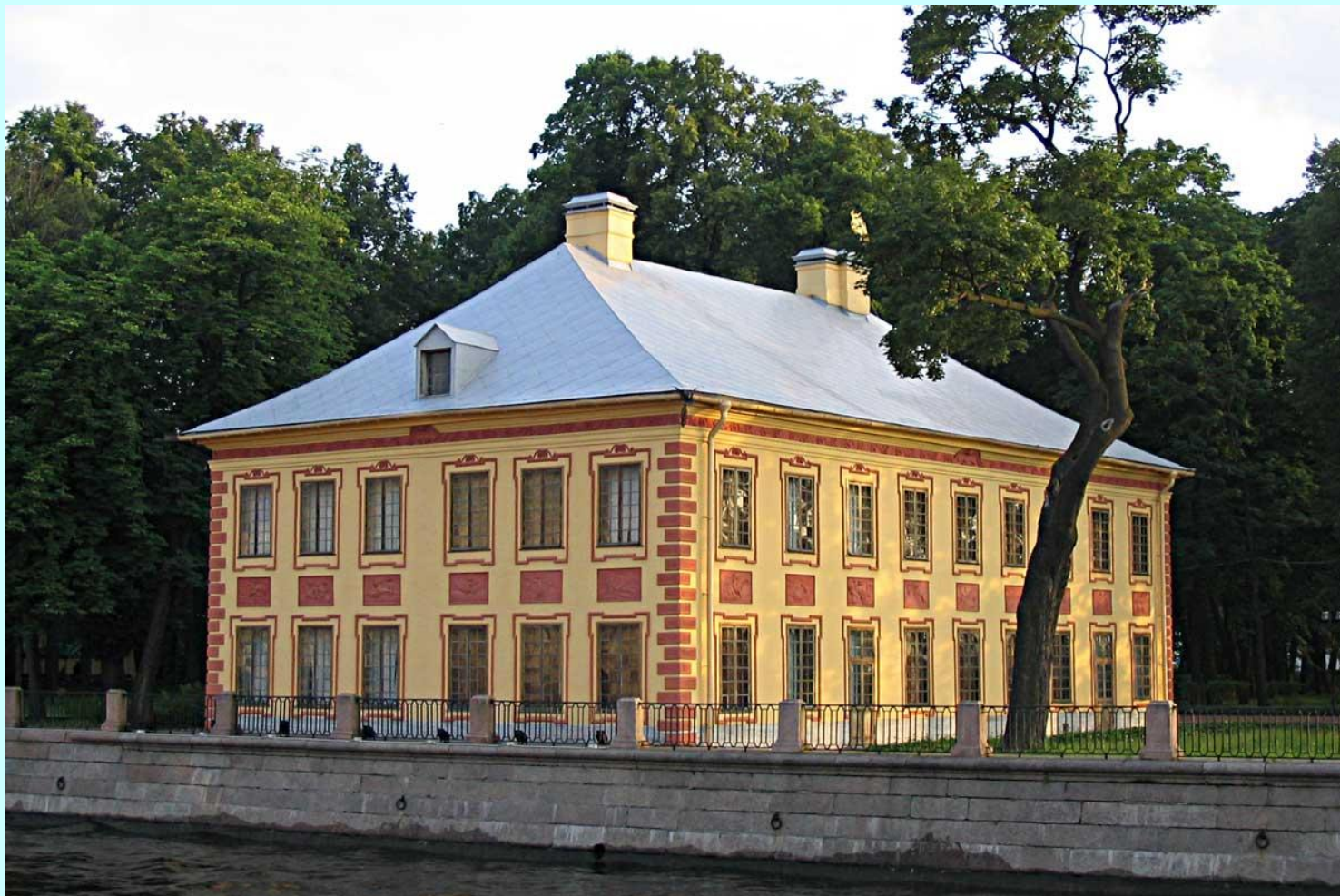
Летний дворец. Арх. Доменико Трезини.