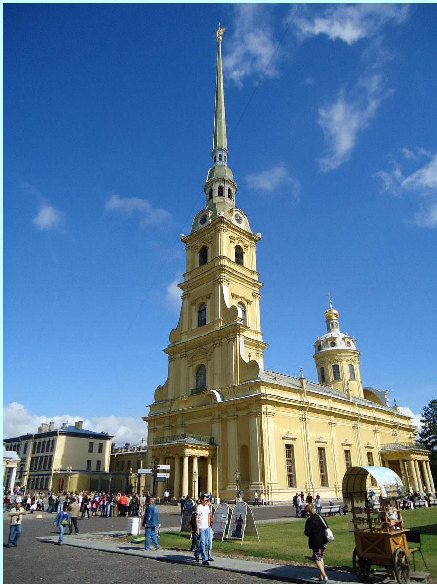
Петропавловский собор. Арх. Доменико Трезини