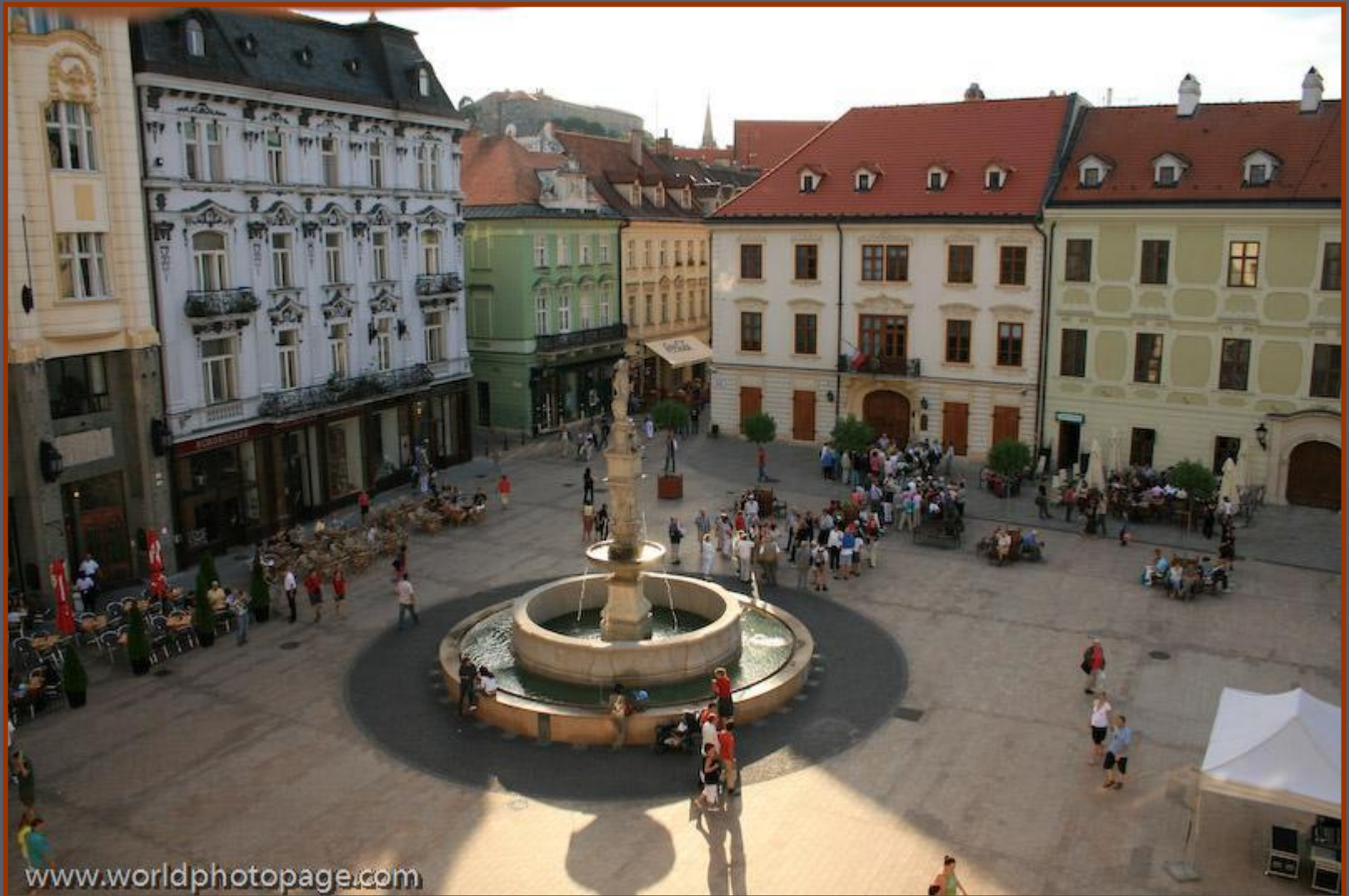
Фонтан на центральной площади средневекового города