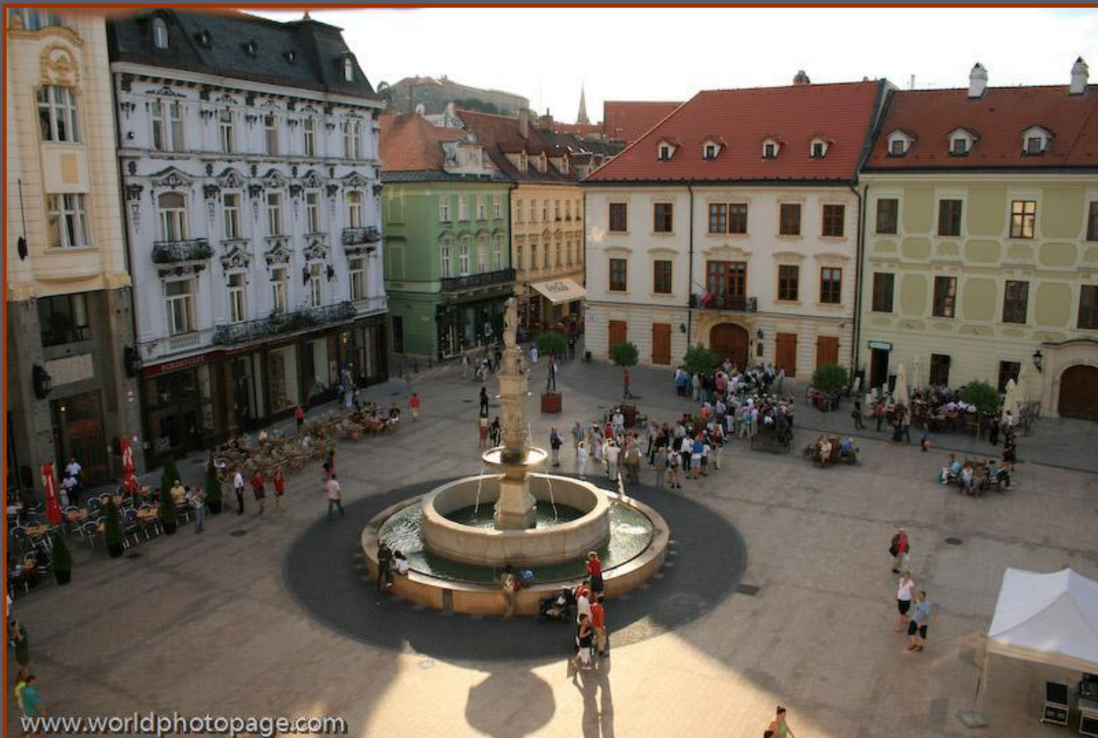
Фонтан на центральной площади средневекового города