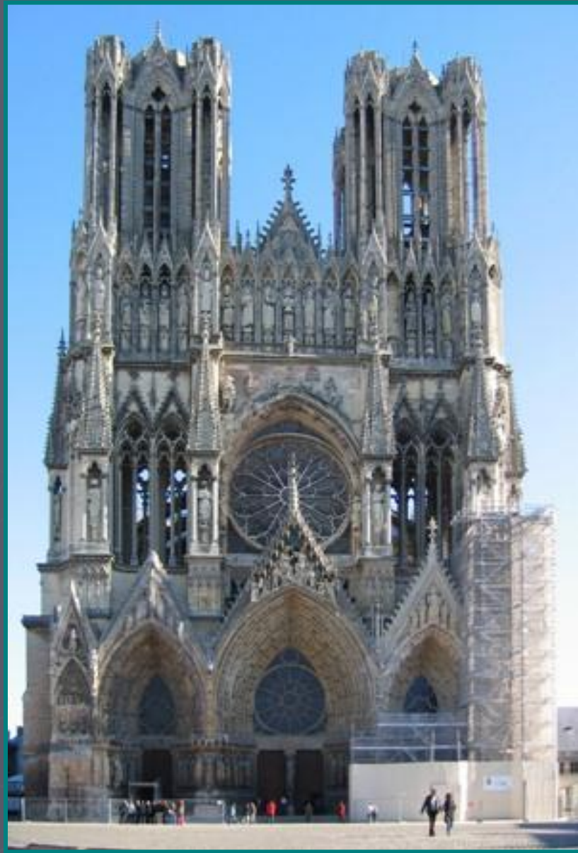
Готический средневековой собор