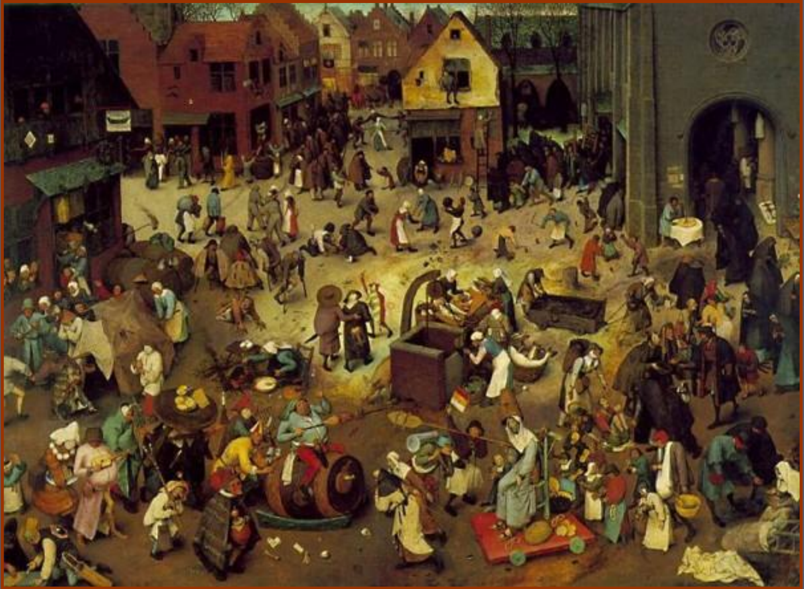
Питер Брейгель Старший «Встреча поста с масленицей»